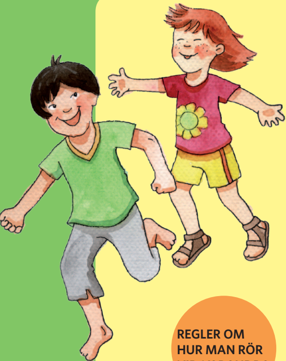
REGLER OM HUR MAN RÖR VID VARANDRA

Man visar inte de privata kroppsdelarna för alla, trots att de är fina och värdefulla.