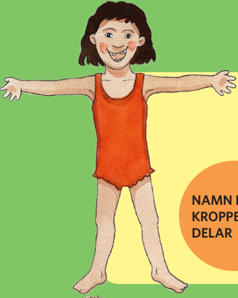
NAMN PÅ KROPPENS DELAR