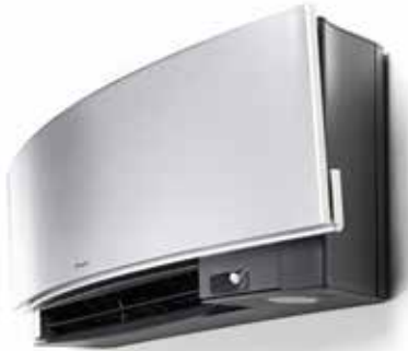
Fluisterstil tot 19 dB(A)

De intelligente sensor met twee zones regelt het comfort op twee manieren. Wanneer er langer dan 20 minuten niemand in de kamer is, wordt de ingestelde temperatuur aangepast om energie te besparen. Zodra iemand de kamer binnenkomt, keert de unit automatisch terug naar de oorspronkelijke temperatuur. De intelligente sensor met twee zones zorgt er ook voor dat de luchtstroom wordt weggeleid van mensen in de kamer zodat koude tocht wordt vermeden.