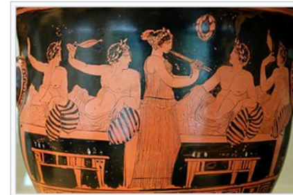
A female aulos -player entertains men at a symposium on this Attic red-figure bell-krater , c. 420 BC