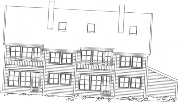
fasade mot vest