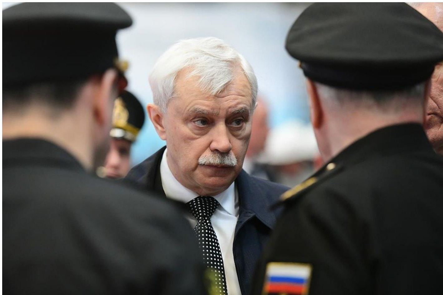
Экс-губернатор Санкт-Петербурга Георгий Полтавченко.

то четкий правовой механизм, который позволил бы создать отдельное специализированное подразделение, куда бы мы всю эту публику свозили. Вот на это деньги мы найдем», — уверял он. Не нашел, но может, это и к лучшему?