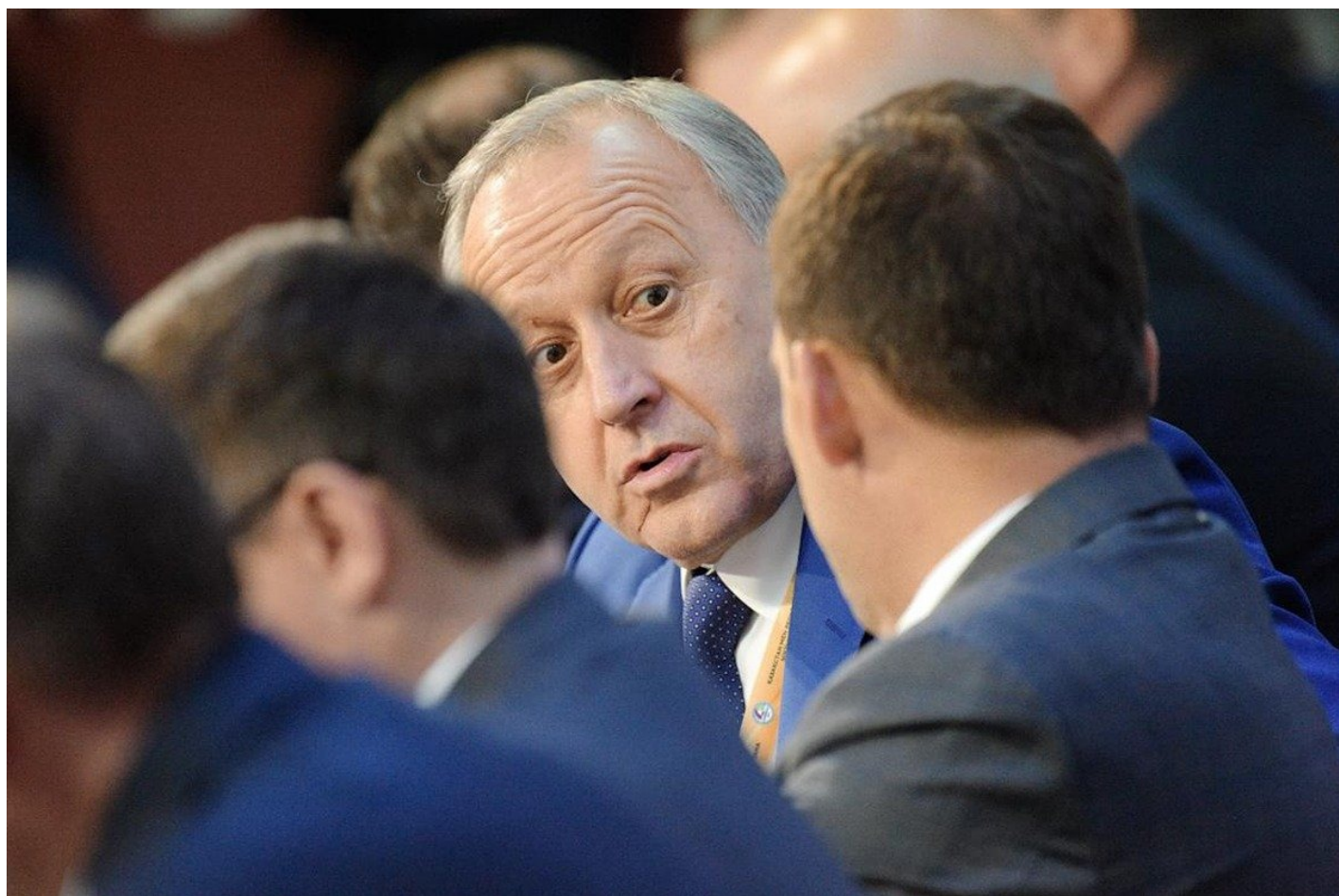
Губернатор Саратовской области Валерий Радаев.

А в начале 2022 года саратовские журналисты заметили : Радаев не выполнил обещание из своей предвыборной программы по завершению в 2018 году долгостроя — спорткомплекса «Газовик» в областном центре. Строительство ведется с ноября