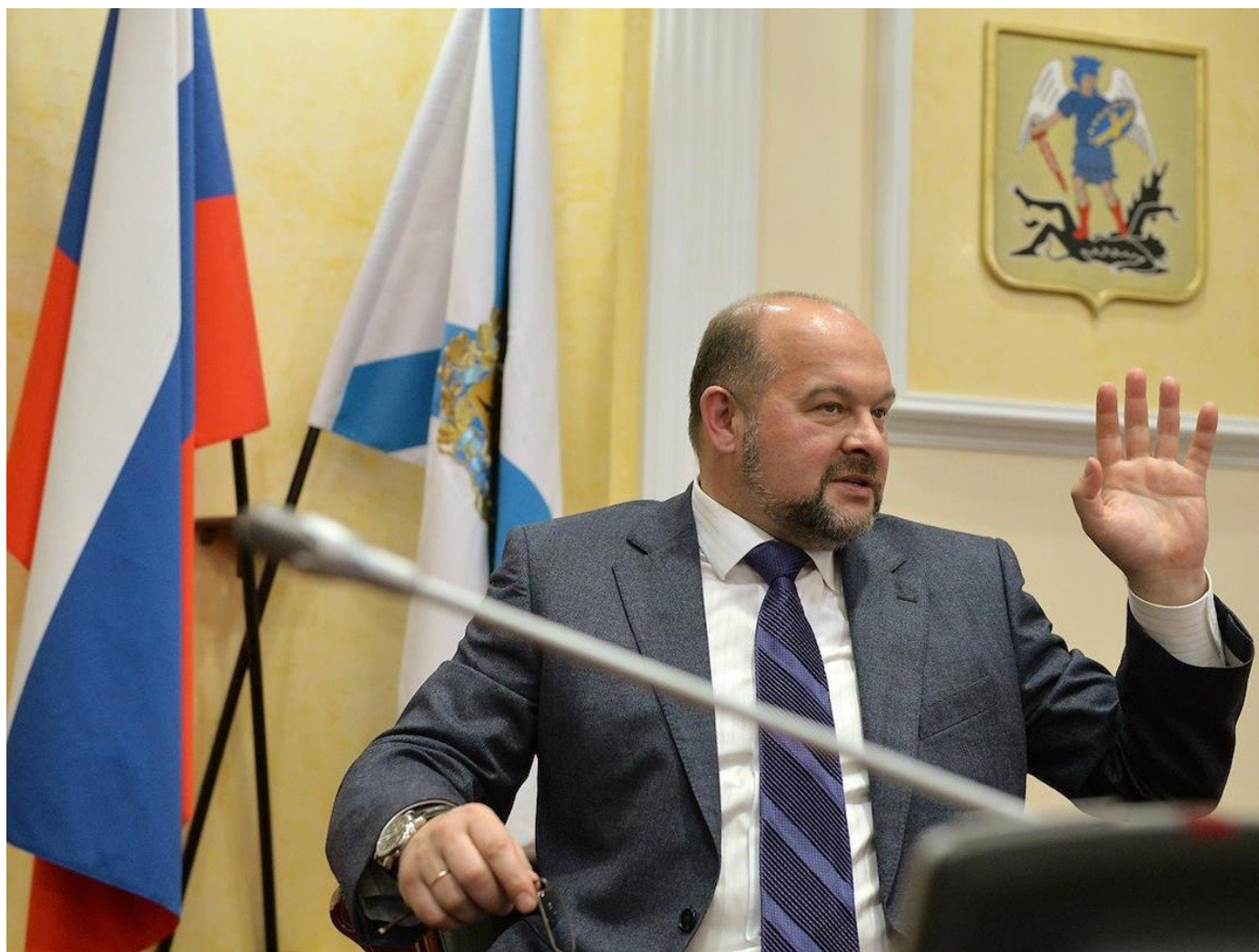
Экс-губернатор Архангельской области Игорь Орлов.

А вот обещания федеральных чиновников. Экс-министр транспорта Максим Соколов в 2016 году обещал «обеспечить приведение в стопроцентно нормативное состояние российские дороги уже к концу 2018 года». Не довольствуясь эмпирическими наблюдениями, сошлемся на данные Росстата, согласно которым доля дорог регионального и муниципального или межмуниципального местного значения, отвечающих нормативным требованиям, по итогам 2022 года — 52,6%.