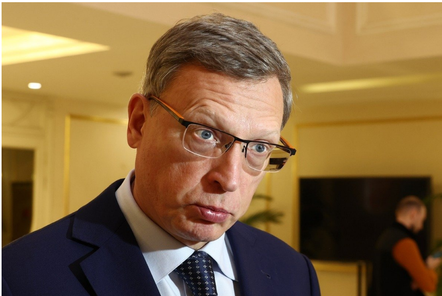
Губернатор Омской области Александр Бурков.

губернаторскому отчету, «к 320-му дню рождения Петербурга были выпущены сувенирные карты «Подорожник». Ранее Беглов обещал к 2050 году построить аж 89 станций метро. Позднее он сообщил , что его «не так поняли».