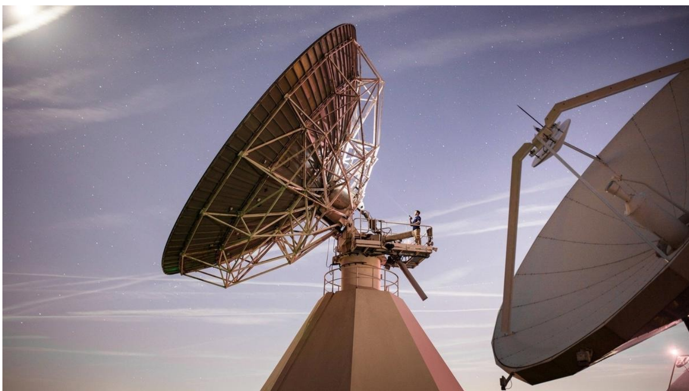
Станция связи Eutelsat.

У россиян появится возможность смотреть независимые каналы — через французский спутник