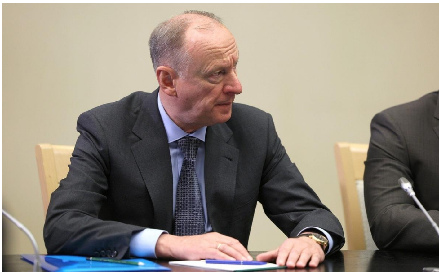
Николай Патрушев.