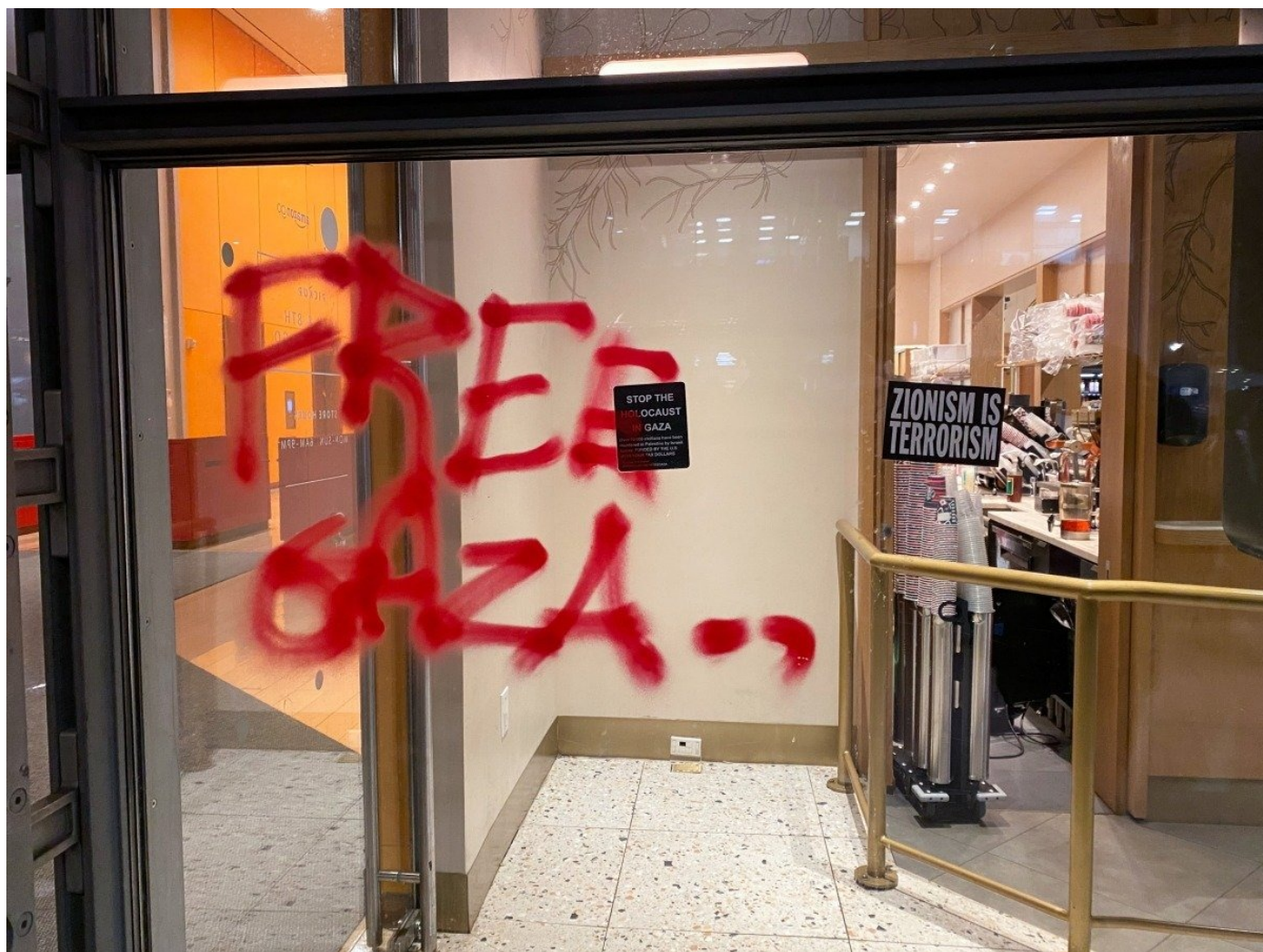
Витрина магазина, раскрашенная пропалестинскими активистами в Нью-Йорке после демонстрации.

— Это же один из самых банальных и беспроигрышных рекламных приемов: не можешь придумать, как продать товар, рисуй детей и животных.