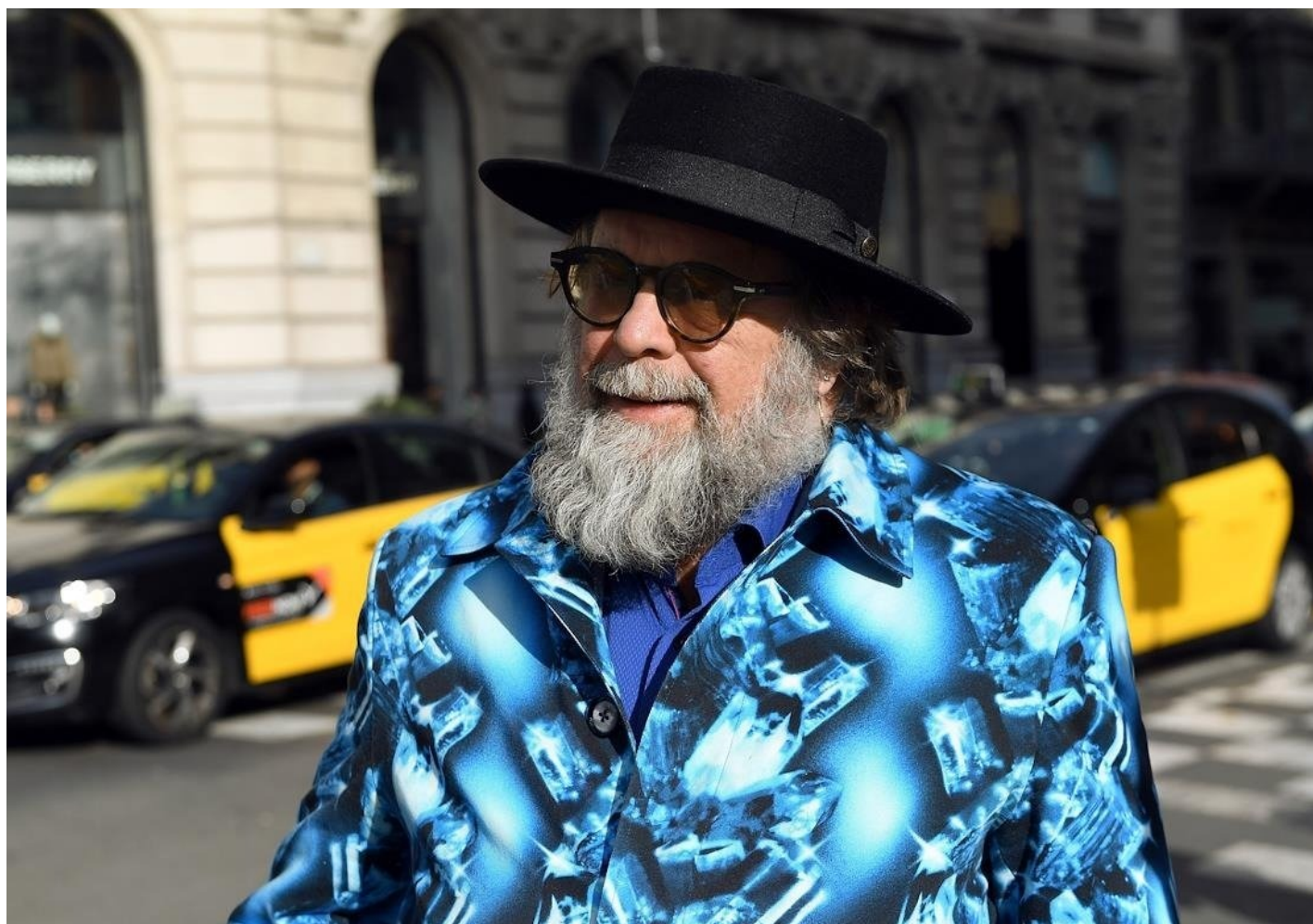
Борис Гребенщиков.

Только что посмотрела интервью Бориса Гребенщикова (объявлен иноагентом) Антону Желнову на портале Forbes Talk. Ему скоро исполнится 70 лет, он мудр, кроток, просветлен, полон сил. БГ похож на реку, несущую свои глубокие воды вопреки цистернам грязи, которые выливаются в эту реку. Никого не отменяет, всех принимает, всех понимает. Опытный Желнов нервничает, он не готов к такому градусу внутренней свободы. БГ никуда не бежал, не эмигрировал, он уже лет тридцать живет за границей. Желнов уточняет: раньше вы приезжали в Россию, а теперь нет. Иноагент Гребенщиков посмотрел на него внимательно и тихо ответил: мне удобнее работать не в тюрьме, а на свободе.