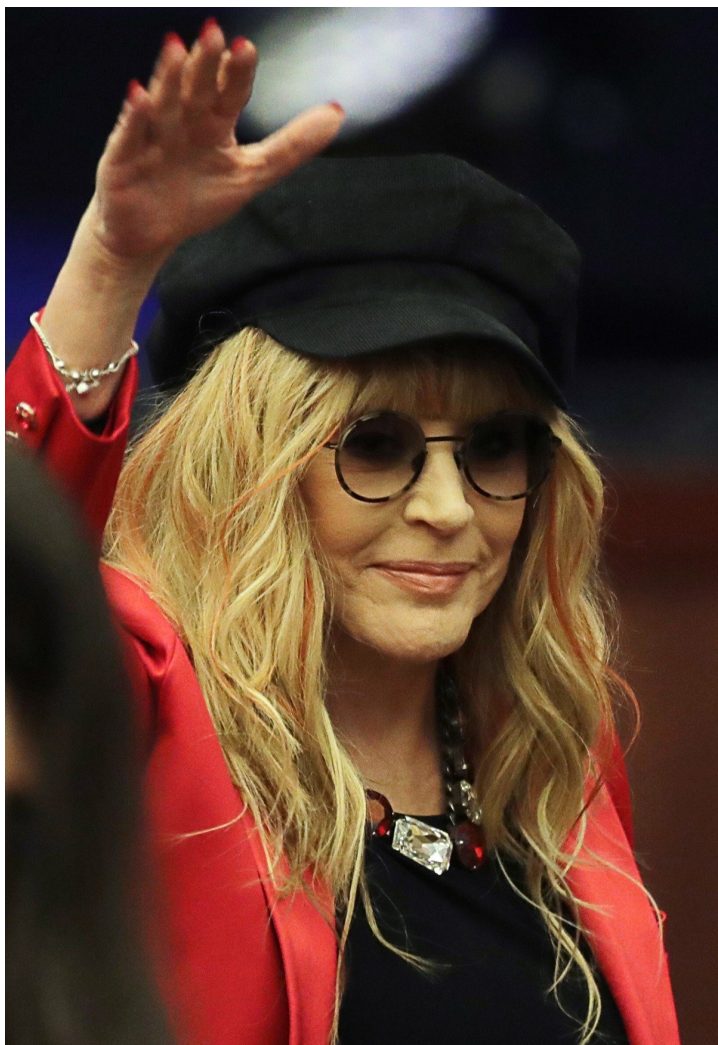
Алла Пугачева.