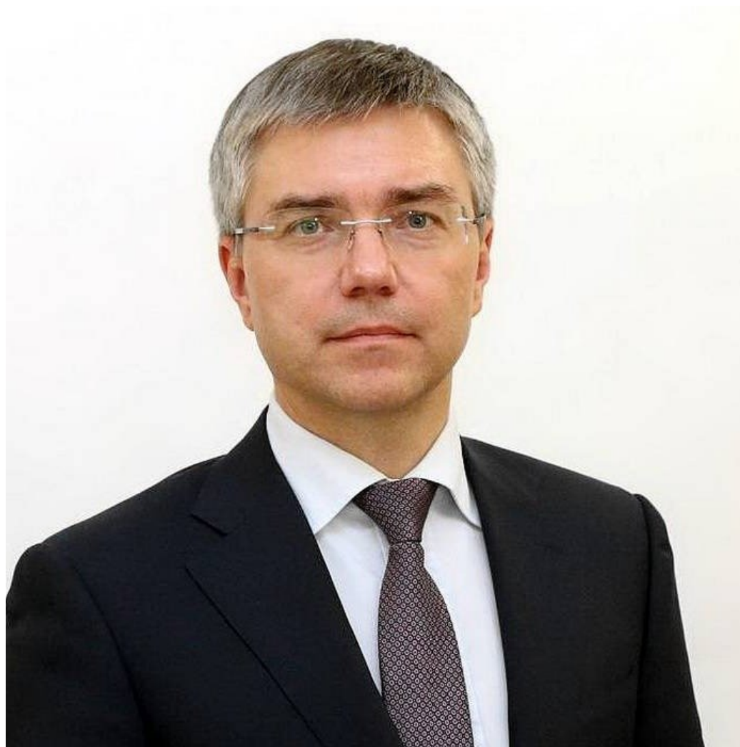
Евгений Ревенко.

Евгений Ревенко — в прошлом ведущий программ «Вести» и «Вести недели». Неудивительно, что медиа его волнуют. В мае 2021 года стал автором поправок к закону «О СМИ», ужесточающих правила цитирования других изданий, возложив на редактора ответственность за содержание цитат. Соавтор закона о блокировках СМИ.