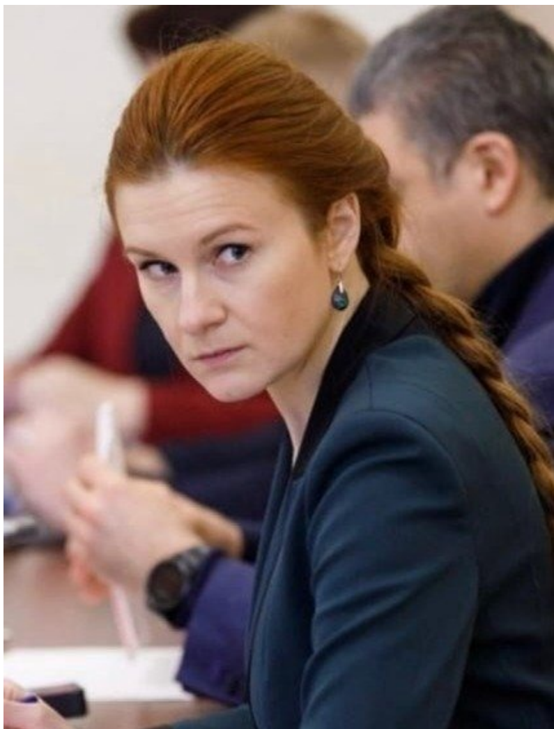
Мария Бутина.

Еще одна звезда иноагентского закона — Мария Бутина . Экс-заключенная американской тюрьмы, ведущая пропагандистских программ на российском гостВ, основательница общественной организации «Право на оружие».