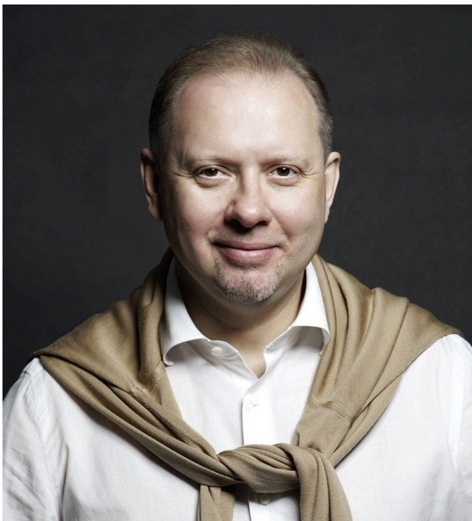
Олег Матвейчев.

Он рекомендовал создать Агентство по делам одиночества, чтобы бороться с душевными расстройствами. Например — с желанием купить iPhone.