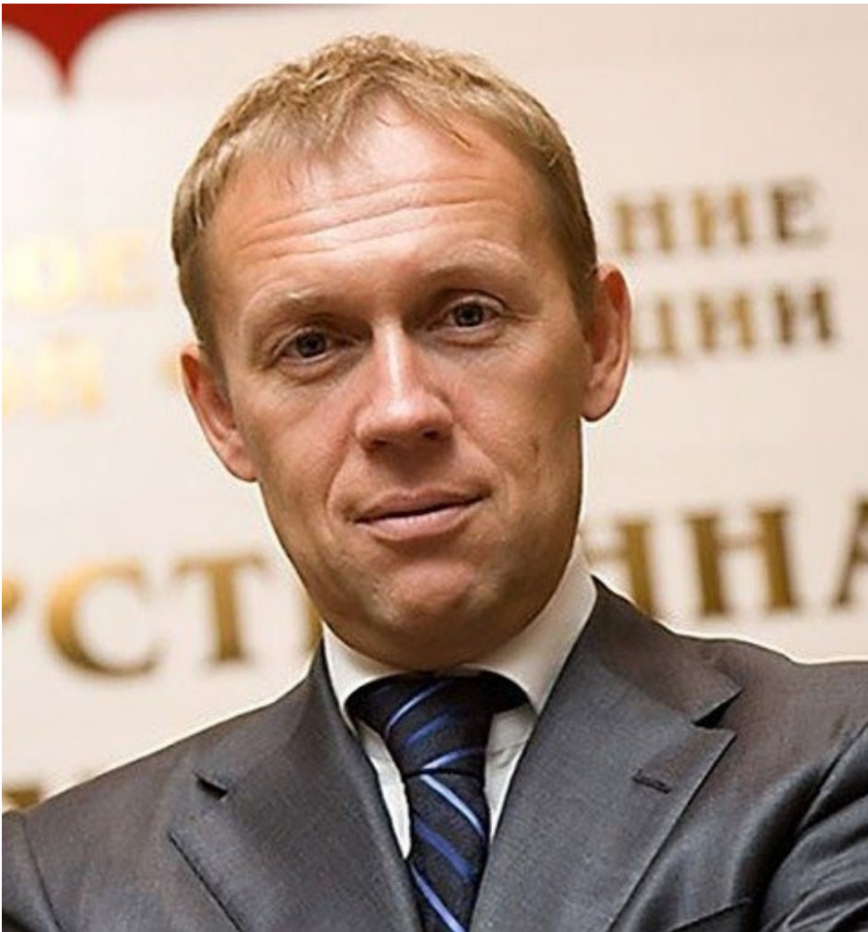
Андрей Луговой.