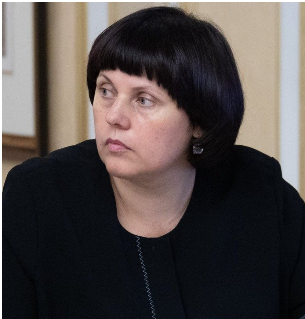
Елена Афанасьева.

Наконец последний, 18-й соавтор закона об «ИА» — сенатор Елена Афанасьева , в прошлом трижды депутат Госдумы.