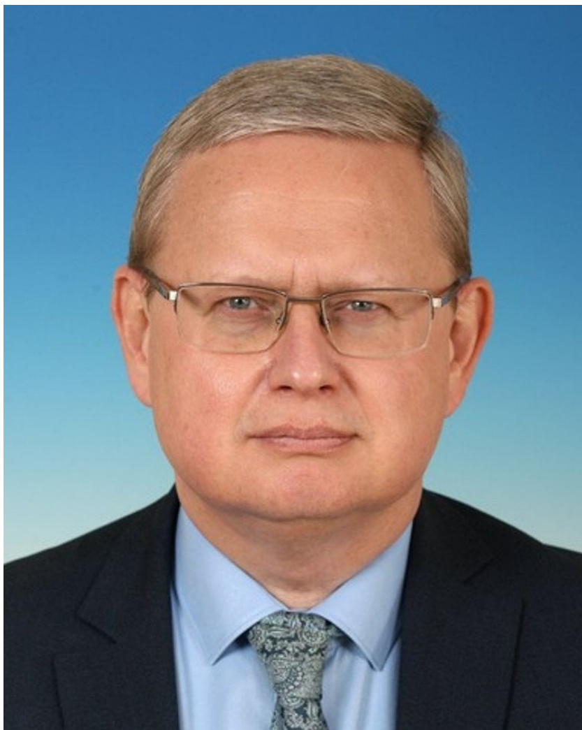
Михаил Делягин.

фигуранты проверяли индивидуальные банковские сейфы, от которых у них были копии ключей, и похищали их содержимое». Предварительная сумма ущерба составила более 2,6 млн долларов. Депутат родство признал, на его политической судьбе этот инцидент не сказался.