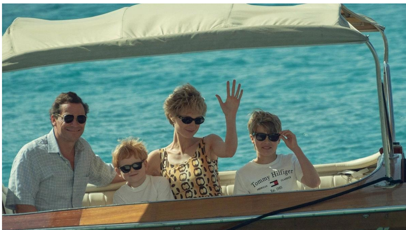
Кадр из сериала «Корона»

Сериал «Корона» о царствовании Елизаветы II завершился. Netflix показал последние серии шестого сезона