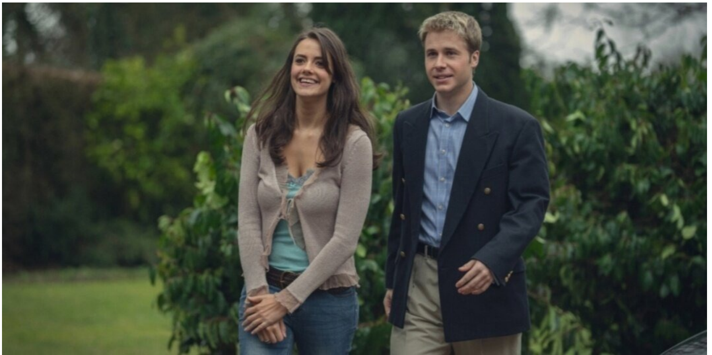
Молодые Виндзоры. Кадр из сериала «Корона»

кивков в сторону современных королевских разборок».