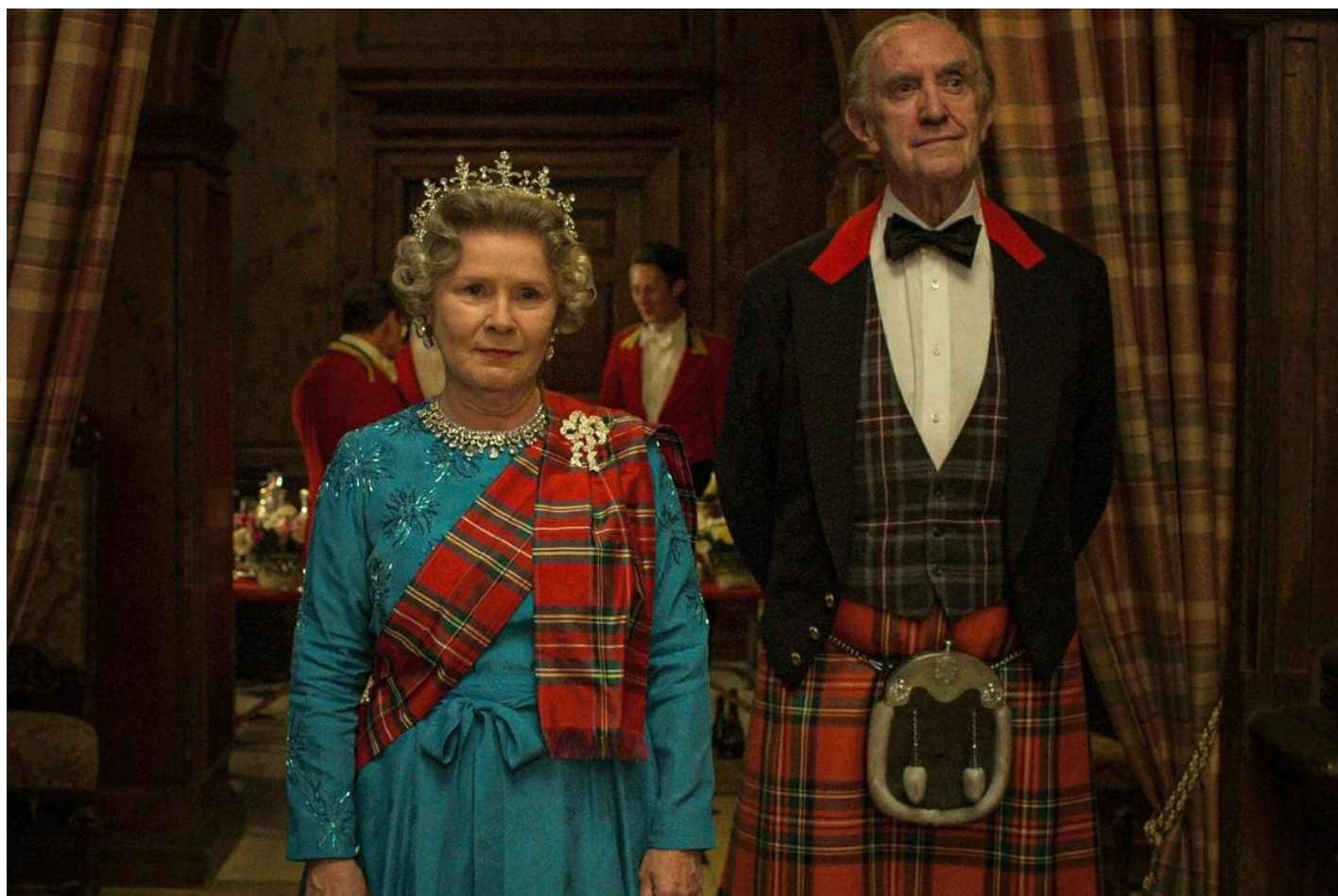
Кадр из сериала «Корона»

События последнего сезона слишком близки зрителю, который был им и свидетелем, и очевидцем (некоторые зрители, как заметил один острослов, «даже норовят смотреть сериал прямо с адвокатами»). Имельда Стаунтон признает, что люди могут быть недовольны тем, как автор и сценарист сериала Питер Морган изображает громкие события: «Мы здесь выдумываем события, которые очень близки нам. Конечно, люди чувствуют, мол, нет, мы знаем, что это было не так, что этого не было!» В интервью Sky News актриса прямо говорит, что Морган делает «драму о семье, в которой было много драм, но также и для развлечения».