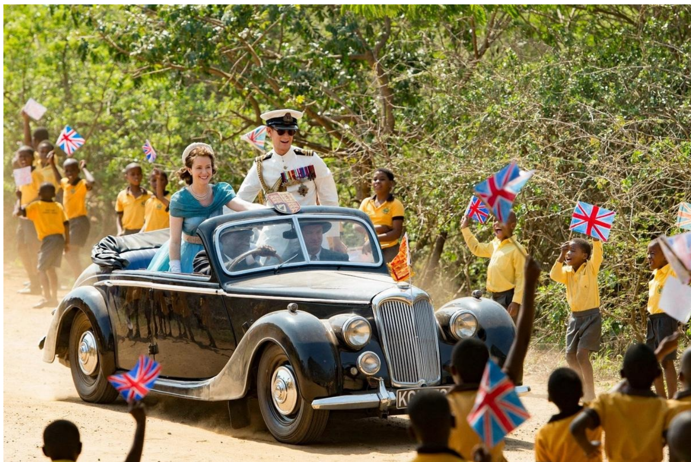
Кадры из первого сезона «Короны»