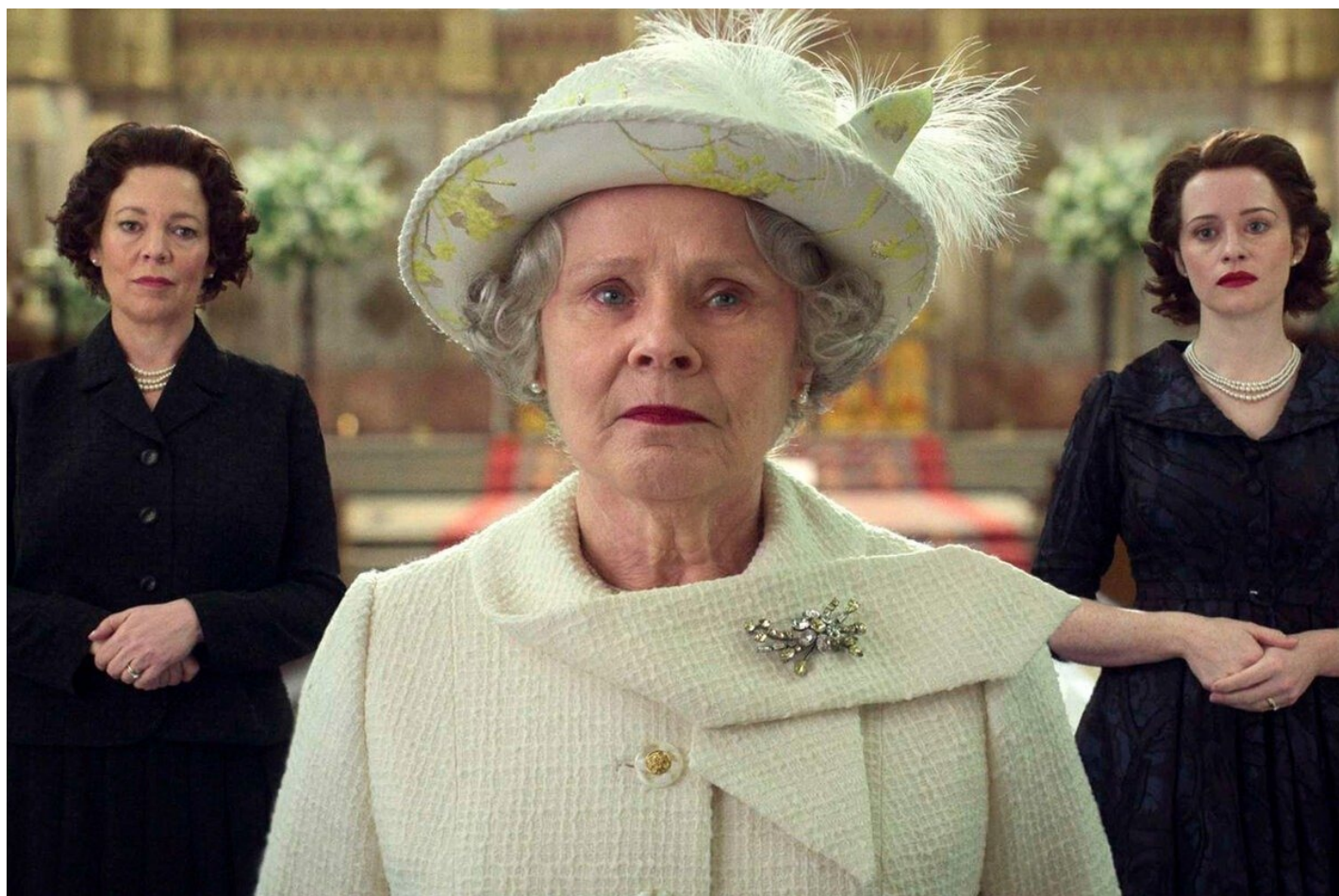
Кадр из сериала «Корона»

ибо в саге появился... призрак! Да-да, настоящий призрак принцессы Дианы в натуральную величину. Та-да! Он тревожит и наставляет королеву Елизавету, покровительствует и примиряется с бывшим мужем... «Какое грубое, мыльное погружение в бездну», — сформулировала The Guardian.