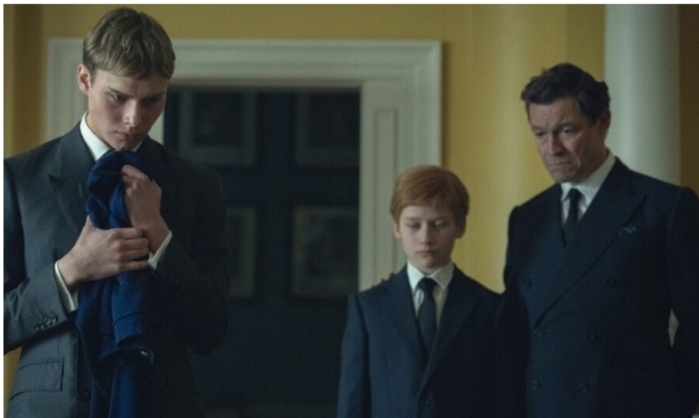
Перед похоронами Дианы. Кадр из сериала «Корона»

Зато благодаря призракам сам собой разрешился долгий спор о достоверности картины и допустимых границах вымысла. И хотя пресса продолжает обсуждать фактические ошибки повествования, от него больше не ждут исторической правды.