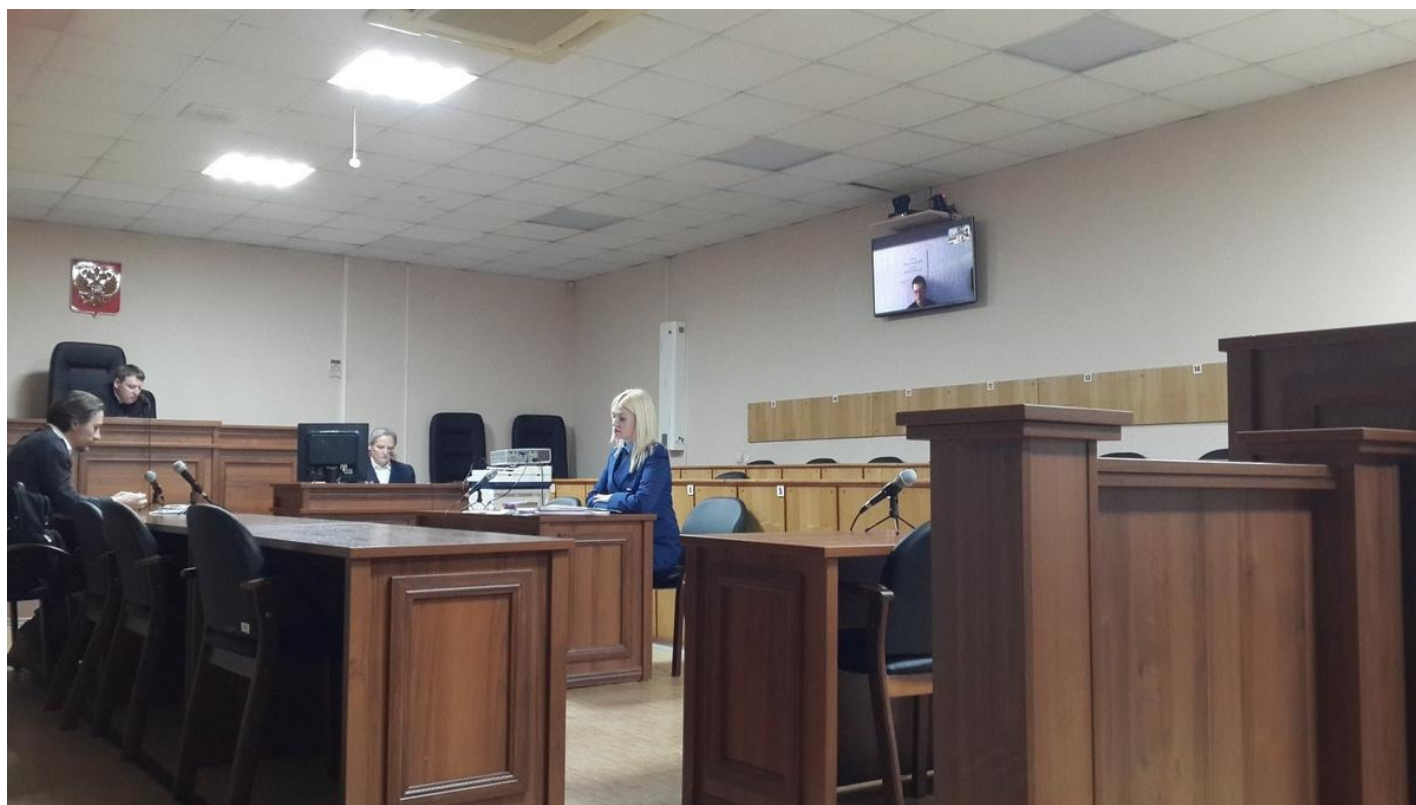
В зале суда.