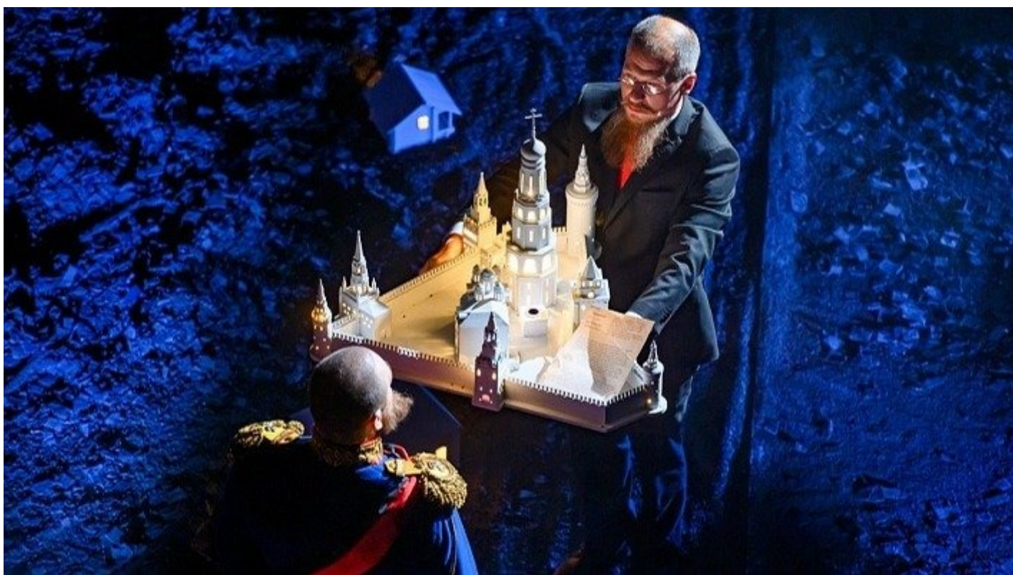
Сцена из спектакля «1881».

«Отмена русской культуры» происходит не на Западе: Александринский театр снял популярный спектакль «1881», потому что — Акунин*