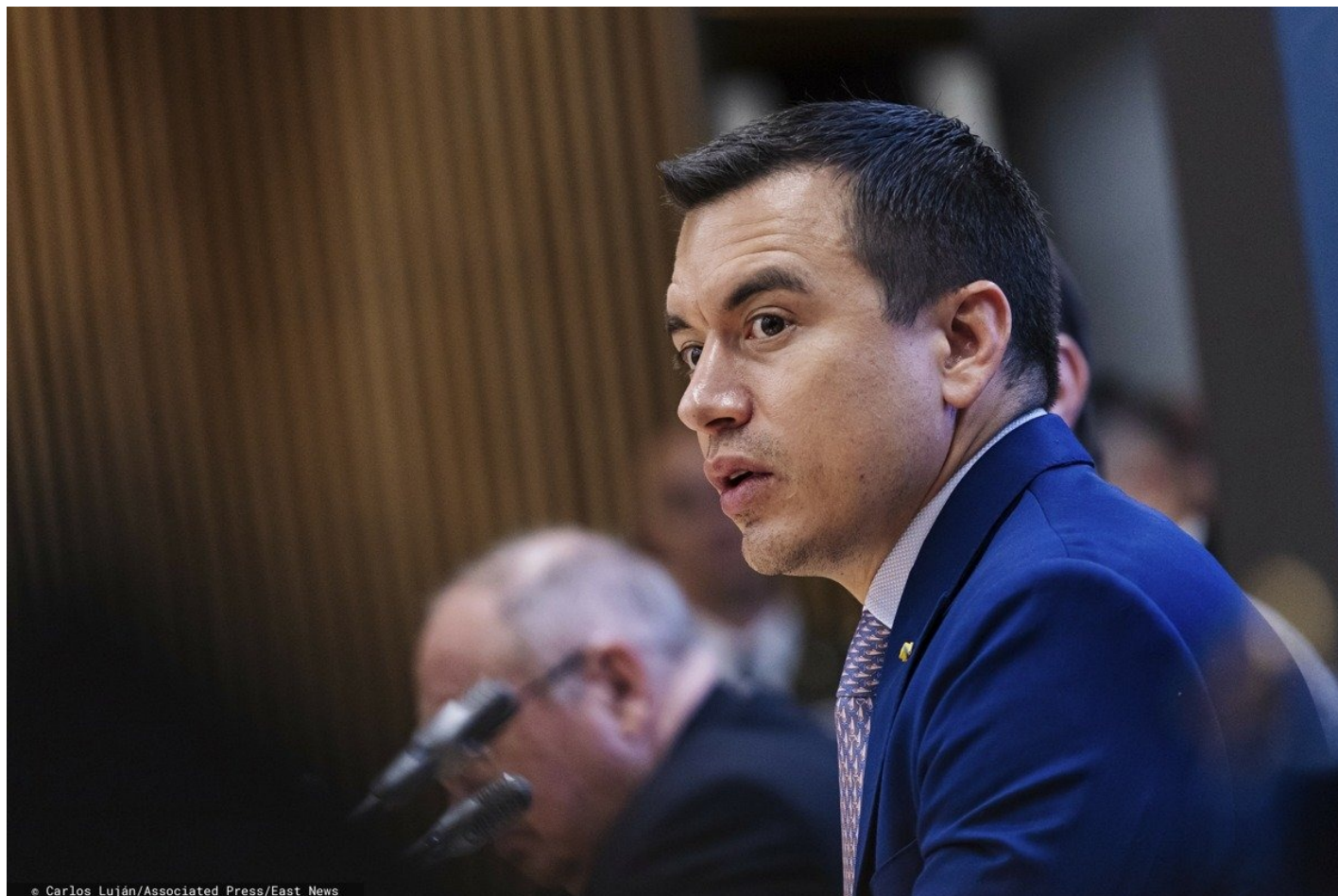
Президент Эквадора Даниэль Нобoa.

Все это стало ответом на активные действия правительства, объявившим войну наркокартелям. В декабре 2023 года на территории Эквадора началась операция «Метастазы», в результате которой были выявлены коррупционные связи между наркобаронами и государственными служащими высокого ранга. Несколько десятков чиновников и судей были арестованы. Президент Даниэль Нобoa приступил к выполнению своих предвыборных обещаний — борьба с организованной преступностью стала приоритетом его политики.