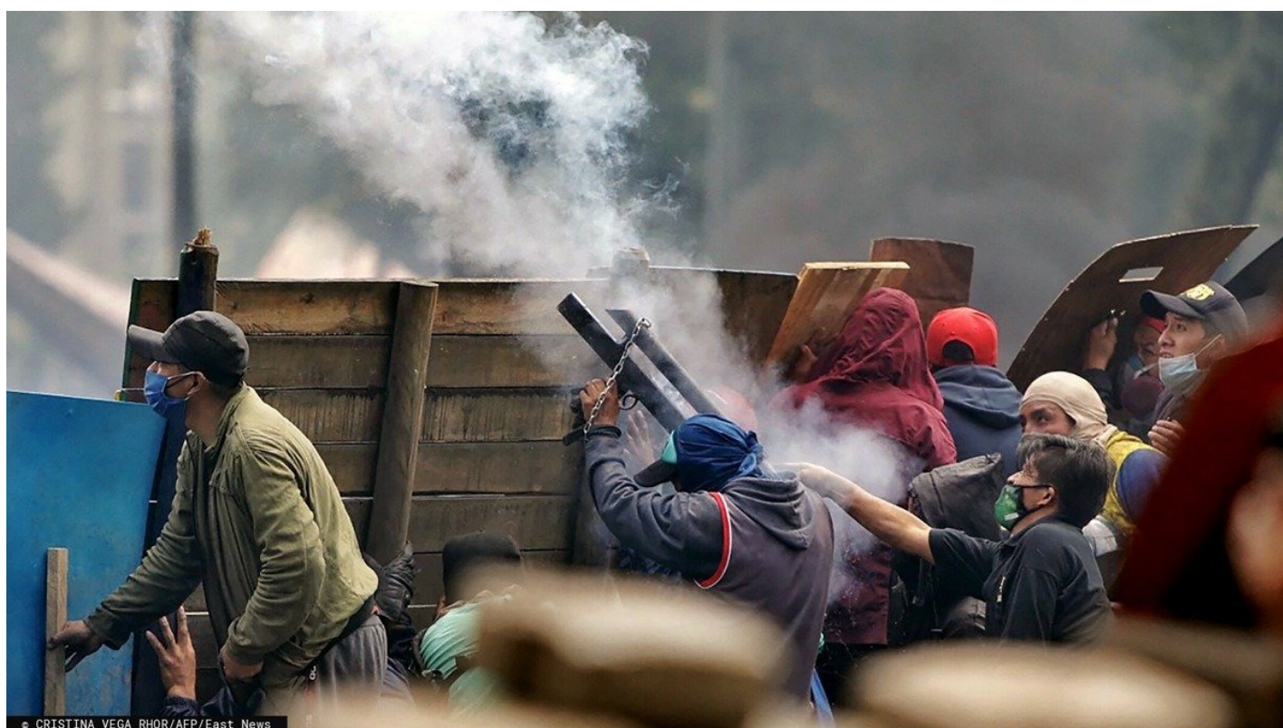
Уличные бои в Эквадоре, город Кито, 24 июня 2022 года.

У картелей не получилось захватить Эквадор, но авторитет любой власти в стране теперь напрямую зависит от борьбы с оргпреступностью