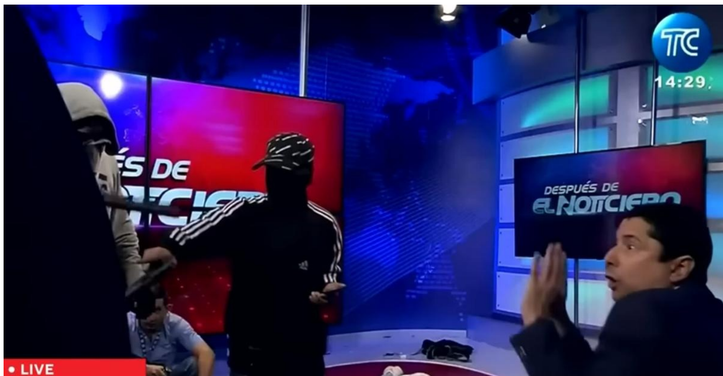
Боевики берут в заложники журналистов в прямом эфире. Кадры трансляции

В Эквадоре ввели чрезвычайное положение, а к столице стянули бронетехнику. Соседние страны выразили свою поддержку и отправили к границе с Эквадором спецподразделения.