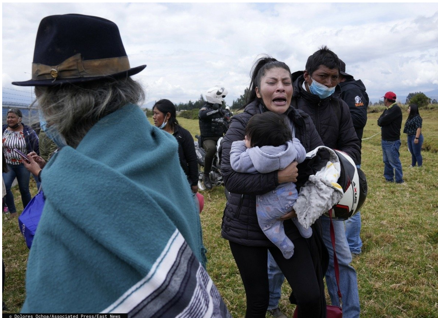
Беспорядки в Латакунге, Эквадор, 4 октября 2022 г.