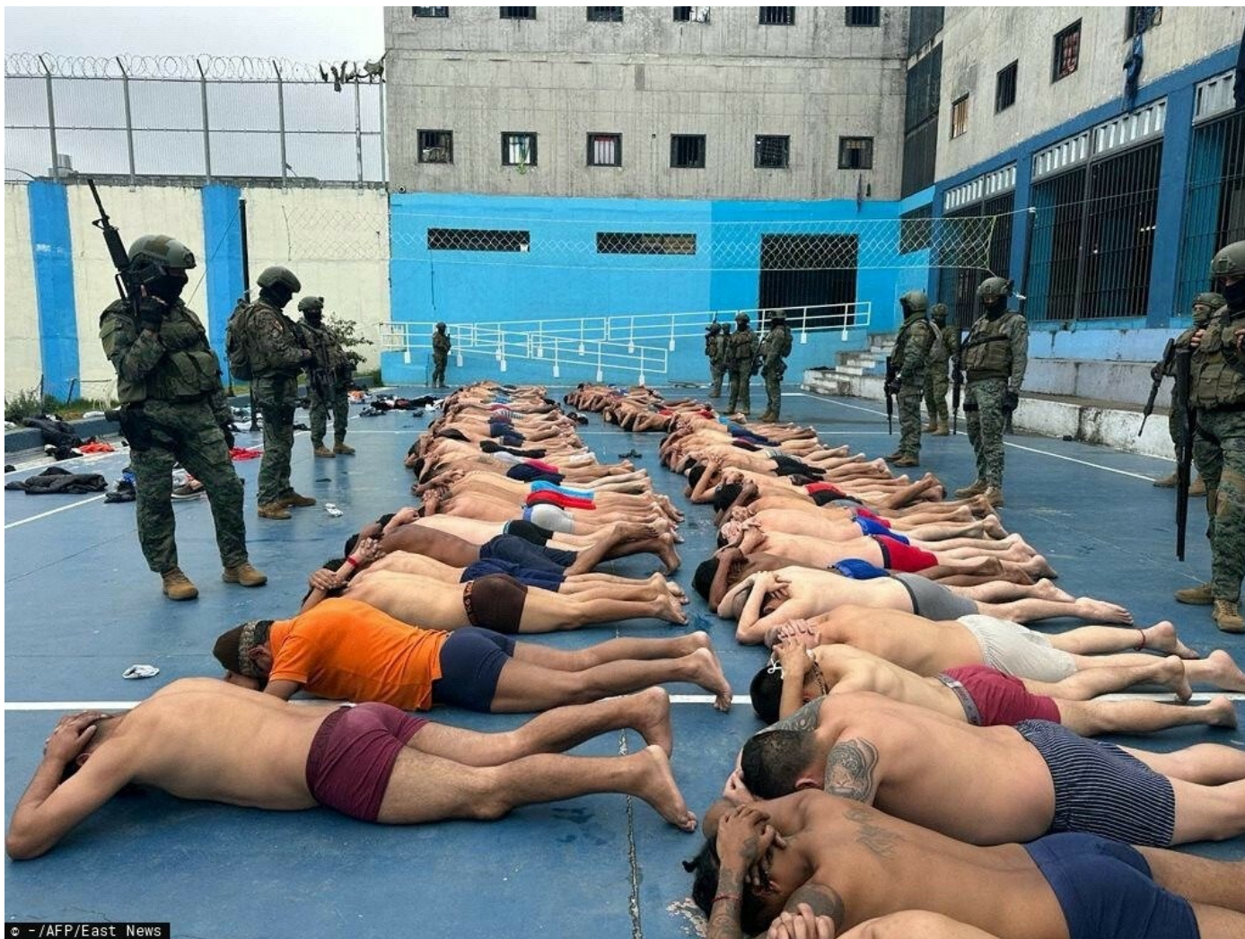
Заключенные в тюрьме Тури в Куэнке, Эквадор, 14 января 2024 года.

Теперь граждане Перу и Колумбии, чтобы попасть в Эквадор, обязаны предоставить справку о несудимости.