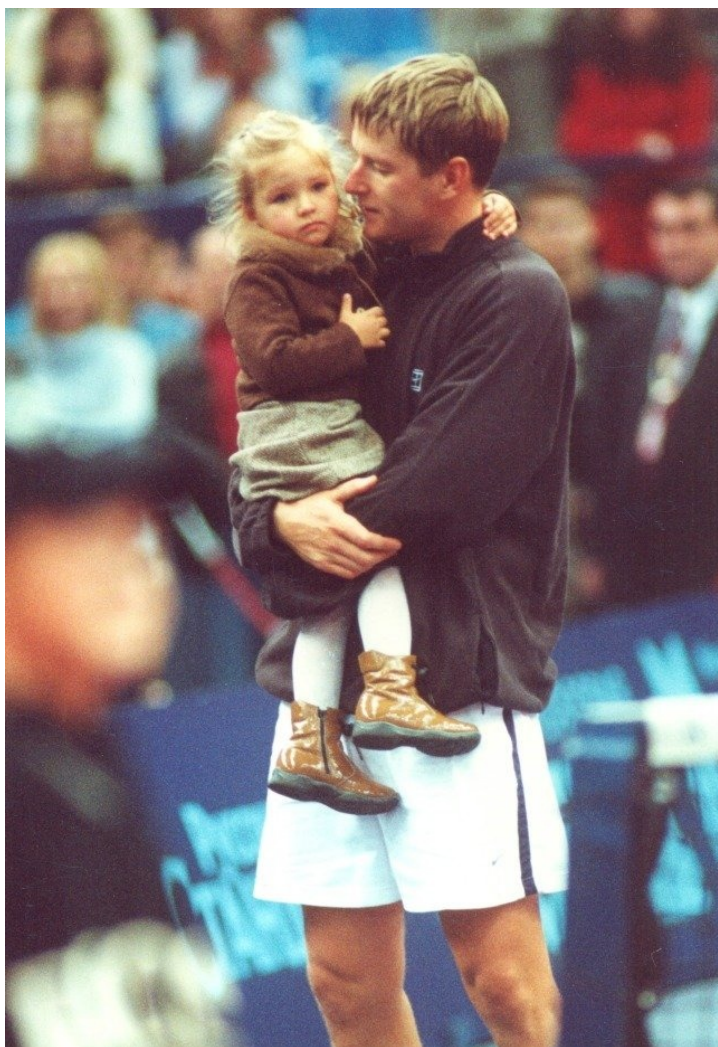
Евгений Кафельников с дочкой Алесей.

триумфатора турнира «Большого шлема», но и повторяет достижение Кена Розуолла, сумевшего сотворить подобный дубль в далеком 1968-м. Кроме того, Евгений оказывается вторым после Ивана Лендла теннисистом, который провел за сезон больше 100 матчей. Год Женя заканчивает в пятерке лучших в одиночном и парном разрядах (в 1989-м таким достижением отметился Джон Макинрой).