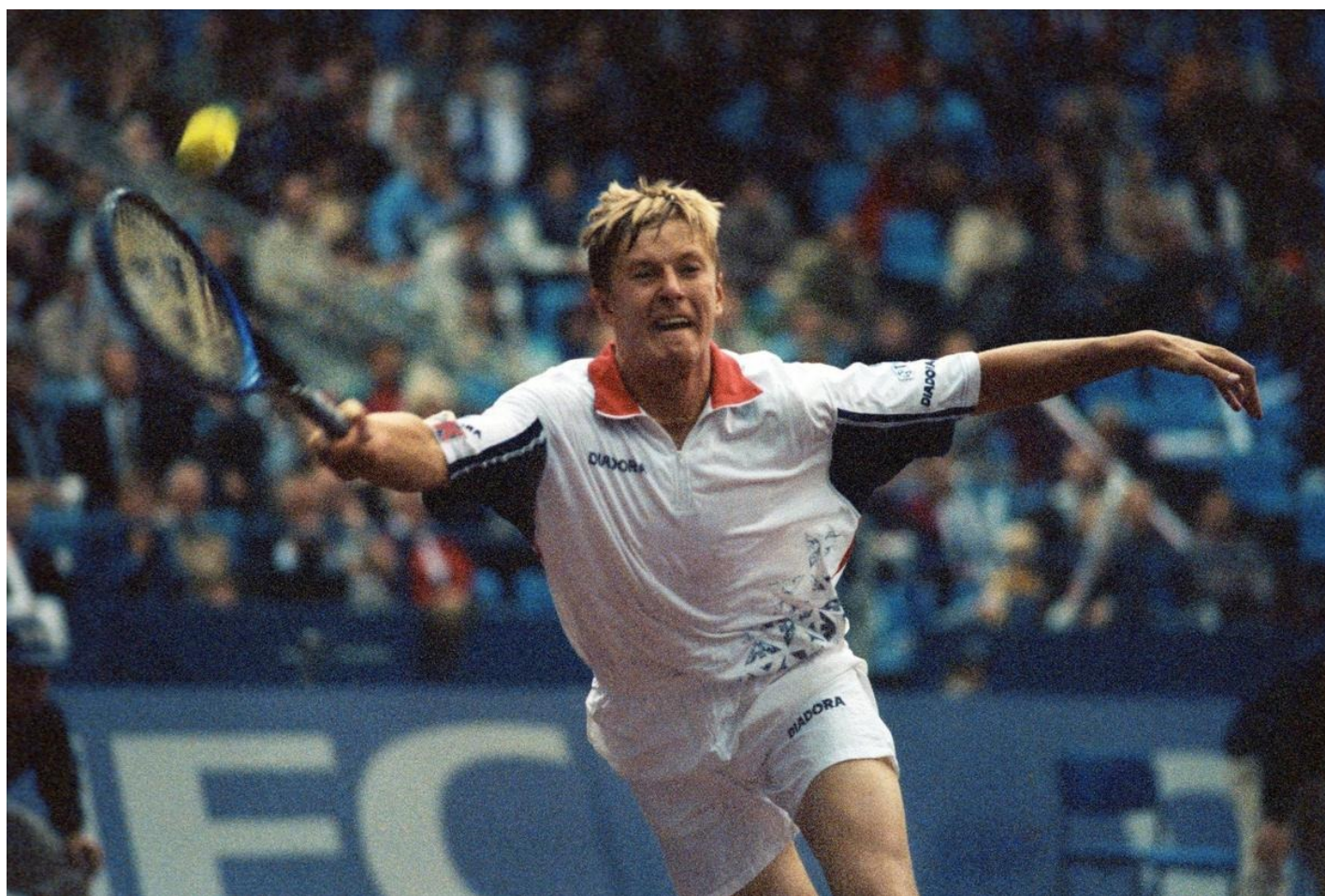
Евгений Кафельников, 1995 год.

Их любили и ненавидели. Провинциальные «мальчиши-плохиши» с разницей в несколько годков прорубили окно в Америку, и не только, и славно гремели на всю планету. Александр Геннадьевич почти всю жизнь «щелкал» против советской системы и власти. Евгений Александрович был настроен более патриотично и на Кубке Кремля и в Кубке Дэвиса частенько подавал навывлет, к радости Бориса Ельцина. Но каждый из юбиляров сделал себя сам.