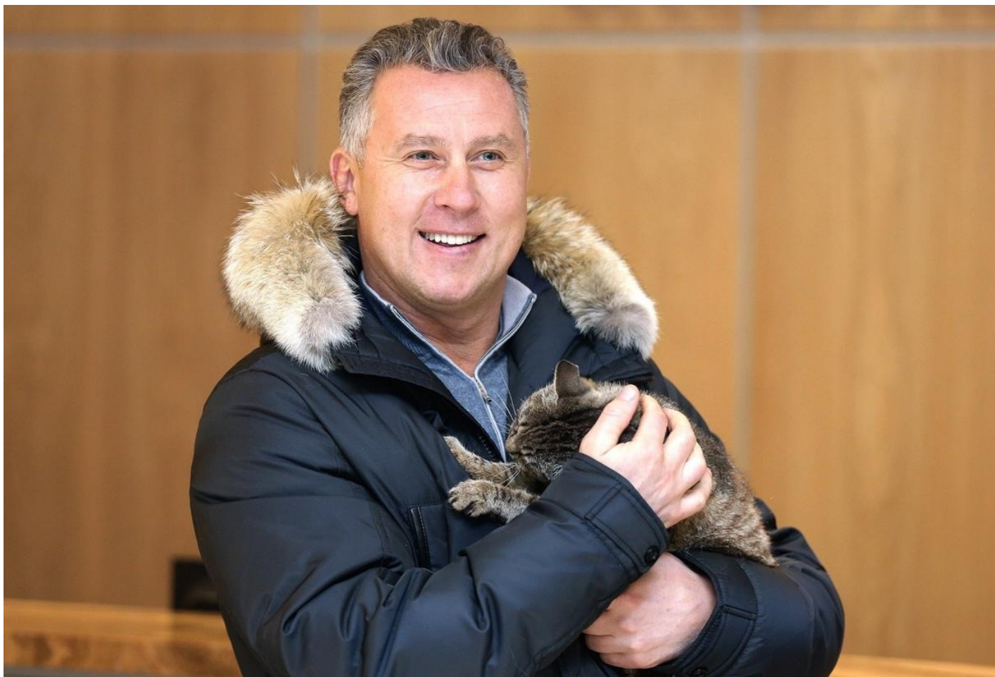
Александр Могильный уже в качестве президента хоккейного клуба «Адмирал».

Сегодня Александр Геннадьевич — почетный президент хабаровского «Амура» и член правления Ночной хоккейной лиги.