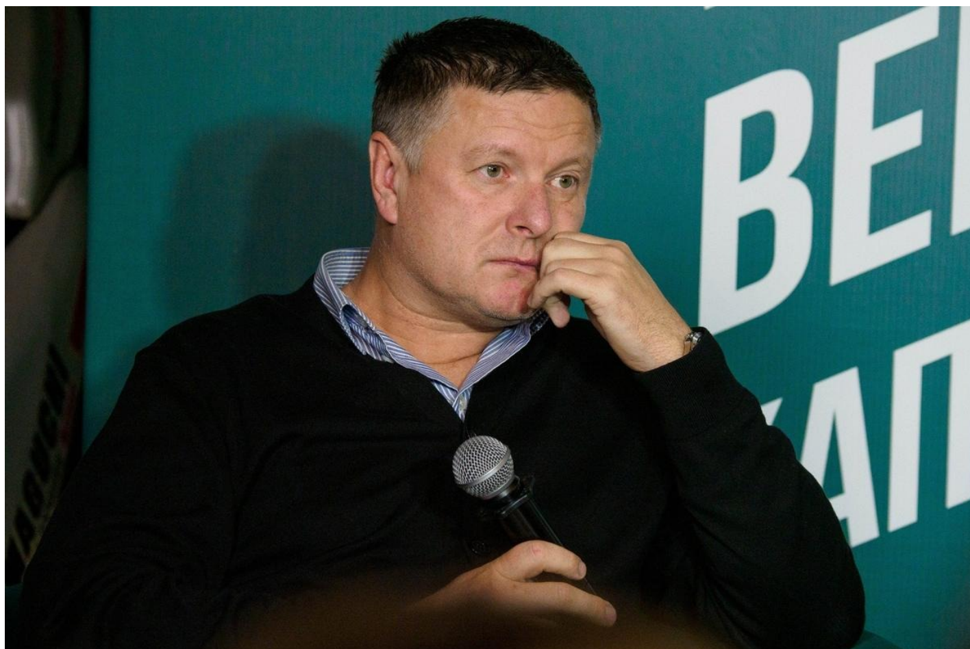
Вице-президент федерации тенниса России Евгений Кафельников в 2023 году.

Попробовал швед Томас Энквист в финале Australian Open — не вышло (Евгений шедеврально управился с ним за 4 сета). Болеть за Кафеля, возглавлявшего полтора месяца (с 3 мая по 13 июня 1999-го) список крутейших теннисистов планеты, было модно. Как за «Спартак». Однако поклонники и особенно журналисты после поражений обвиняли взбалмошного виртуоза во всех смертных грехах, упрекали в «жажде наживы» и разбирали его миллионные «зеленые» доходы: мол, и «Феррари» он красные покупает, и самолет у него личный, и фешенебельных квартир у него навалом. Разумеется, особняки и «Роллс-Ройс» хоккейного «дезертира и диссидента» обсуждали не меньше. «Мне хотелось бы жить в галактике, где нет корреспондентов», — вырвалось как-то у Кафельникова. Недоброжелателям и критикам он ответил в Сиднее, завоевав золотую олимпийскую медаль.