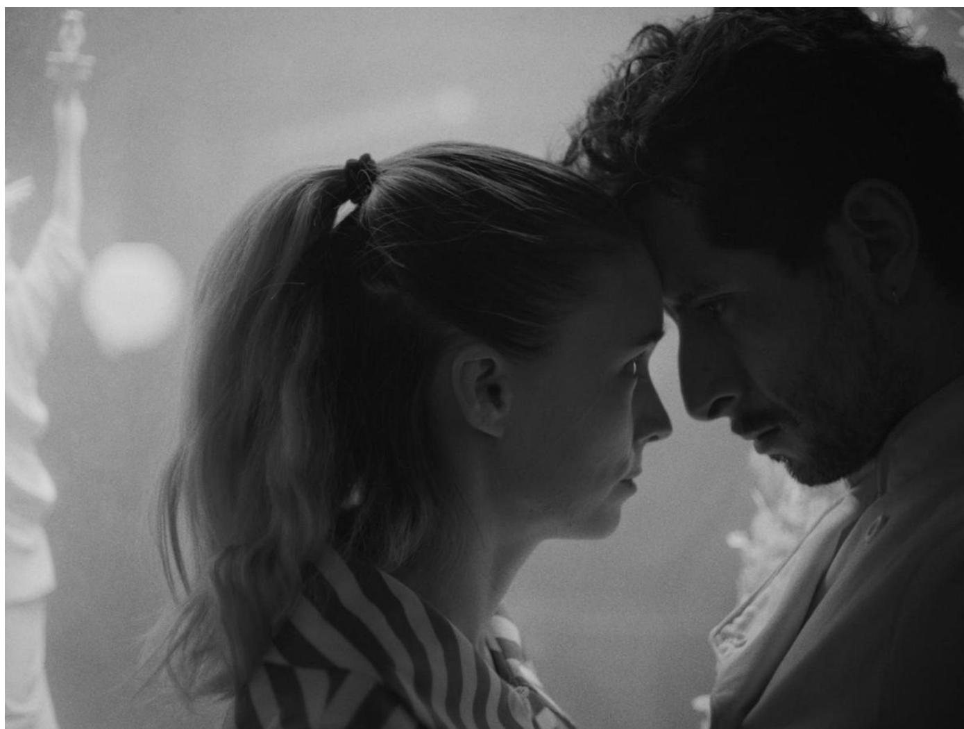
Кадр из фильма «Кухня»