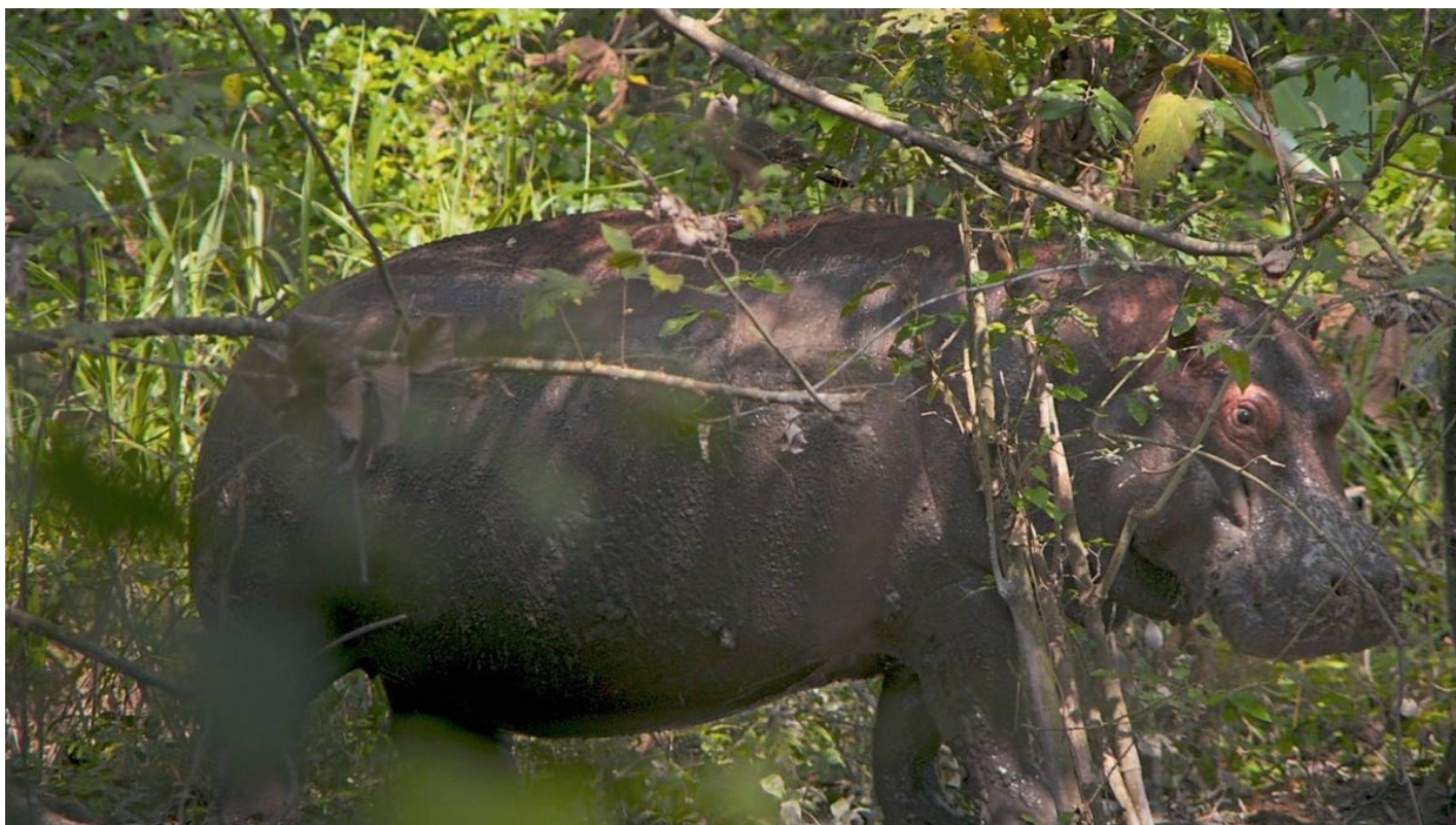
Кадр из фильма «Пепе»

Нынешний берлинский конкурс удивляет разбросом жанров: от отвязной пародии на звездные войны Брюно Дюмона «Империя», снятой им на любимом живописном Кот-д'Опале, северном побережье Франции, — до документальной дискуссии «Дагомеи» франко-сенегальского режиссера Мати Диоп о возвращении французскими музеями Бенину некогда вывезенных произведений искусства королевства Дагомея.