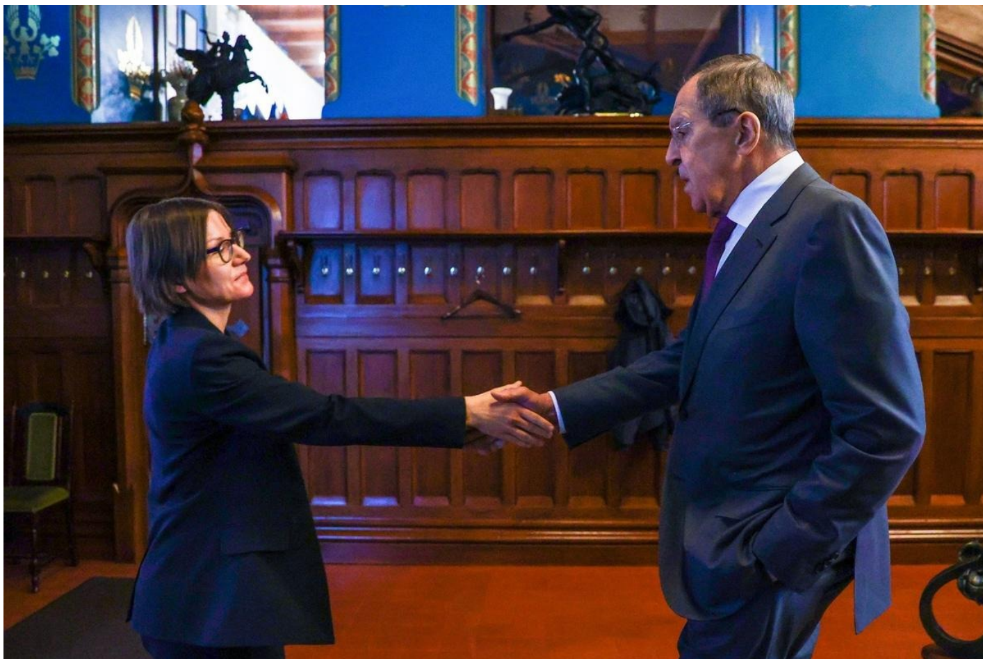
Встреча главы МИД РФ Лаврова с президентом Международного комитета Красного Креста Сполярнич.

Тогда мы выяснили: во время нашего разговора госпожа Сполярнич находилась не в Сирии. А в кабинете министра иностранных дел Лаврова в Москве, на Смоленской площади.