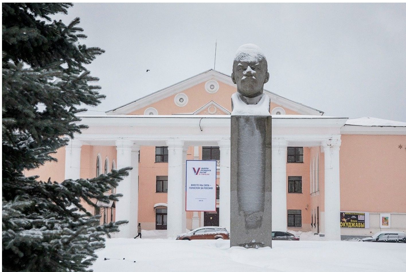
Дворец культуры на центральной городской площади.

Но Пикалево выделяется даже на этом фоне. Ни один другой город в Ленобласти не чувствует такой связи с Путиным, как этот, — сюда он прилетал лично. Пусть и 15 лет назад, но именно в тот момент, когда город был на грани выживания. Википедия в истории Пикалево описывает единственную тяжелую страницу: не Великую Отечественную войну (города тогда еще не существовало, он образован в 1954 году), а социально-экономический кризис 2008–2009 годов. О том, что на карте России есть этот маленький моногород, страна узнала лишь в конце 2008 года, когда здесь на шесть месяцев остановились три завода (глиноземный, цементный, химический), работающие в единой производственной цепочке, а люди остались без работы и без денег.