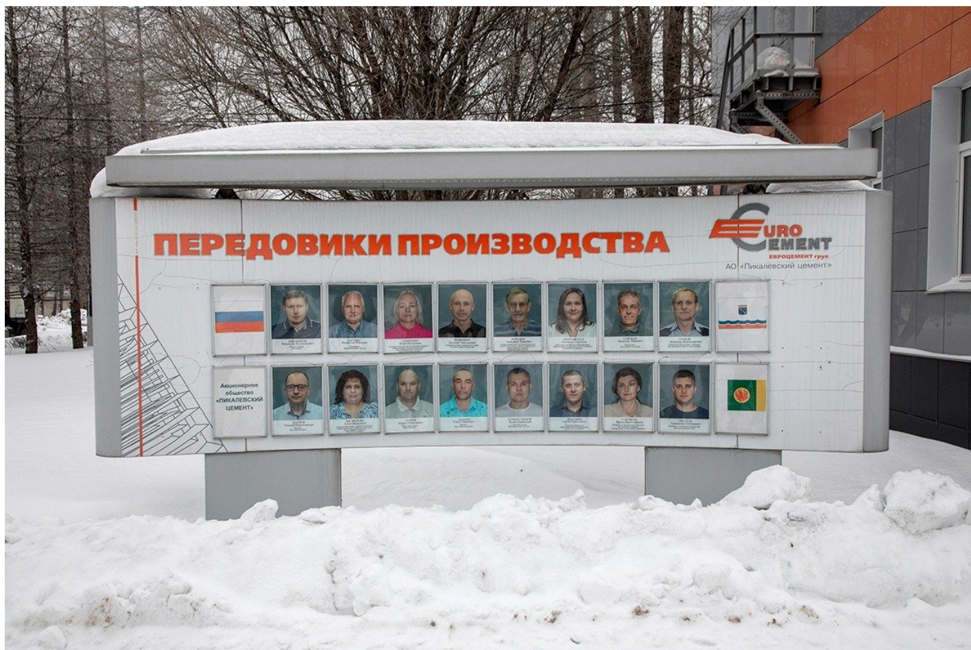
Доска почета Пикалевского цементного завода.

По рассказам рабочих ПГЗ, сегодня самая маленькая зарплата на предприятии — 60–70 тысяч рублей, самая большая — 120–130 тысяч (для сравнения: в 2009 году эти же работники получали от 15 до 30 тысяч в месяц). Сумма складывается из тарифного оклада в зависимости от числа отработанных дней, учитываются разряд и стаж, добавляются переработки, «кормовые», премия. Последние 10 лет тарифы постоянно индексируются.