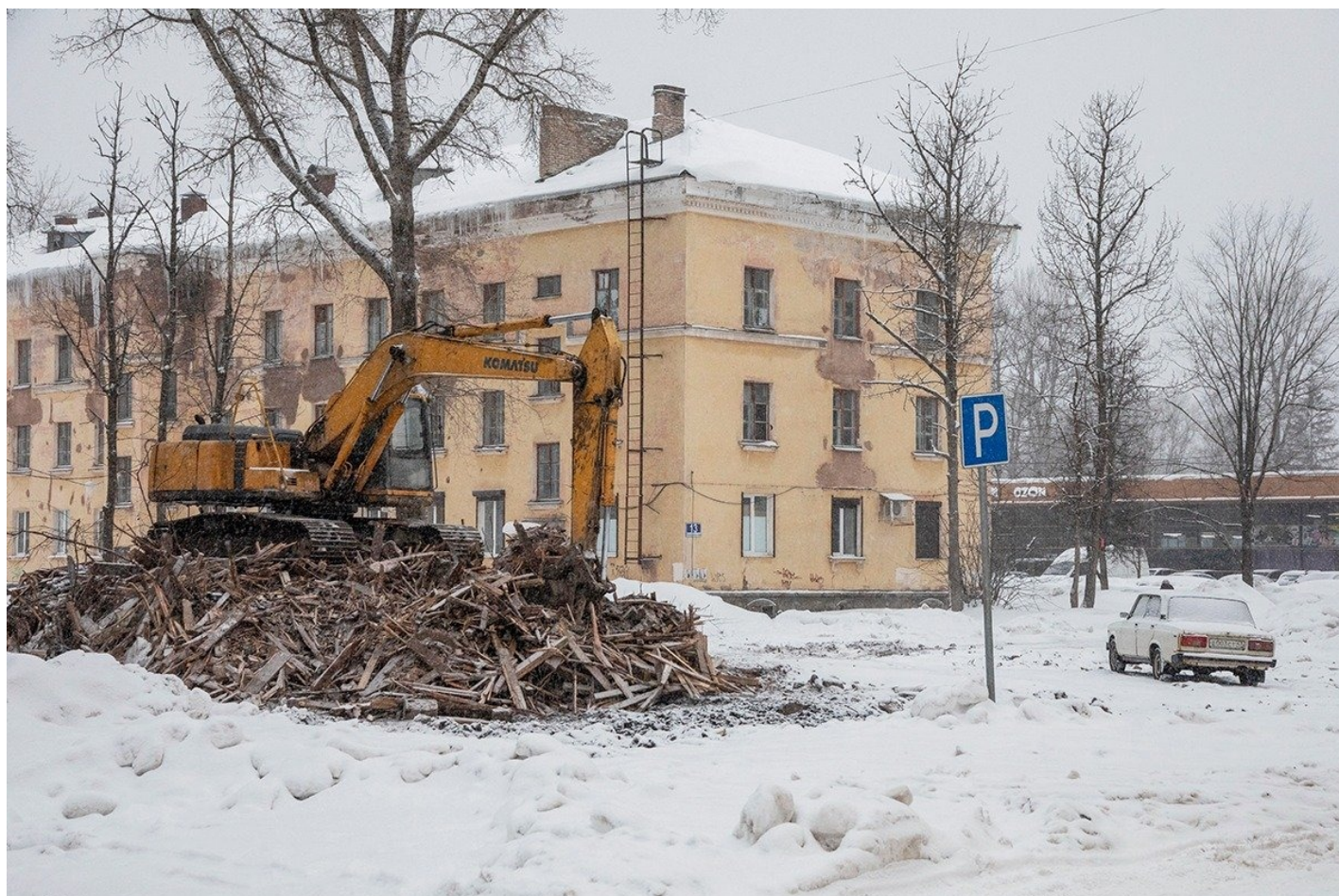
Пикалевский бизнес-инкубатор на Заводской улице.

К концу 2009 года областные чиновники задумались: если невозможно всех пикалевцев трудоустроить, то может, хотя бы попробовать подтолкнуть их к собственному делу?