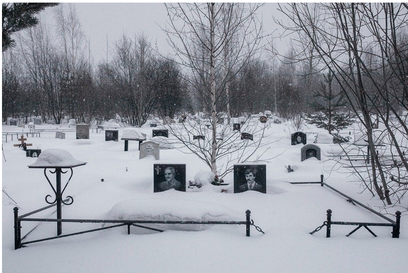
Пикалевское кладбище.