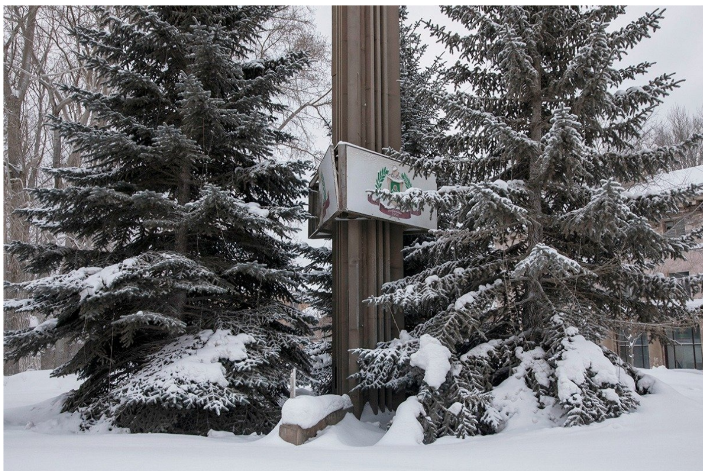
Герб Пикалево, на выезде из города.