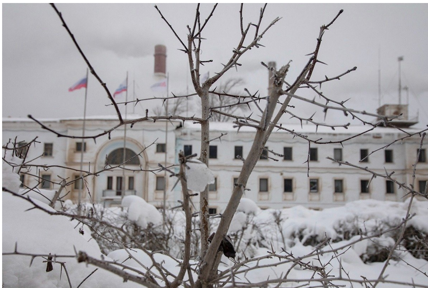
Пикалевский глиноземный завод.