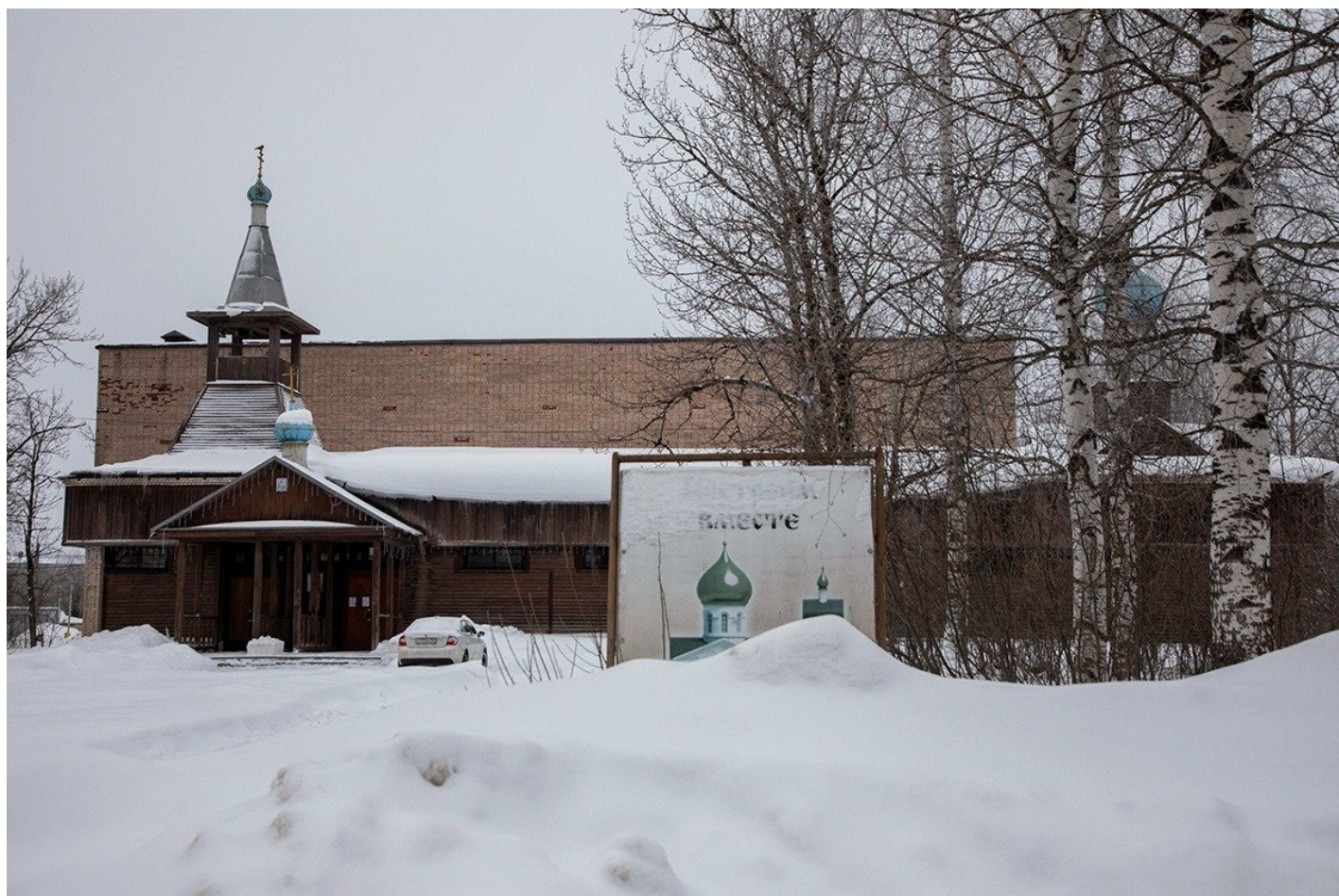
Церковь в центре Пикалево (здание бывшего кинотеатра).

Фотографироваться отец Александр отказывается, благословения на съемку в церкви не дает и вообще отправляет нас в храм на окраине: там и настоятель чином постарше, и кладбище рядом, на котором недавно похоронили двух бойцов из Пикалево, погибших в ходе спецоперации.