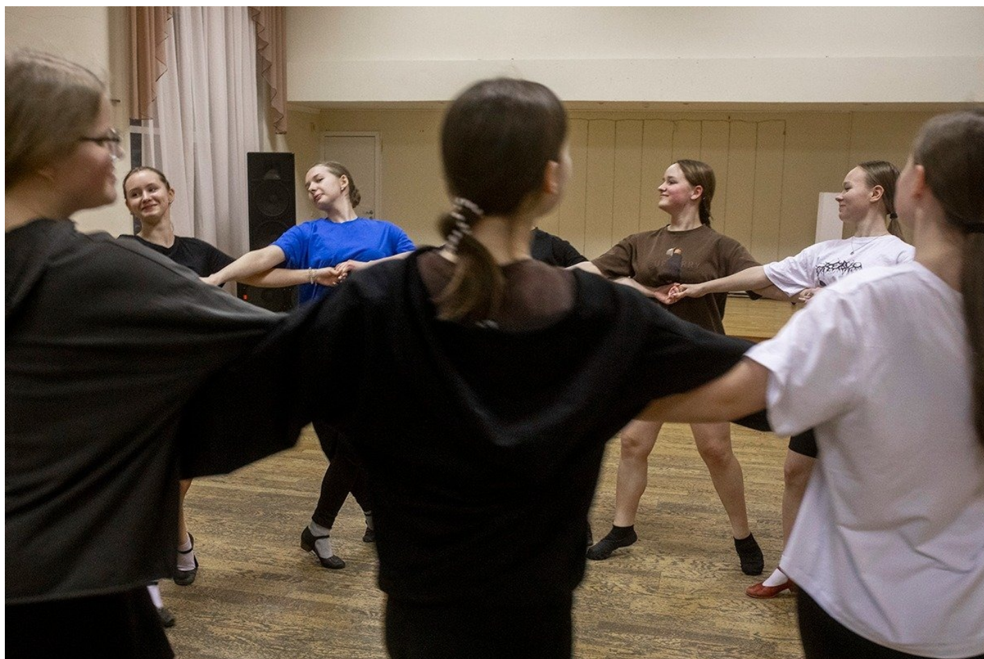
Танцевальная студия.

Екатерина, сотрудница Пикалевского глиноземного завода, сегодня вечером пожертвовала концертом, хотя они случаются в Пикалево не так часто — два-три раза в месяц, и песни Окуджавы ей нравятся. Но сейчас у нее есть дело поважнее, чем все развлечения, чем отдых, чем даже дети дома.