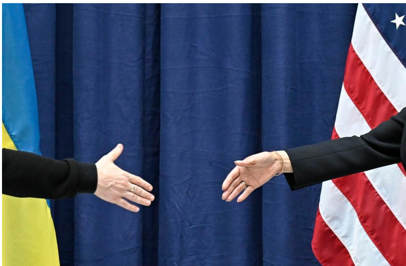
60-я Мюнхенская конференция по безопасности.

На состоявшейся в последний уикенд юбилейной, 60-й, Мюнхенской конференции по безопасности собралось более 90 министров из 40 стран. Проводится она с 1963 года и давно стала рутиной: материалы 30–40-летней давности отражают настроения периода сокращения вооружений и армий в Европе (но не в США). После начала СВО все подобные западные форумы испытывают ренессанс. Но ни об одной конференции раньше мировая пресса не писала так часто и много.