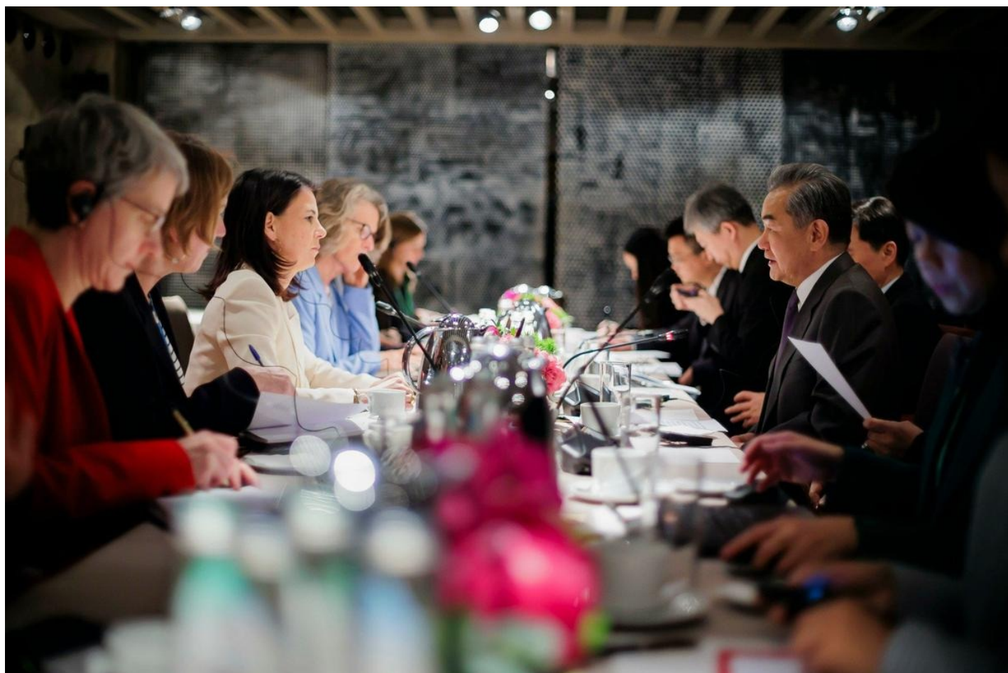
Министр иностранных дел Германии Анналена Бербок, министр иностранных дел Китая Ван И (справа) во время встречи на 60-й Мюнхенской конференции по безопасности.

инфраструктура). Проект обеспечит сверхбезопасную связь между критически важными инфраструктурами (в первую очередь — военными и финансовыми) и государственными учреждениями на территории Европейского союза и по всему миру.