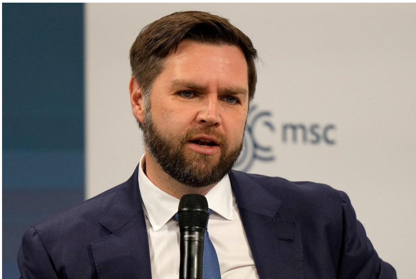
Сенатор США Джеймс Вэнс на 60-й Мюнхенской конференции по безопасности.

И вот один за другим почти все лидеры Европы заговорили о создании некоего собственного Пентагона. Пошли упоминания о ядерных силах Франции и Великобритании как о возможной основе будущих европейских сил сдерживания (генсек НАТО Столтенберг немедленно отверг эту идею — она и правда не выдерживает критики в сегодняшней ситуации). Глава МИД ФРГ Анналена Бербок выразила общее мнение так: «Нам, наконец, нужен союз безопасности и обороны, который укрепит европейскую опору в НАТО — в соответствии с нашими экономическими размерами и независимо от того, кто находится у власти в США».