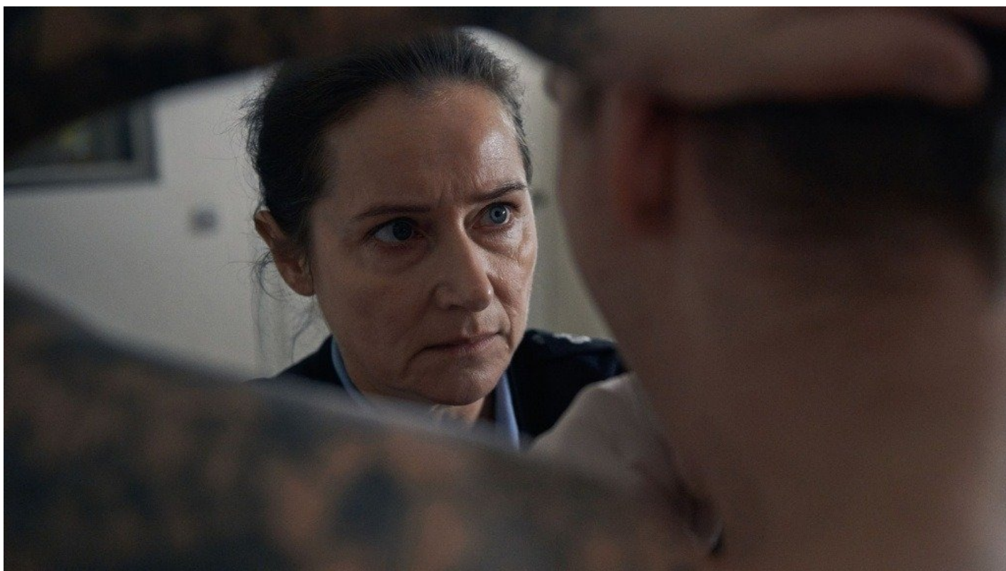
Кадр из фильма «Сыновья»

Берлинале исследует ад матерей. О хорроре «Дьявольская баня», где женщине не дают родить, и драме «Сыновья», где надзиратель переводится в тюрьму к убийце сына