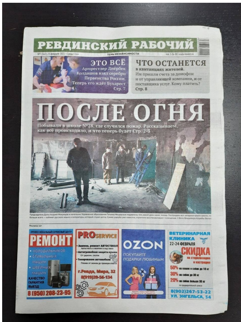
Первая полоса уральской газеты «Ревдинский рабочий»

Она посвящена отражению в отечественной живописи исторических событий начала XX века.