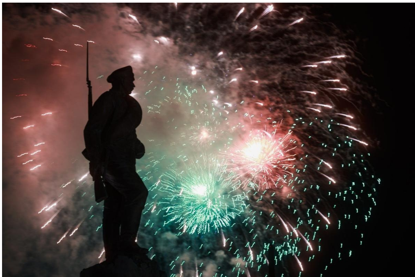
Москва. 23 февраля, 2022 года. Салют в честь празднования Дня защитника Отечества.