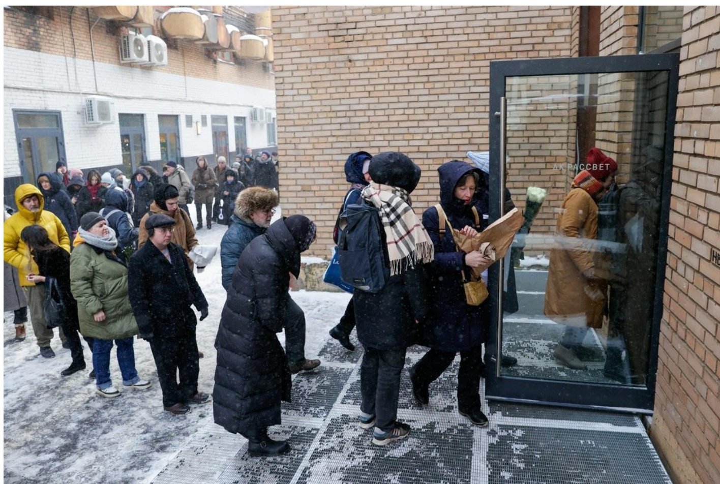
Прощание с поэтом Львом Рубинштейном в ДК «Рассвет».

Прощание с ним пройдет в московском ДК «Рассвет» и будет транслироваться в Zoom — многие из его друзей и поклонников к тому времени будут вынуждены покинуть страну и не смогут вернуться по соображениям безопасности.