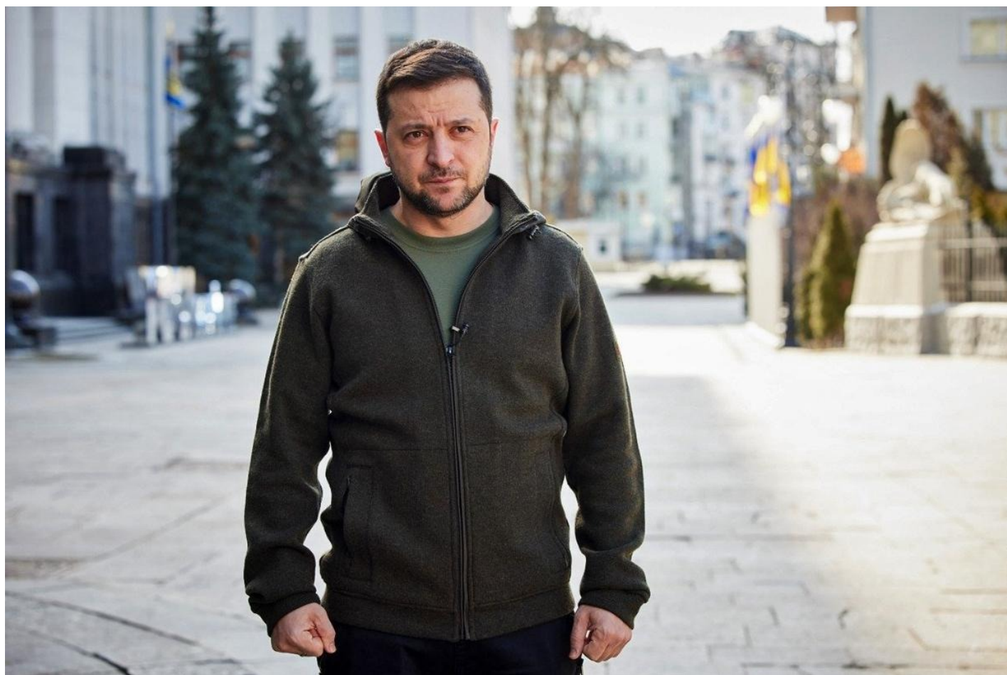
Президент Украины Владимир Зеленский.

Президент Зеленский заявил, что в Украине нет необходимости проводить всеобщую мобилизацию.