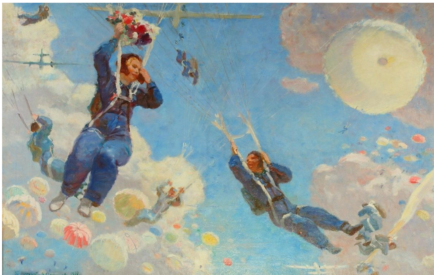
Выставка «Незабываемое время».