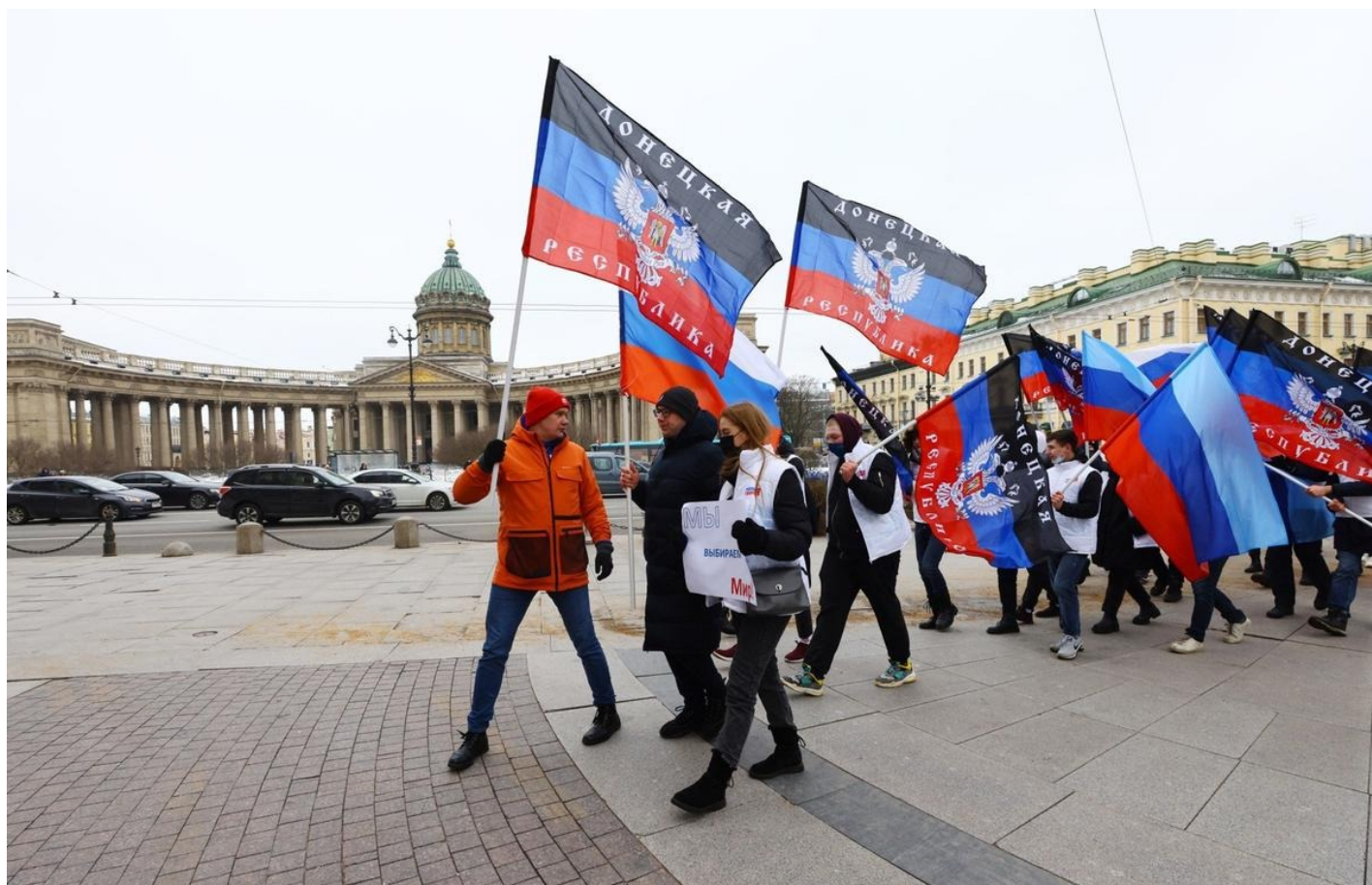
Акция в поддержку признания независимости ДНР и ЛНР в Санкт-Петербурге.

В Третьяковке — Врубель, билетов не достать. На здании корпуса на Крымском Валу огромный баннер с изображением «Демона сидящего».