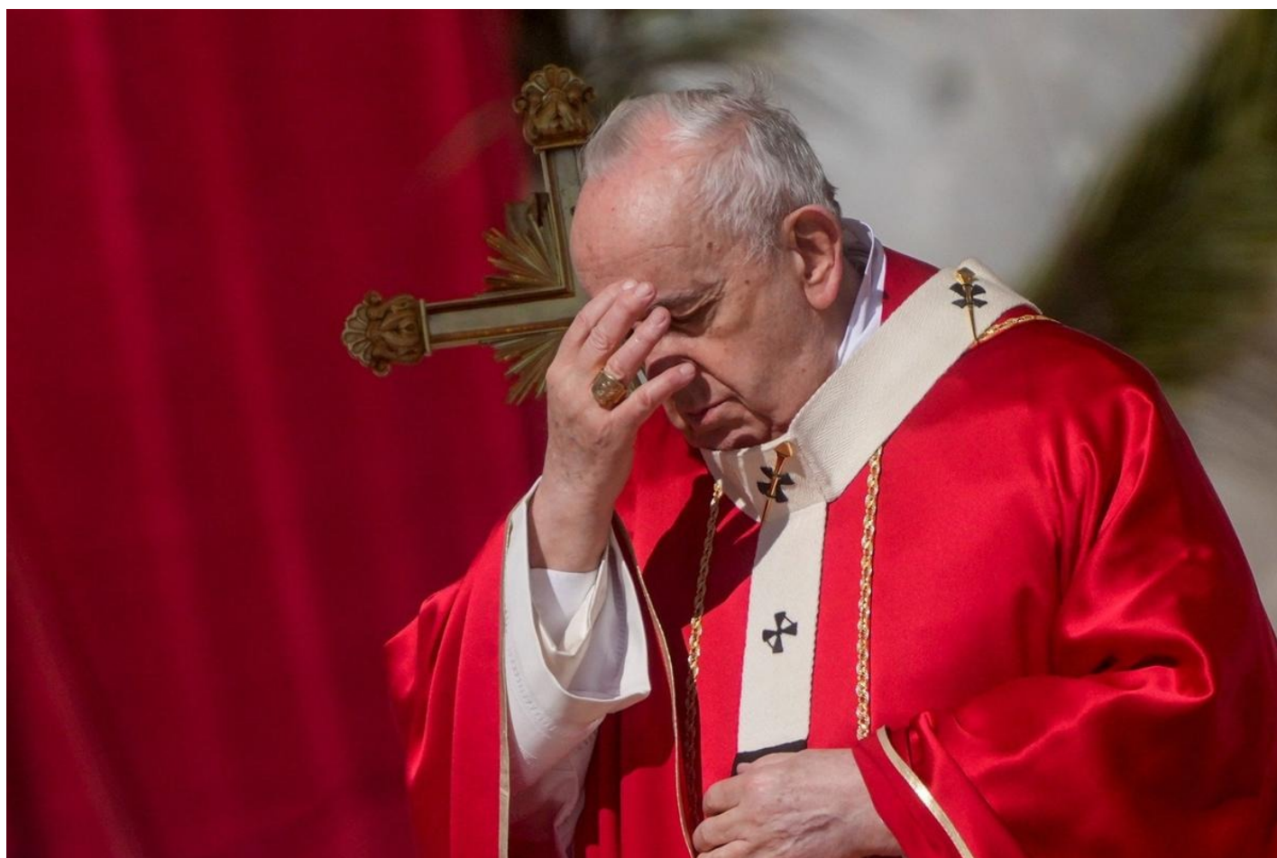
Папа Римский Франциск.

МИД Украины рекомендовал украинцам выехать из России.