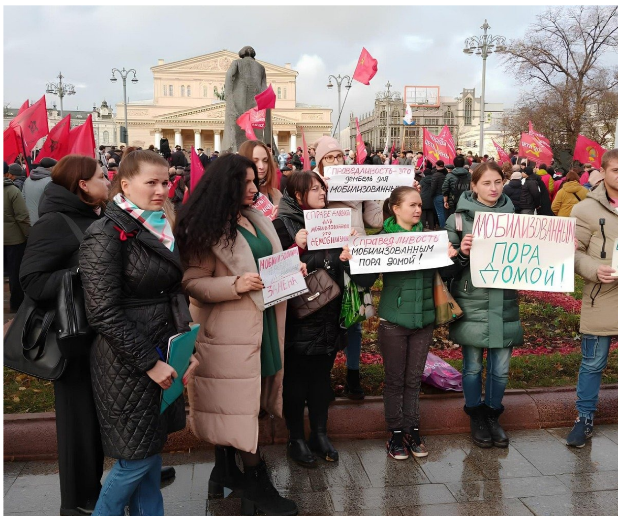
Протест жен и матерей мобилизованных.