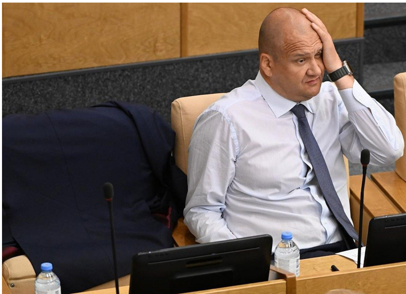
Депутат Госдумы от «Единой России» Олег Гарин.