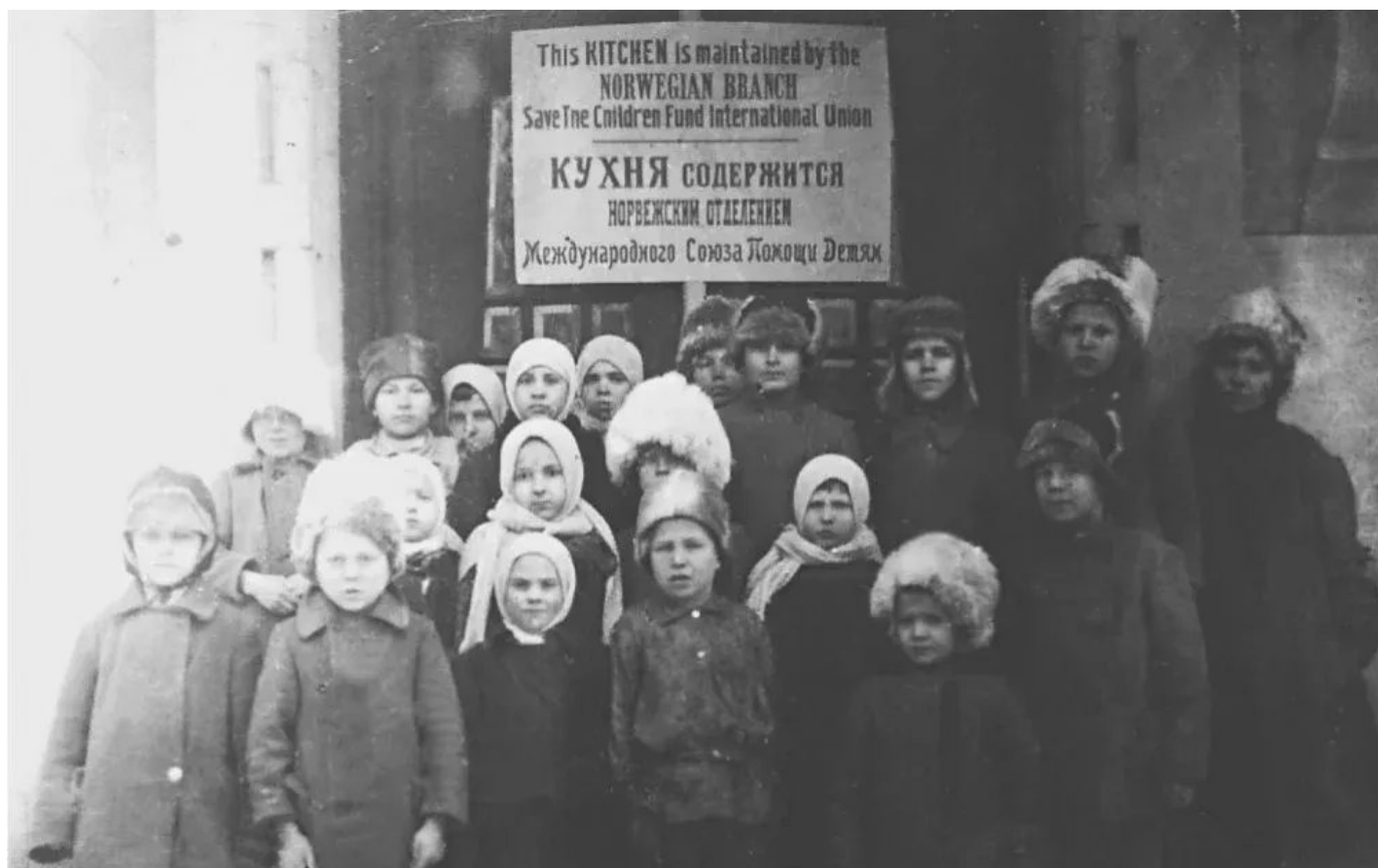
Кухня норвежского отделения МСПД, Саратовская губерния, 1922 г.

За все время работы, с осени 1921 до лета 1923 года, благодаря работе миссии в РСФСР ввезли около 80 тысяч тонн продовольственных, вещевых и медицинских грузов. В августе 1922 года Нансеновская миссия кормила 1,5 миллиона человек (12,3% всех голодающих).