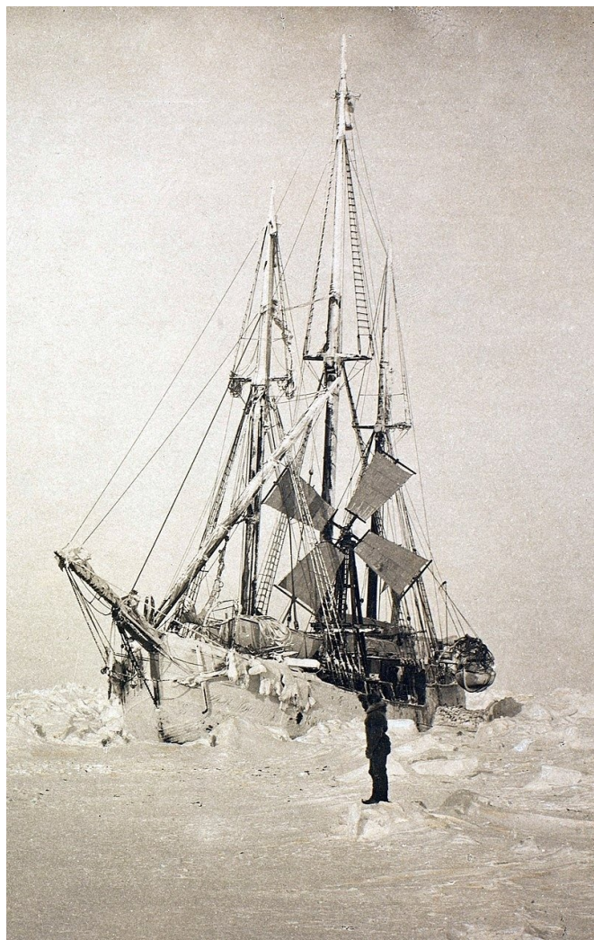
«Фрам» в марте 1894 года.

И хотя до конечной точки они не смогли добраться, экспедиция превратила Нансена в национального героя, а его опыт оказался бесценным для будущих полярных исследователей. По следам путешествий он написал несколько книг, которые прославили его по всей Европе и Америке.