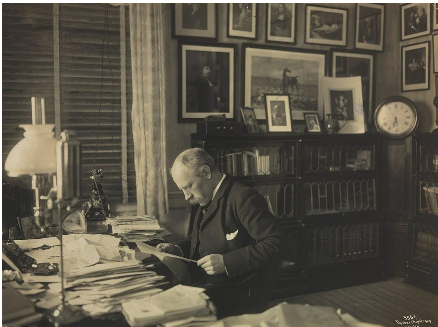
Нансен в своём кабинете в «Пульхёгде», 1909 год.

После окончания дипломатической службы, Нансен возвращается к научной работе — он становится профессором океанографии в университете Кристиании. Эта должность, кстати, была учреждена специально для него.