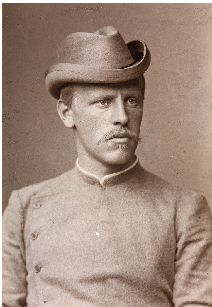
Фритъоф Нансен. 1889 год.

Паспорт стал предпосылкой для создания Проездного документа беженца, ратифицированного Конвенцией ООН о статусе беженцев 1951 года.