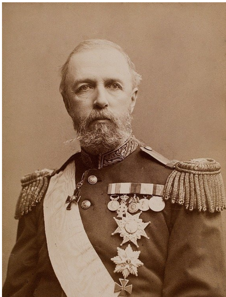
Оскар II.

осуществлять полномочия, которые ранее были в руках монарха, и, следовательно, Оскар II перестает исполнять обязанности норвежского короля.