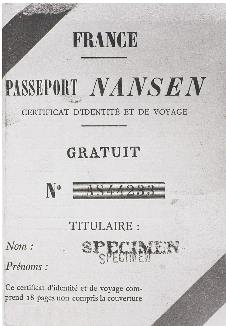
Нансеновский паспорт.