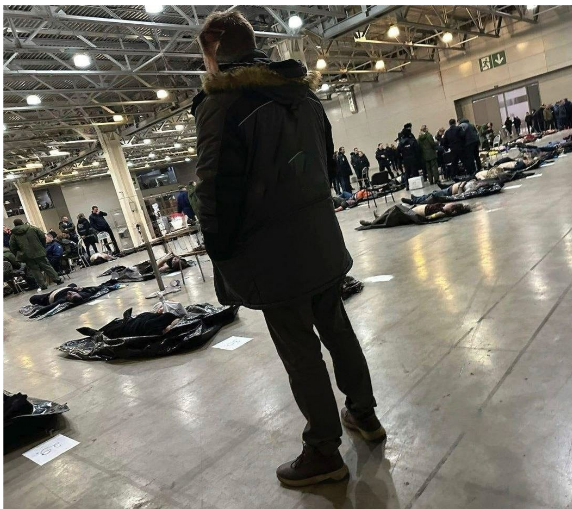
Помещение используется сейчас для осмотра и предварительного опознания тел погибших.

Блогеры Z-сообщества, националисты, антисемиты и сходно мыслящие политики в России немедленно ухватились за украинскую версию. Ослепленные ненавистью к соседям и «ценностями» национализма, они полагали, что нашли друзей или на худой случай ситуационных союзников среди исламских радикалов. Все их бесконечные писания в пользу «правого дела» фундаменталистов и против Израиля в ходе боевых действий в секторе Газа взывали чуть ли не к боевому братству врагов высокомерного Запада.