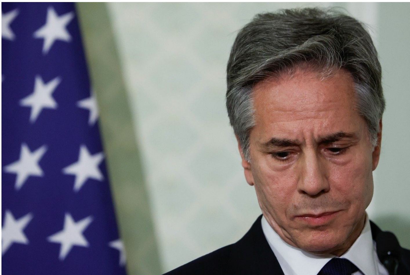
Госсекретарь США Энтони Блинкен.

скорбящим о гибели людей в результате этого ужасного события».