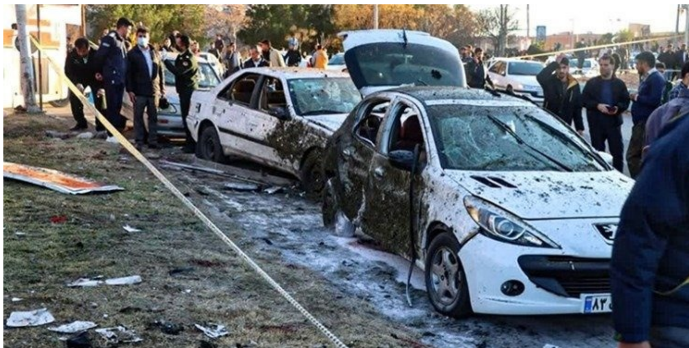
3 января 2024 года. Керман, Иран. В четвертую годовщину убийства иранского генерала Касема Сулеймани в результате двух взрывов погибли по меньшей мере 94 человека, ранены 284.

Есть и обратные примеры. В 2019 году Комитет по защите журналистов подал в суд на администрацию Трампа, чтобы получить информацию о том, соблюдало ли правительство США принцип «обязанности предупредить» в деле об убийстве американского журналиста саудовского происхождения Джамалия Хашогги. В августе 2021 года апелляционный суд США постановил, что спецслужбы США не обязаны раскрывать, располагали ли они информацией об угрозах жизни Хашогги.