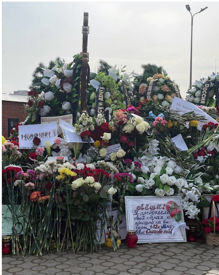
26 марта. Могила Алексея Навального на Борисовское кладбище.

российской политике, послушав интервью Алексея. А еще рассказы о том, каким он был, как он умел дружить, как часто помогал другим и каким он был в обычной жизни. Уже публикуется книга его многочисленных ярких последних слов в судах и, похоже, не за горами издания, описывающие и анализирующие и его взгляды, и его жизнь.