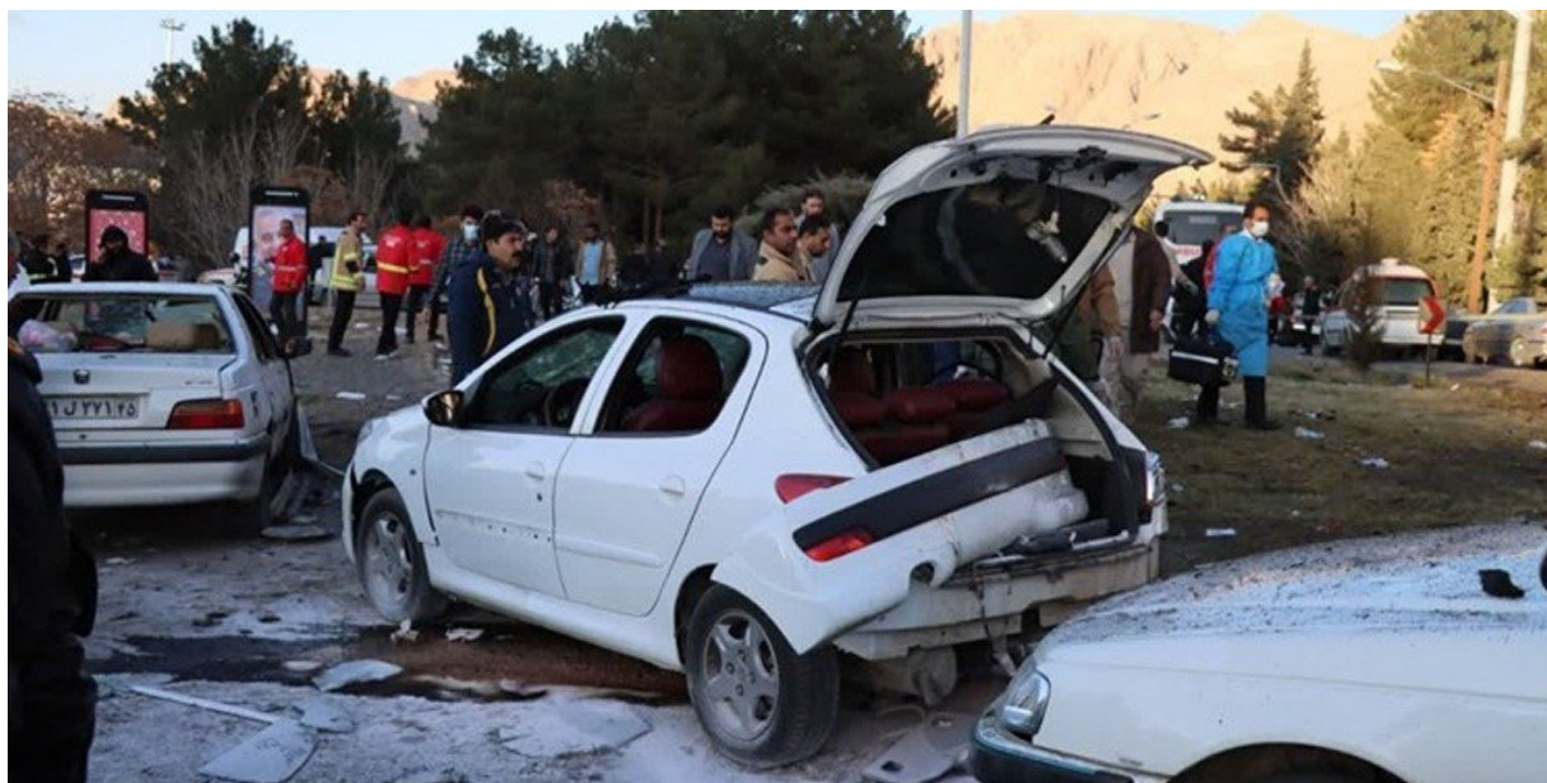
3 января 2024 года. Керман, Иран. В четвертую годовщину убийства иранского генерала Касема Сулеймани в результате двух взрывов погибли по меньшей мере 94 человека, ранены 284.

Фирменный стиль ИГИЛ — атаки смертников. По-настоящему радикализированных террористов крайне редко удастся захватить живыми, это просто противоречит их конечной цели, которая заключается в том, чтобы попасть на небеса в качестве мученика-шахида, а попутно унести с собой максимальное количество жизней «неверных».