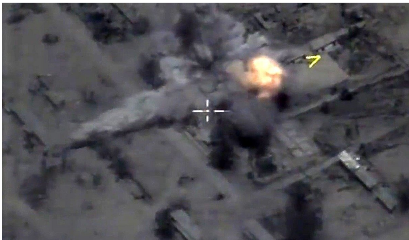
Корабли ВМФ РФ запустили крылатые ракеты по объектам ИГ у Пальмиры, 2017 г.

пишут арабские СМИ, также якобы поступили представители сразу трех игиловских батальонов («Хоррас-эд-Дин», «Имам Бухари» и «Мальхама Тактикаль»). Сейчас они воюют против России. Как, впрочем, и некоторые русские нацики. Каждый — исходя из своих мотивов.