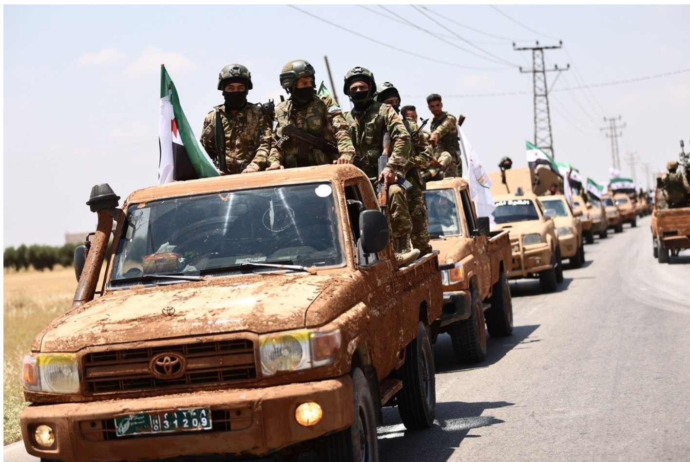
Парад подразделений Сирийской национальной армии, поддерживаемой Турцией, в провинции Алеппо, 2022 г.

СНА, как и ее предшественница ССА, — это светская армия. У них есть боевой опыт, их готовят инструкторы второй по численности армии НАТО, у них хорошее вооружение — при этом никто во всем мире не сможет предъявить Эрдогану за подготовку боевиков. Все эти тренировочные лагеря находятся в Сирии, не в Турции, ведь один спутниковый снимок такого лагеря — и все, репутация Эрдогана как гаранта мира во всем мире разрушена.