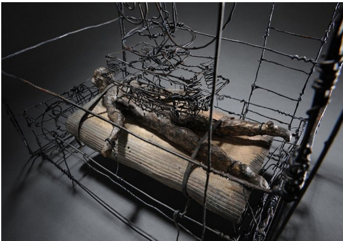
Проволочная скульптура Мартина Сенна, созданная по мотивам рассказа Кафки об исправительной колонии.

Даже Кафка — при нашем желании — дает свет. Где можно увидеть и деколонизацию (выход из кафкианских кошмаров). И весь трагизм (или наоборот) бородатой, но точной шутки — «мы рождены, чтоб Кафку сделать былью» — зависит целиком от нашего настроения.