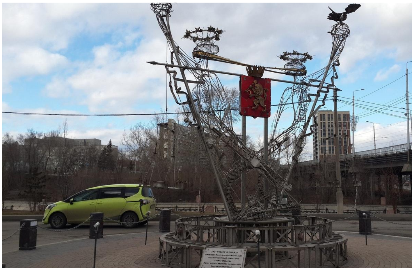
Арт-объект «Правда и справедливость», она же «Фемида» в Красноярске.

Кульминация ритуала сопровождается катарсисом. У всех: у осужденного, читающего своими ранами, у зрителей, читающих по глазам осужденного. «Но как затихает преступник на шестом часу! Просветление мысли наступает и у самых тупых. Это начинается вокруг глаз. И отсюда распространяется. Это зрелище так соблазнительно, что ты готов сам лечь рядом под борону. Вообще-то ничего нового больше не происходит, просто осужденный начинает разбирать надпись, он сосредоточивается, как бы прислушиваясь».