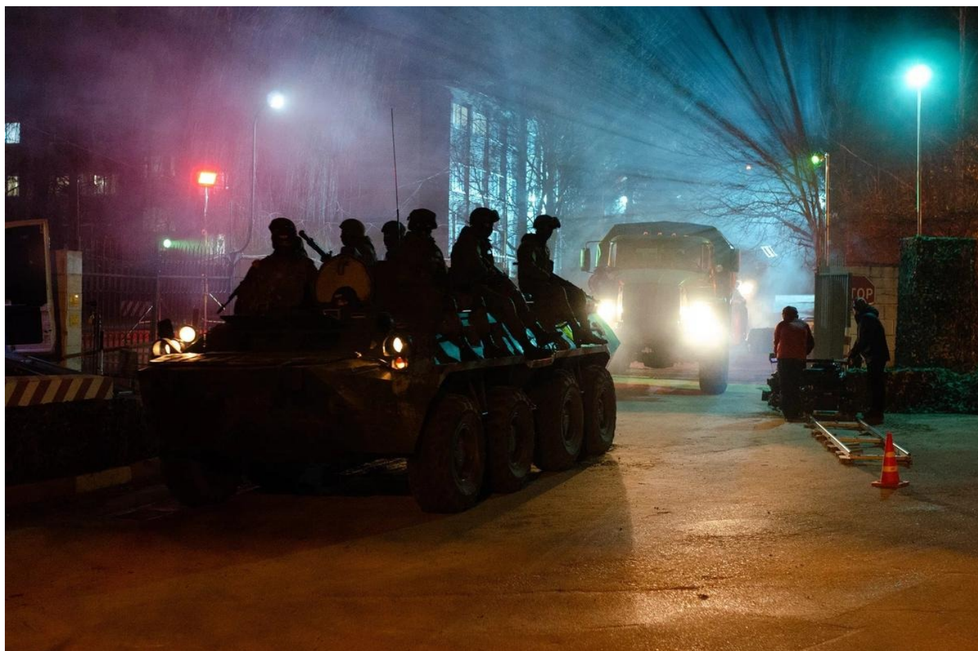
Кадр из сериала «Десять дней весны»

О ценности для искусства нового кино могу сказать лишь одно: каждому зрителю, досмотревшему упомянутые сериалы до конца, следует выдавать награду типа «Золотого орла», не меньше. Самое интересное, что политические события, о которых они повествуют, значатся лишь на уровне символа. Зрители федеральных каналов давно уже обучены тому, как правильно относиться к Украине, к распаду Советского Союза, к коллективному Западу. Осталось только выдумать убойный сюжет. В центре, извините за выражение, политического триллера «Переведи ее через Майдан» — ограбление крупного банка в Донецке, совпавшего по времени с майданом. «Десять дней до весны» начинается как семейная сага. Два брата и сестра приезжают в Севастополь делить наследство умершего отца. И тут все распри позабыты — их объединяет Крымская весна. Сериал «ГДР» заточен под приключения нелегального советского разведчика, который ищет, обгоняя другие разведки, архив Штази.