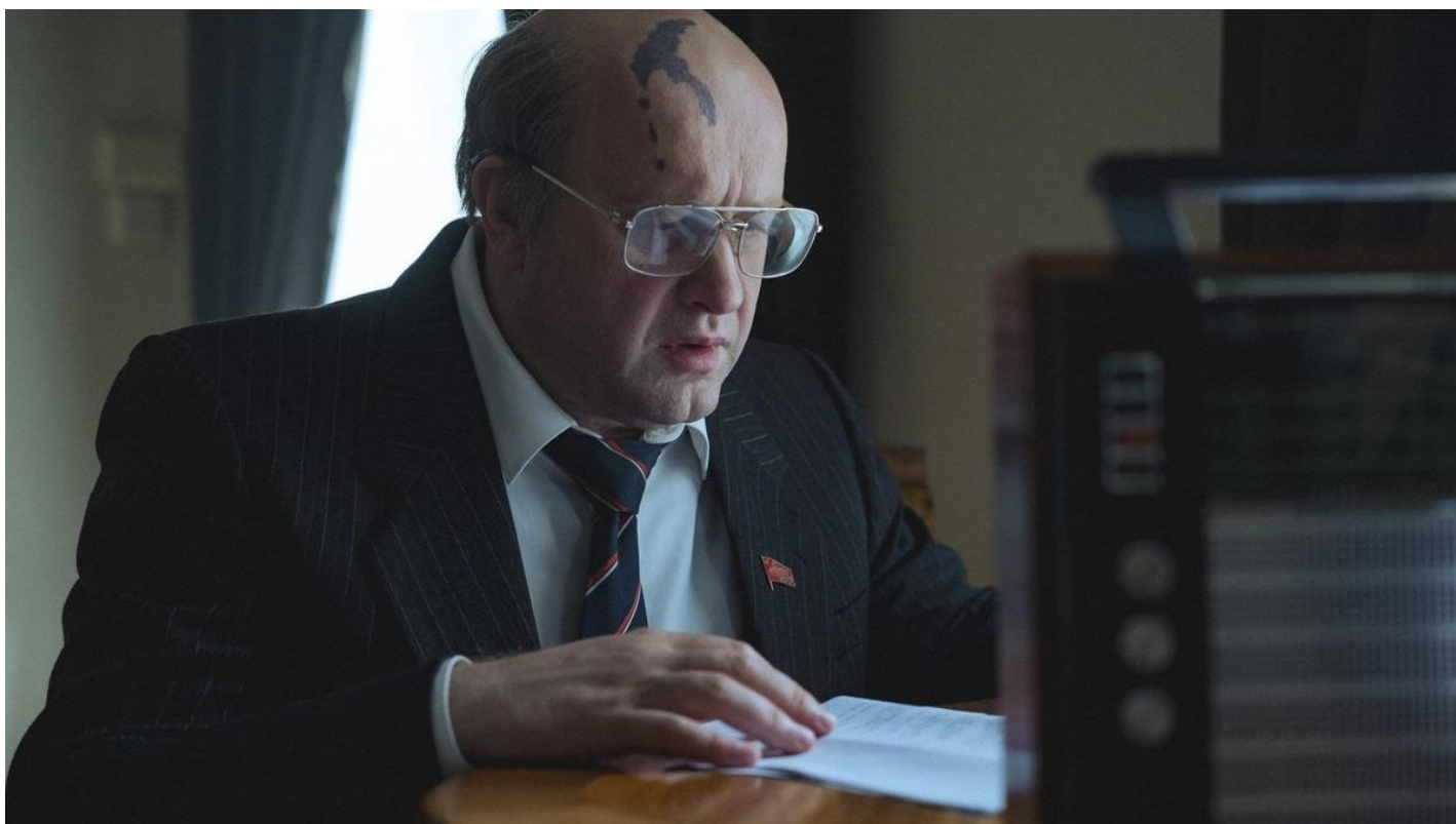
Кадр из сериала «ГДР»

Всё, что нужно знать об ура-патриотических телесериалах на примере «ГДР», «Переведи ее через Майдан» и «Десять дней до весны»