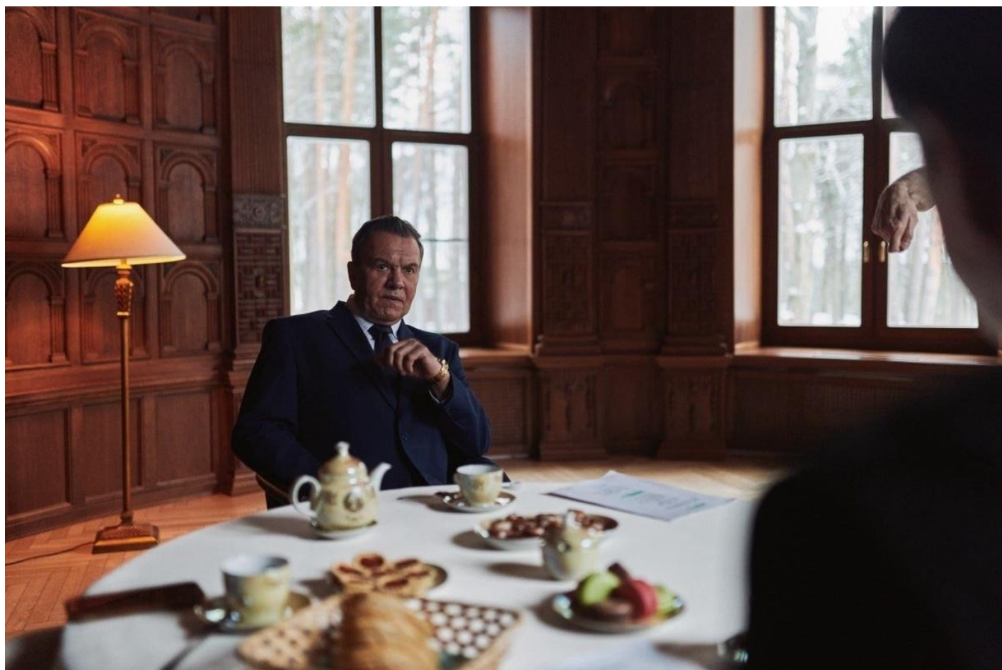
Кадр из сериала «Переведи ее через Майдан»

А какая прелесть Янукович из сериала «Переведи ее через Майдан»! Глазки бегают туда-сюда, губки надуты. Рядом люди суетятся, пият бабки, ищут флешки с компроматом (ой, это кажется из другого фильма, хотя какая разница?), а у него глазки всё бегают. Президенту Украины докладывают: Крым недоволен, они хотят уйти в Россию. Ишь ты, плотоядно улыбается Янукович, губа не дура.