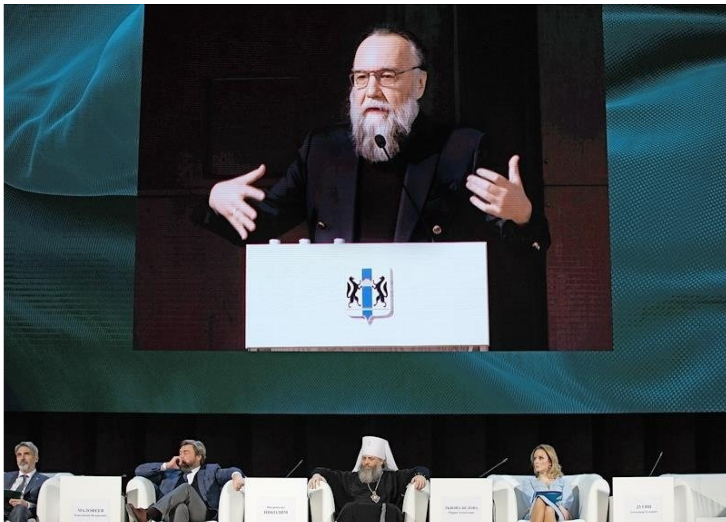
Александр Дугин.

Война, церковь и больница — три места, где человек остро ощущает, что он смертен. В церкви мы пытаемся проникнуть в динамику неподвижной жизни (покойник в гробу). В больнице мы угасаем. Но война интенсивнее всего, она наглядный урок жизни и смерти.