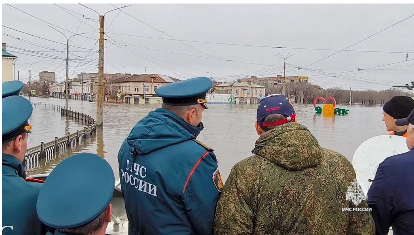
Глава МЧС и губернатор Паслер осматривают последствия паводка в Оренбургской области.

Губернаторы никак не зависят от мнения и протестов жителей. Президент поставил — президент и снимет. Или не снимет