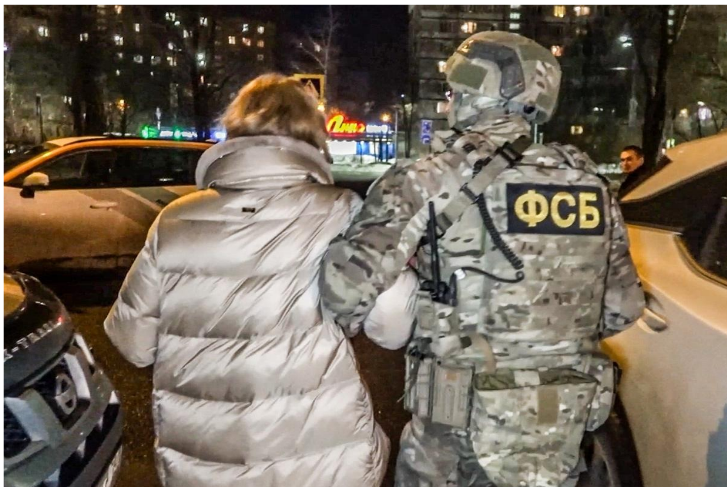
Задержание создателей узла связи в РФ для работы телефонных мошенников.

Специалисты в сфере социальной психологии выделяют несколько групп людей, в отношении которых индоктринация наиболее вероятна. В их числе истероиды, психостеники, лица с паранойяльной настроенностью, лица из семей с гиперопекой, неполных или асоциальных семей, пережившие тяжелые психотравмы, с развитым эйдетическим восприятием (галлюцинации наяву) и склонные к «галлюцинациям воспоминания»).