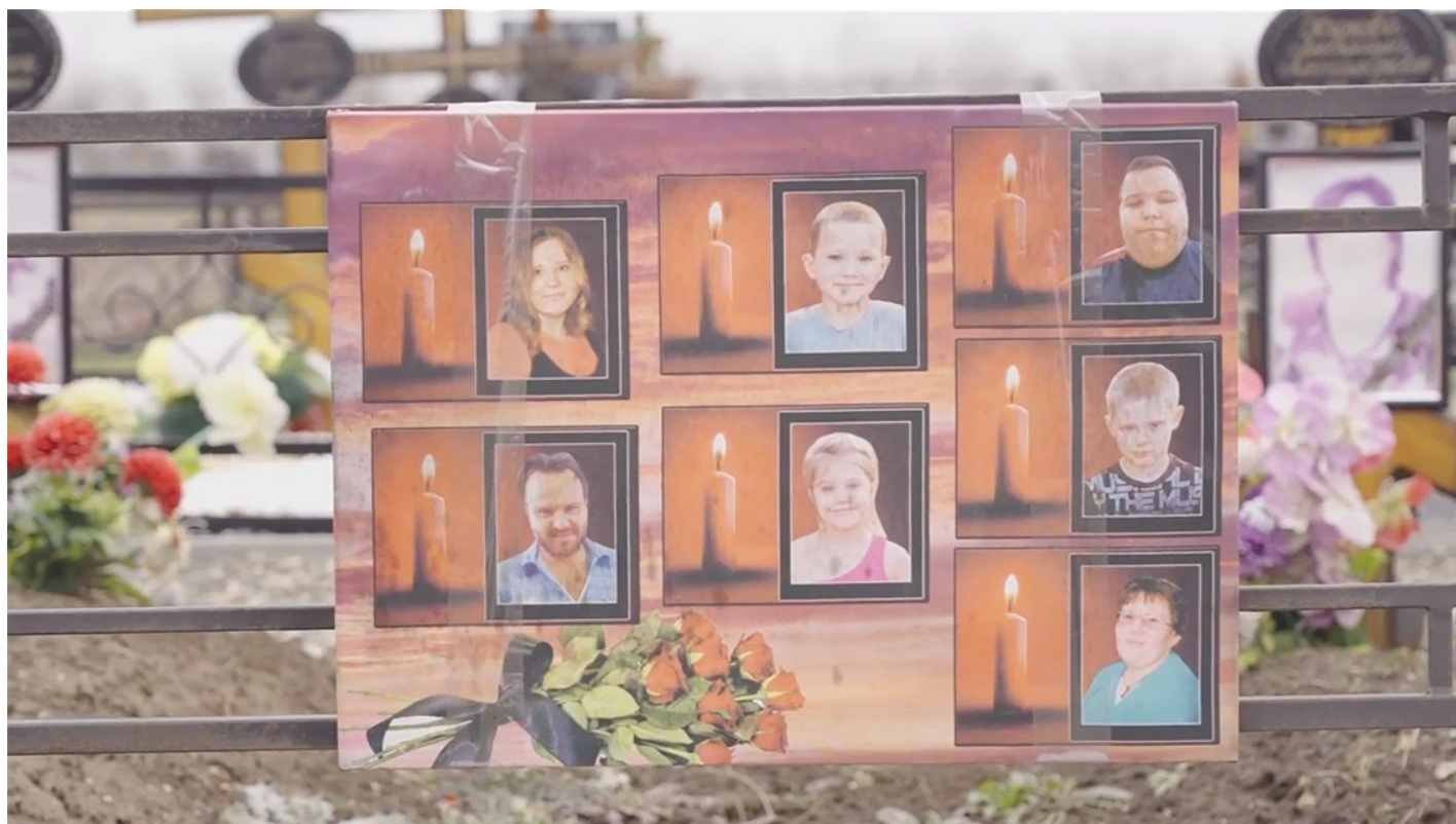
Кадр из документального фильма Анны Артемьевой и Ивана Жилина «Невыносимо громко»