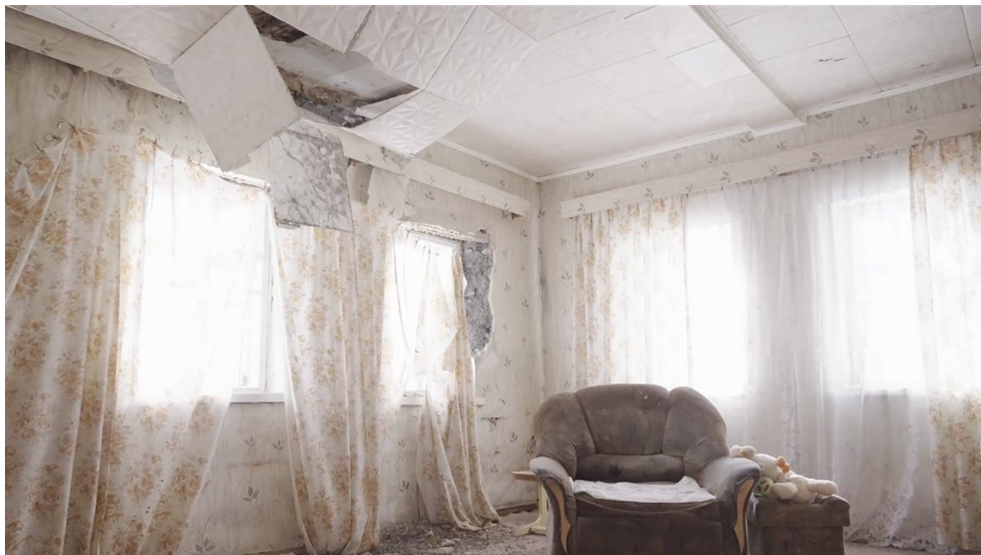
Кадр из документального фильма Анны Артемьевой и Ивана Жилина «Невыносимо громко»

Зеленые стены испещрены следами осколков. Одна из дыр — сквозная. Крыша пробита.