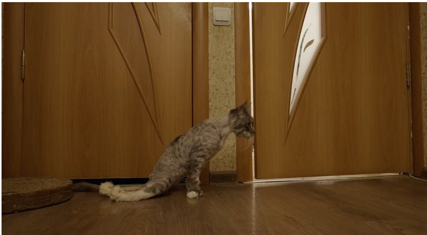
Кадр из документального фильма Анны Артемьевой и Ивана Жилина «Невыносимо громко»

Когда они уезжали, они привозили обеих кошек сюда. Я еще и ссорилась с ними, потому что этот мейн-кун проблемный. А теперь — мне предлагали его усыпить, а я не могу этого сделать. Никогда не смогу, потому что они его очень любили, и, мне кажется, дети мне не простили бы, если б я что-то с ним сделала.