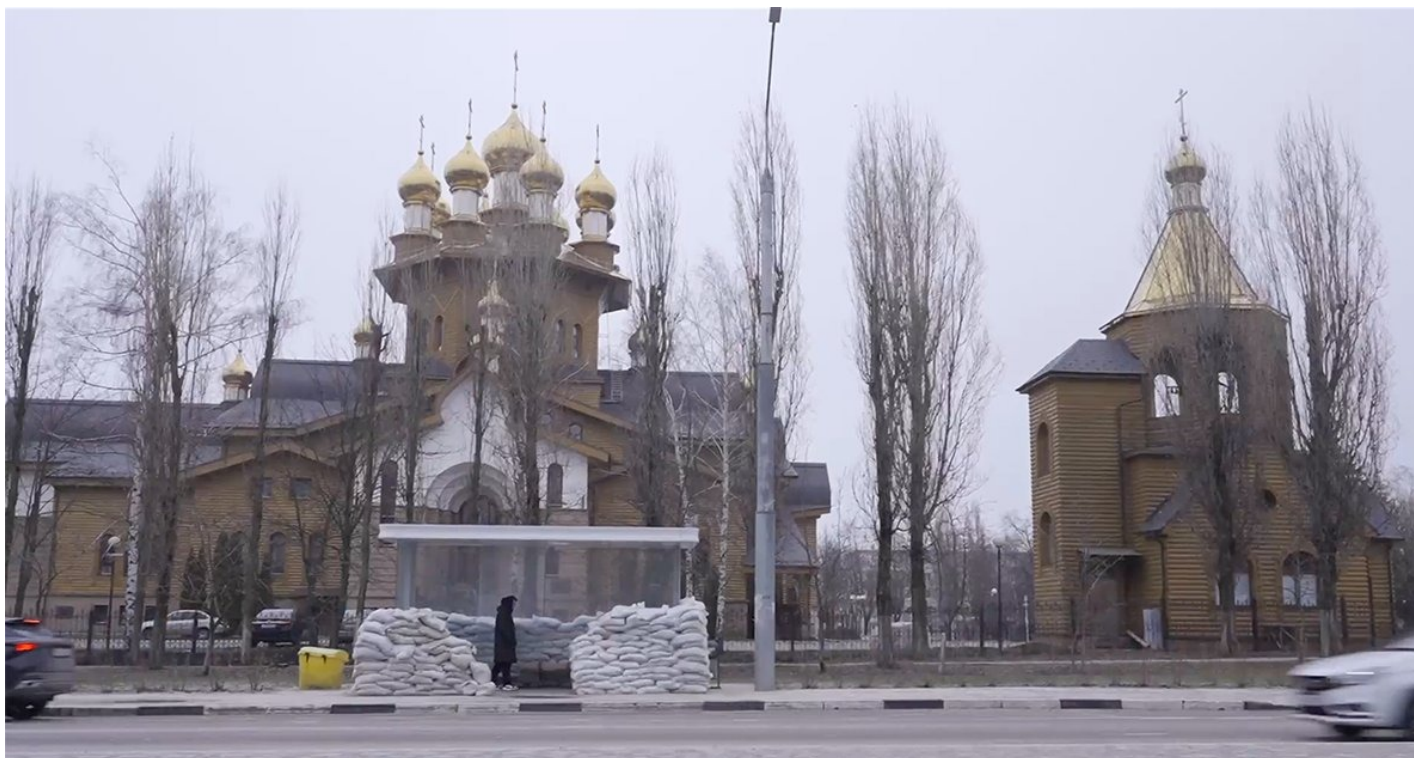
Белгород. Кадр из документального фильма Анны Артемьевой и Ивана Жилина «Невыносимо громко»