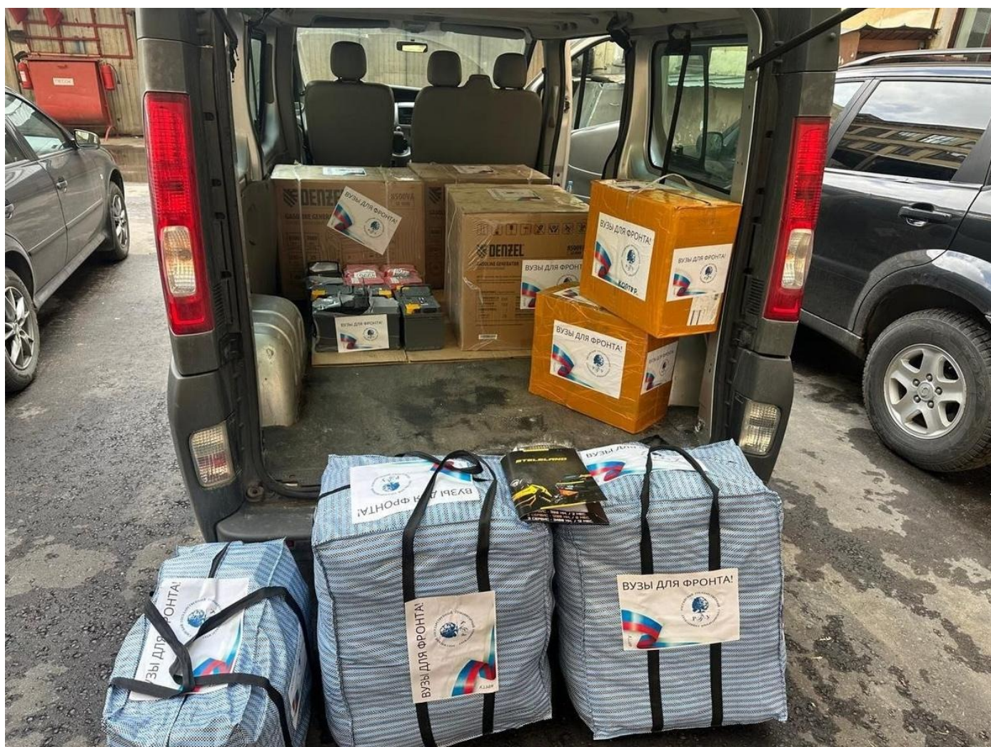
РГГУ участвует во всероссийской акции «Вузы для фронта!».

Отреагировала и администрация президента, с помощью РИА «Новости» встав на защиту, мягко говоря, неоднозначного мыслителя. Официальный же Кремль в лице Пескова заявил, что «не хотел бы быть частью этой дискуссии»: «Президент действительно неоднократно цитировал Ильина. Да и в любом случае оскорбления Дугина считаем непозволительными».