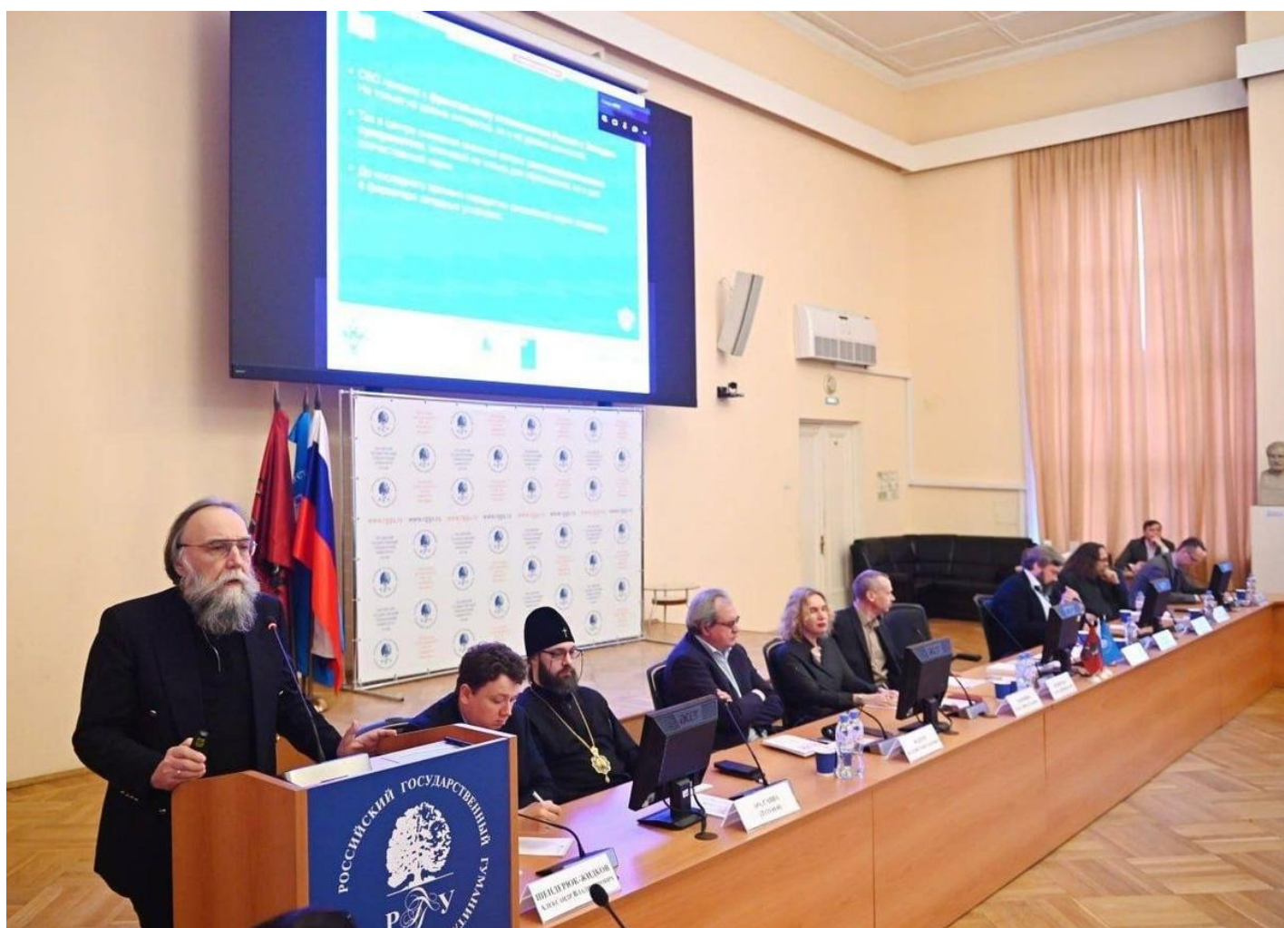
Александр Дугин в РГГУ.

Но с точки зрения либерализма новой волны общество должно толерантно относиться к взглядам других людей. Почему же студенты национал-большевистских взглядов должны быть ограничены в потребности политического высказывания? Если недовольная группа хочет перемен, то пусть сделает запрос на создание центра, удовлетворяющего их идеи.