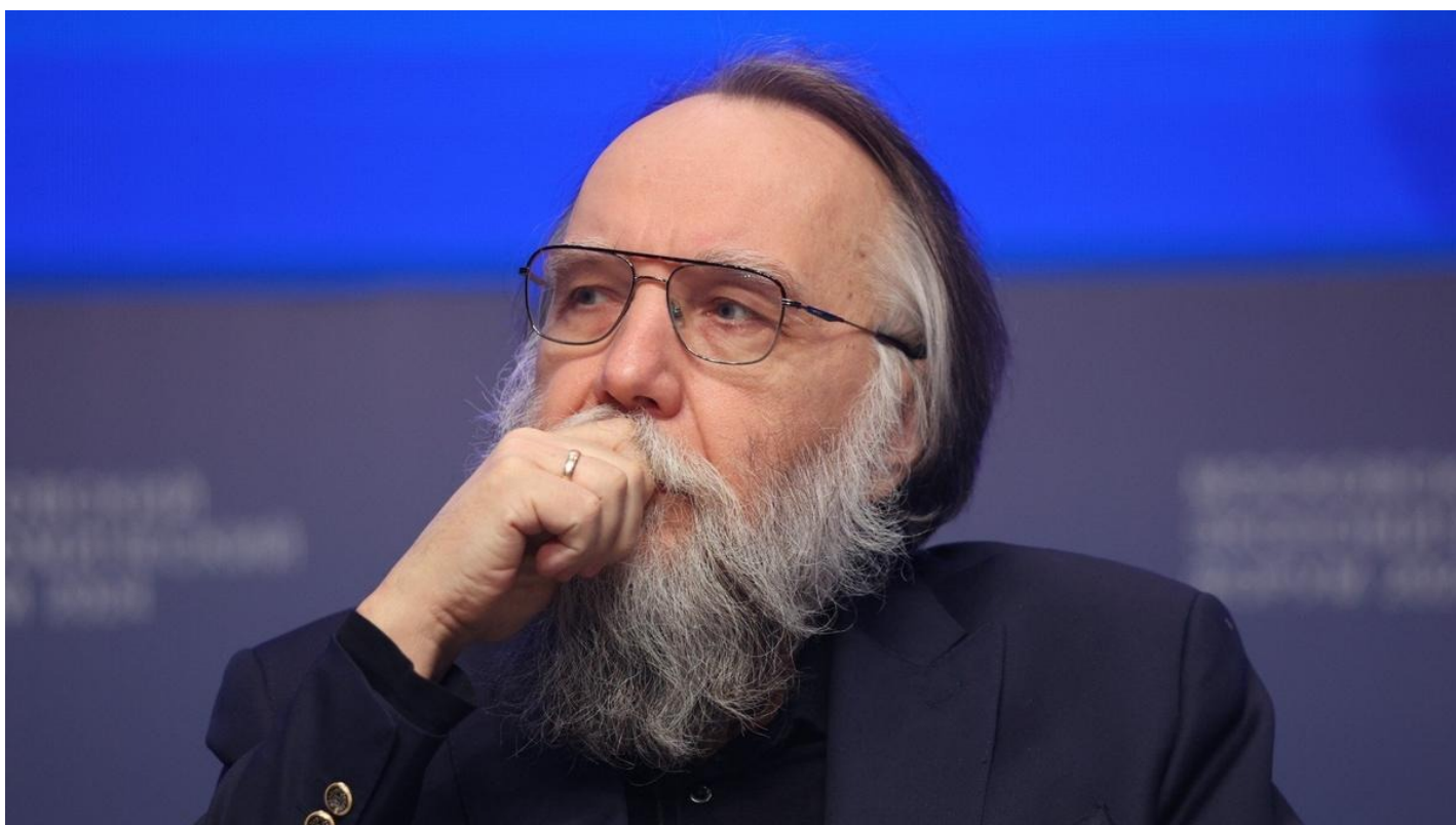
Александр Дугин.

Скандал вокруг создания в РГГУ «Высшей политической школы Ивана Ильина» вышел на новый уровень. Мнения студентов, депутатов и администрации вуза