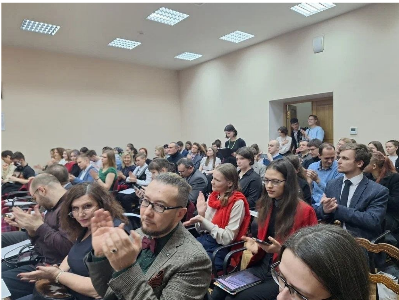
Студенты РГГУ.

«Научный центр одного из ведущих вузов страны-победительницы фашизма не может носить имя сторонника фашистских идей, принимая во внимание ту общественно-политическую обстановку, в которой в данный момент находится наша страна. Университет должен оставаться обителью знаний и творчества, свободной от политической конъюнктуры и пропаганды. Мы убеждены, что философствования Ильина имеют мало общего с ценностями прогрессивного человечества, как и фашистская идея, являющаяся противоестественным политическим конструктом».