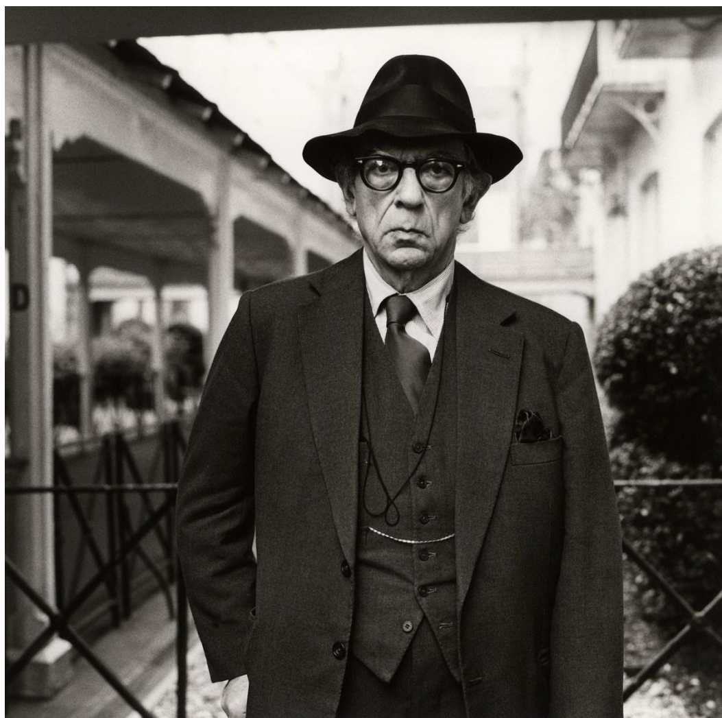
Исайя Берлин.

И в том и в другом случае свобода, по выражению Берлина, является «не столько действием, сколько возможностью действия». Кажется бы, обе концепции выглядят вполне мирно и многообещающе. Но проблемы начинаются именно тогда, когда мы начинаем смотреть и на них, и на понятие свободы в целом как на абстрактный и ничем не запятнанный идеал, которого главное достичь, а дальше все сложится само собой. Дело в том, что главный побочный эффект такого взгляда — превращение свободы в диктатуру. Как выясняется при чтении эссе Исайи Берлина, механизм этого превращения довольно простой.