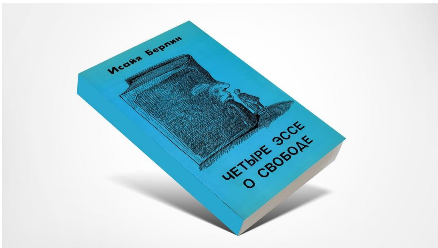
Обложка книги «Четыре эссе о свободе»

О книге Исайи Берлина «Четыре эссе о свободе»