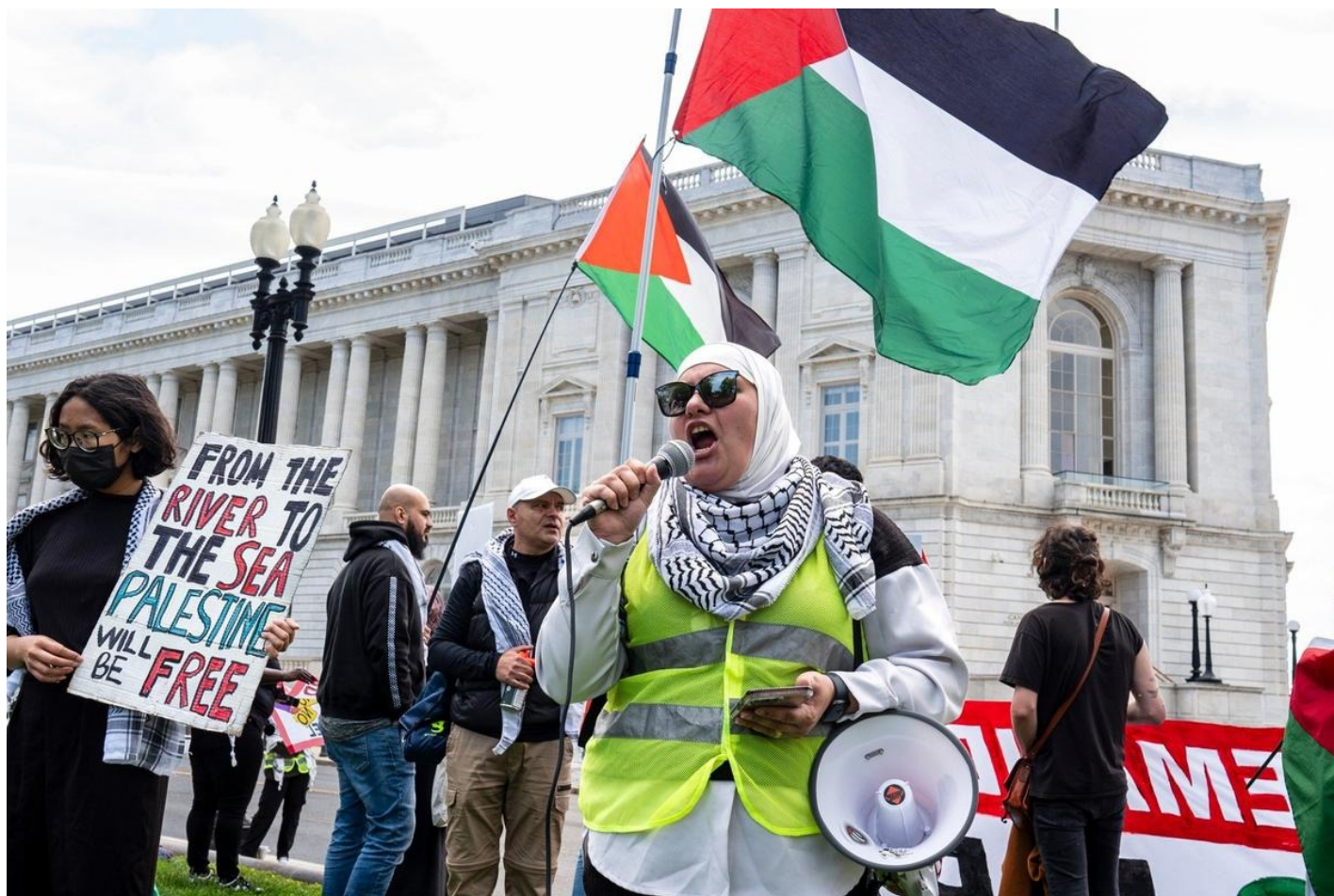
Пропалестинские активисты проводят демонстрацию возле Капитолия в Вашингтоне в субботу, 20 апреля 2024 года.

Джонсон предусмотрительно разбил общий пакет иностранной помощи на отдельные законопроекты, памятуя о том, что в «украинском вопросе» голосовать против будут правые республиканцы-трамписты, а против военной помощи Израилю выступит левое крыло Демократической партии, которое не устраивает ответ правительства Нетаньяху на террористический рейд хамасовцев 7 октября, унесшего жизни как минимум 1200 израильтян. Они требуют прекращения бомбардировок Газы, в результате которых, как утверждают палестинцы, также погибли тысячи мирных жителей. Чтобы разбить голоса «против», спикер разделил выделение денег для каждой страны.