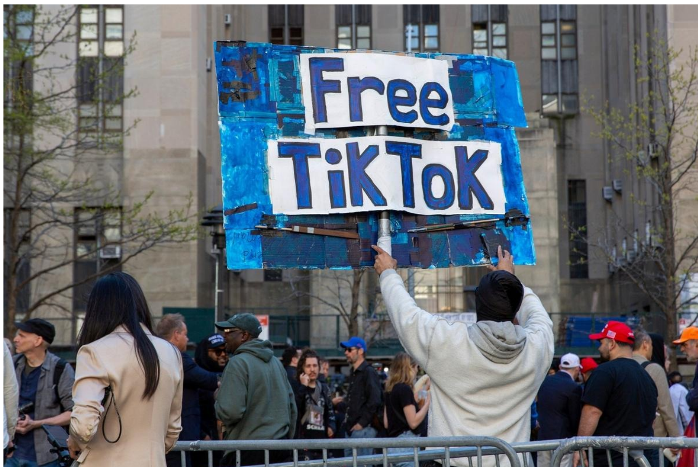
Палата представителей приняла закон о запрете TikTok в США.

Что касается российских активов, то их в Америке немного по сравнению с европейскими странами — 5 или 6 миллиардов долларов. На весенних заседаниях Международного валютного фонда и Всемирного банка в Вашингтоне на прошлой неделе американские официальные лица предлагали европейцам использовать часть из 280 миллиардов долларов резервов российского Центробанка, которые союзники заморозили в первые часы после начала военных действий. За последние несколько месяцев рассматривались различные предложения, в том числе конфискация активов и их перевод в Киев или использование прибыли от российских инвестиций. Франция и Германия пока возражают против прямой конфискации. Окончательное решение о перепрофилировании российских активов может быть принято на июньском саммите президента Байдена и других лидеров «Большой семерки» в Италии.