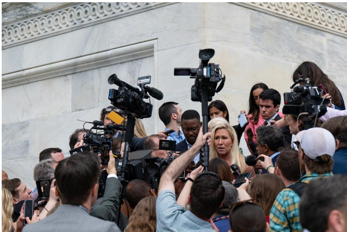
Представитель США Марджори Тейлор Грин покидает Капитолий после голосования в Палате представителей.

«Я думаю, что каждый американец в этой стране должен быть в ярости. Кто будет голосовать за этих людей? Они не служат нашей стране», — сказала Грин о коллегах-республиканцах, которые поддержали финансирование Украины.