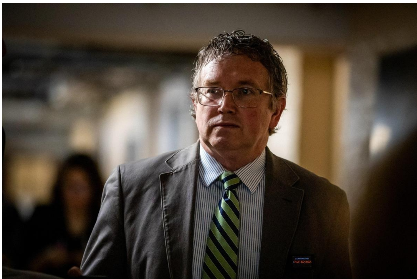
Томас Мэсси.

Удивительным образом Дональд Трамп, выступавший против помощи Украине, в очередной раз переобулся на ходу или, как здесь говорят, «изменился». 12 апреля он признал, что выживание Украины «важно для США». Он написал об этом в своей социальной сети, за которой следят все: и конгрессмены-республиканцы, и Белый дом. На Трампа могли повлиять контакты с иностранными лидерами — в частности, с нынешним главой британского Форин-офис (и бывшим премьером) Дэвидом Камероном. И сейчас политологи гадают, что появилось раньше — курица или яйцо. Мол, это конгрессмены-республиканцы, включая спикера Джонсона (как писали СМИ, он консультировался с Трампом), увидели, что «Трамп не против» и поддержали законопроект? Или бывший (будущий?) президент понял, что республиканцы готовы объединиться с демократами и дать деньги и оружие Украине, независимо от его возражений? Не можешь победить — присоединись. Одновременно Трамп опубликовал в