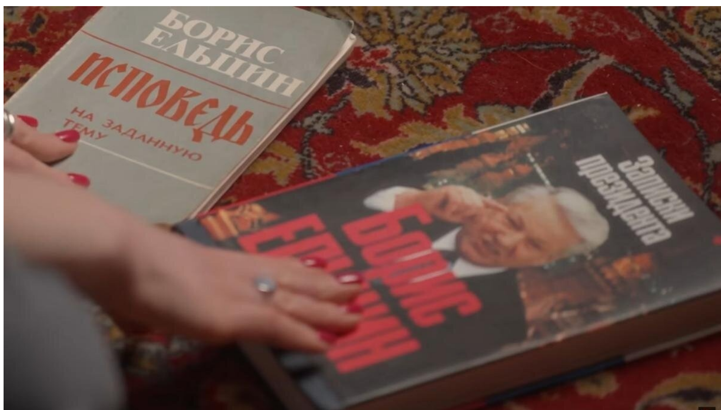
Кадр из сериала «Предатели»

категоризировать феномен «Семьи» как ключевой элемент ельцинской политической системы. В 2012-м, на выходе из эпохи, я написал статью «Преданная революция», где обозначил приватизацию как поворотный пункт новейшей российской истории, без осмысления которого и покаяния за который никакое прекрасное будущее России невозможно. Ваучеры всей моей семьи лежат в тумбочке в Лондоне — мы приняли коллективное решение, что участие, даже в шутку, в мошенничестве века унижает наше человеческое достоинство (при этом альтернативы лично у меня были, поскольку в это же время американское рекрутинговое агентство предлагало мне принять участие в конкурсе на должность директора Центра приватизации).