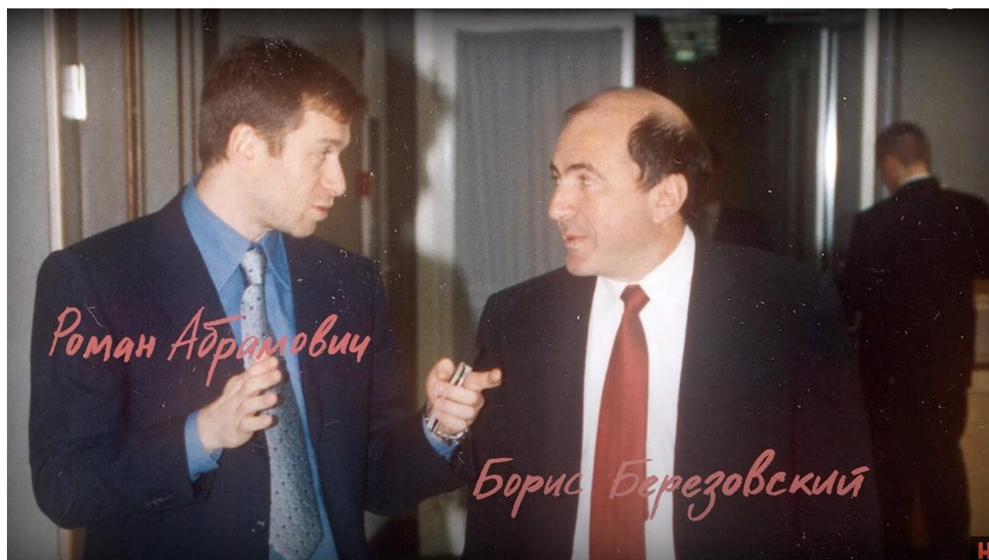
Олигархи Роман Абрамович и Борис Березовский. Кадр из сериала «Предатели»

Значит ли это, что мы должны забыть и простить? Мол, Анатолий Борисович, приватизация была классной идеей. Или: Петр Олегович, история с письмом по бартерным сделкам питерской мэрии не вызывают никаких вопросов. Или: Михаил Борисович, залоговые аукционы лишь подтвердили, что социальная справедливость всегда была в приоритете у русского бизнеса.