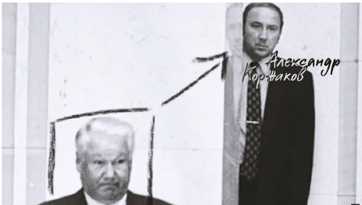
Александр Коржаков — руководитель охраны Ельцина.

[начавшему спецоперацию]? (...) К псевдофилософам и псевдополитологам, призывающим уничтожить все человечество (зачем нам этот мир, если в нем нет русских)? К охране, которая раскручивает маховик репрессий, стремясь догнать и перегнать Россию до масштабов «Круга первого»? Нет, это ненависть и страх перед убежавшим Чубайсом, пытающимся замыслить новый проект «больших демократических реформ». Перед прикусившими язык, но смертельно боящимися и ненавидящими Путина олигархами, мечтающими, чтоб он дал им снова нормально жить на Западе. Перед ошметками либеральной интеллигенции 90-х, успевшей съехать на Запад и мечтающей возродить Россию своей молодости. Перед другими антивоенными и оппозиционными эмигрантскими кружками, которые корнями уходят в те же 90-е и каждый по-своему пытаются что-то сделать для борьбы с режимом. Перед остатками все той же некогда царственной «Семьи», проживающей в изгнании и с ужасом наблюдающей за приключениями своего ставленника.