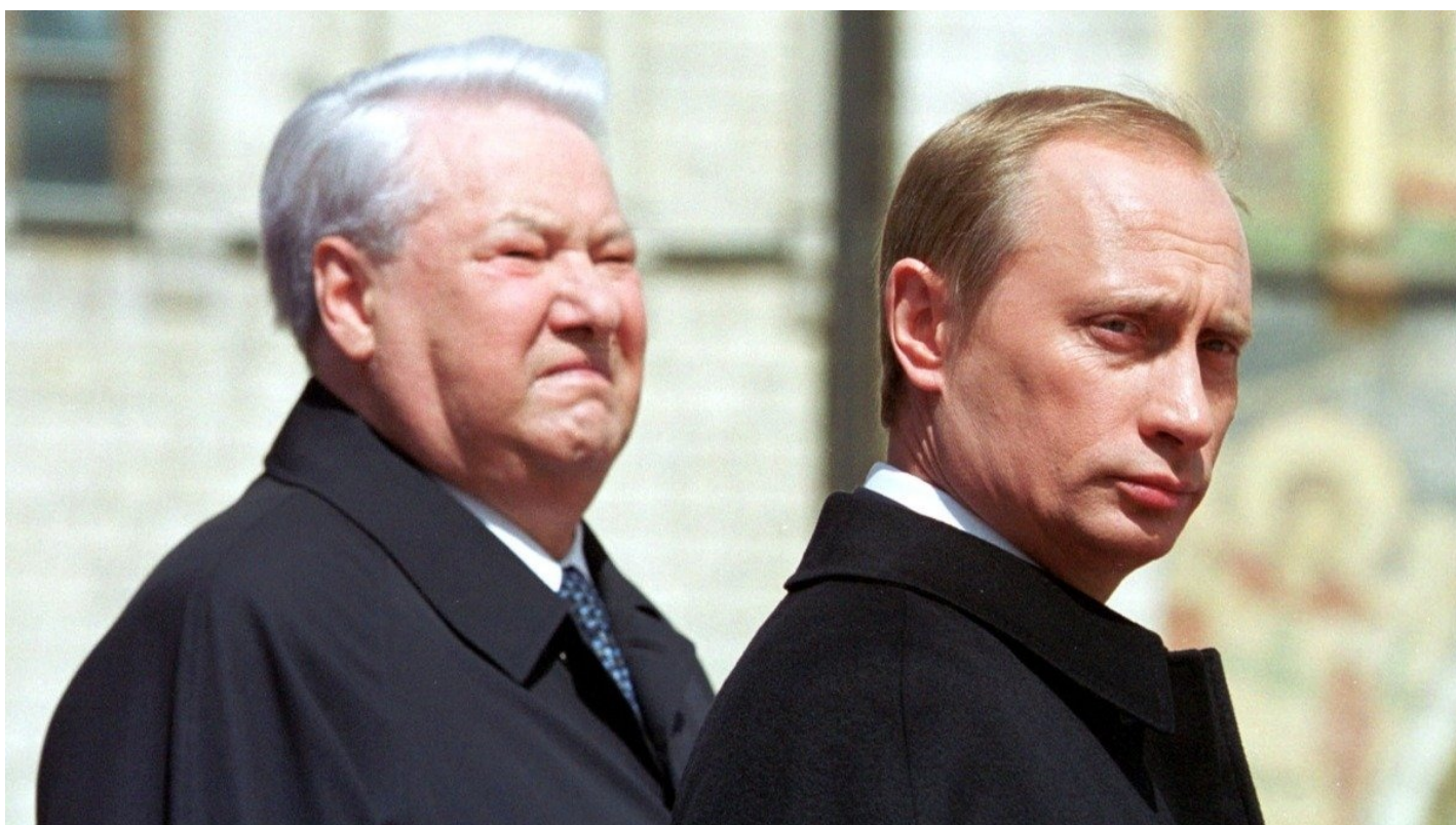
Борис Ельцин и Владимир Путин.

Кого стоит ненавидеть и бояться русской оппозиции. О «Предателях» и предателях, о простоте и большевиках, о новой инквизиции и старых ведьмах