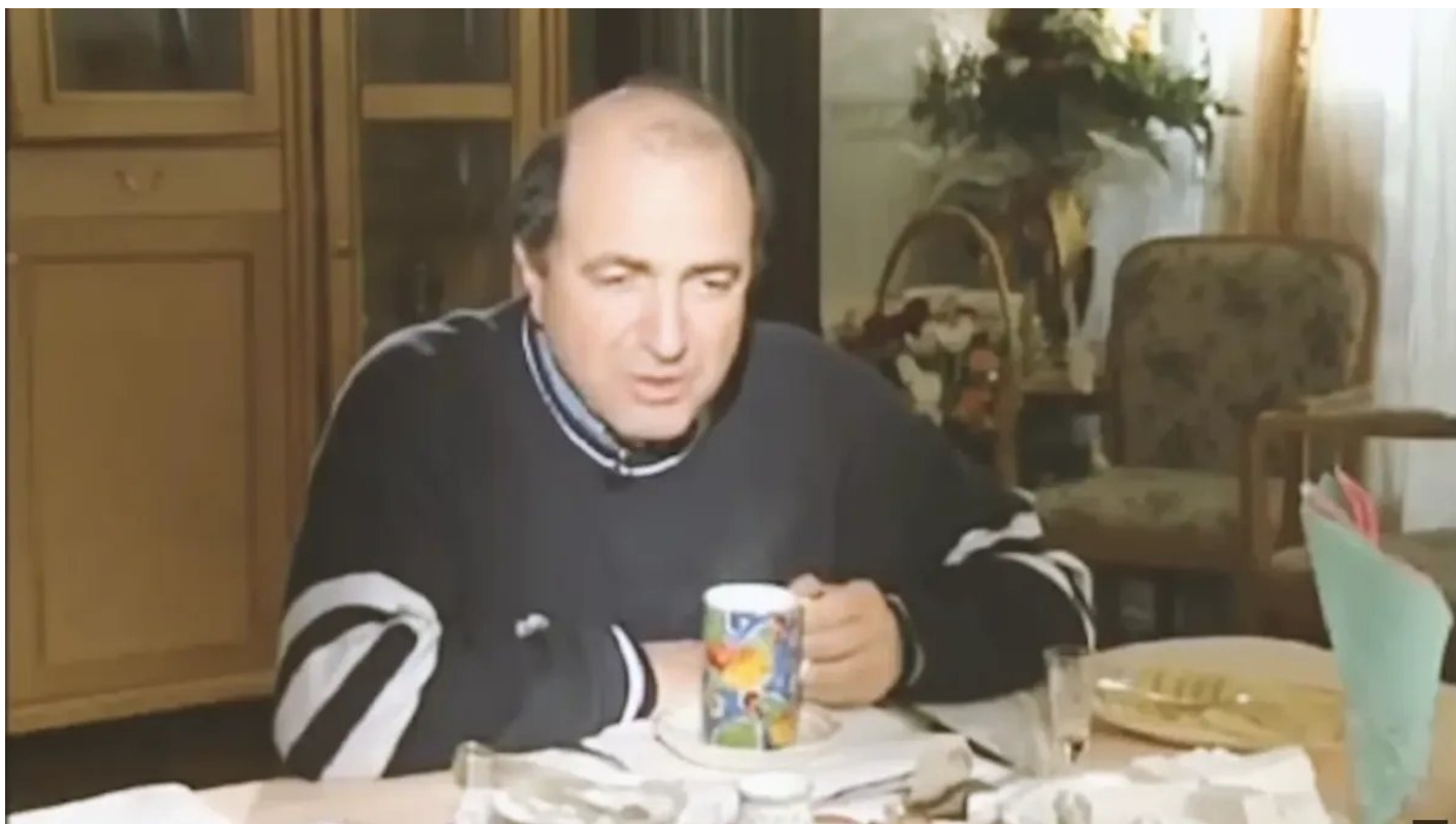
Борис Березовский, в прошлом всемогущий олигарх, близкий к «семье». Скриншот из сериала «Предатели»

Пусть тот, кто скажет, что до фильма «Предатели» он не читал ничего подобного, первым бросит в меня философский камень (но сначала пусть его найдет).