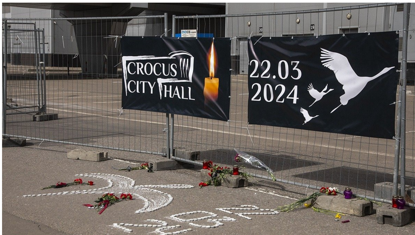
Временный мемориал жертвам теракта в «Крокус Сити Холле».

Временный мемориал жертвам теракта в «Крокус Сити Холле» убрали, не дождавшись даже 40 дней с момента гибели 145 человек