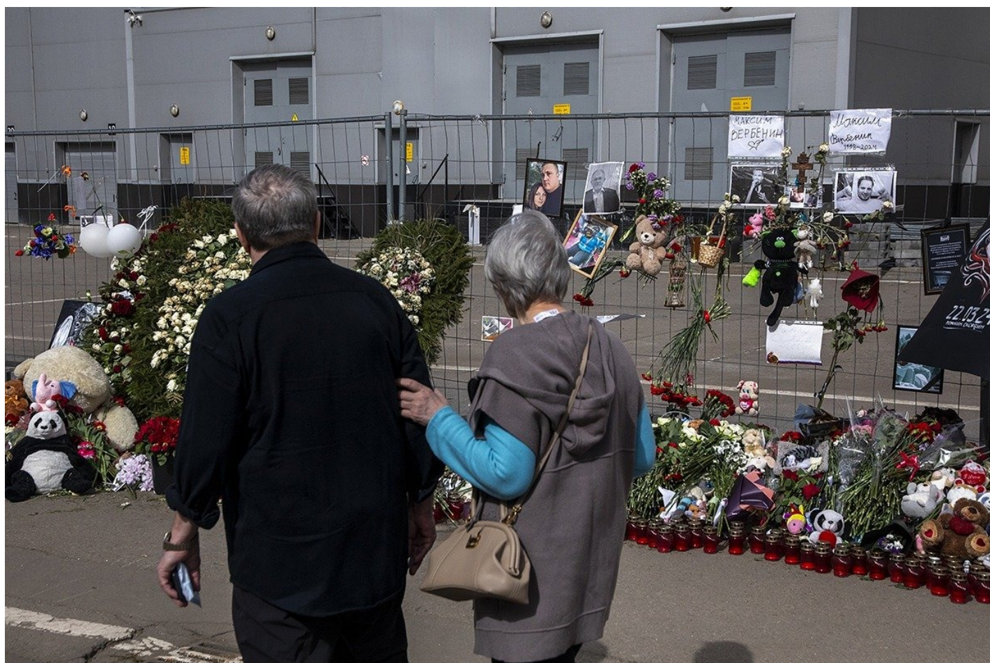
Мемориал у «Крокуса».

Вечером 22 марта он вместе с женой Дарьей пришел на концерт группы «Пикник», во время стрельбы Даша получила ранения, Михаил — нет, но надышался дымом.