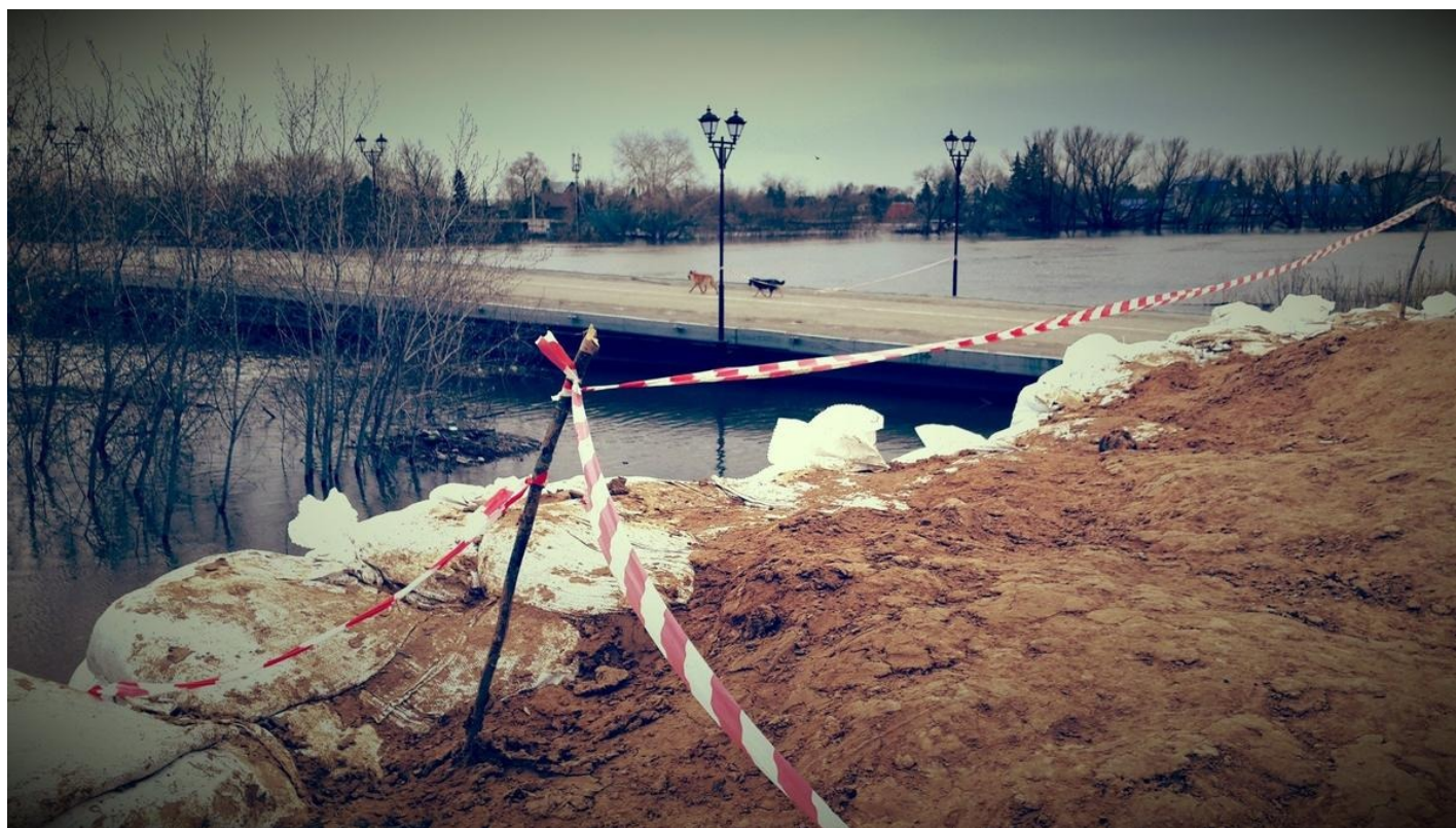
Собаки по Кировскому мосту сбегают обратно на незащищенный и затопленный правый берег.

А пока иду к следующему мосту. Второй ярус центрального отрезка набережной уже затоплен, перекрыт. Рядом со мной оказывается рабочий, вычисляем с ним, насколько уровень воды на этом ярусе, огражденном мешками, ниже, чем в реке. Сантиметра на два. «Специально приехал посмотреть на плоды наших трудов. Нас снимали с работы, в три смены сюда везли, в 9, в 2 и в 6 часов. Мешки таскать. Неужели ничего лучшего человечество не может придумать? Это ж подорожником лечить». Рассказывает тоже про собак. Ездит на дачи подкармливать соседских — хорошо, что их хоть с привязи спустили.