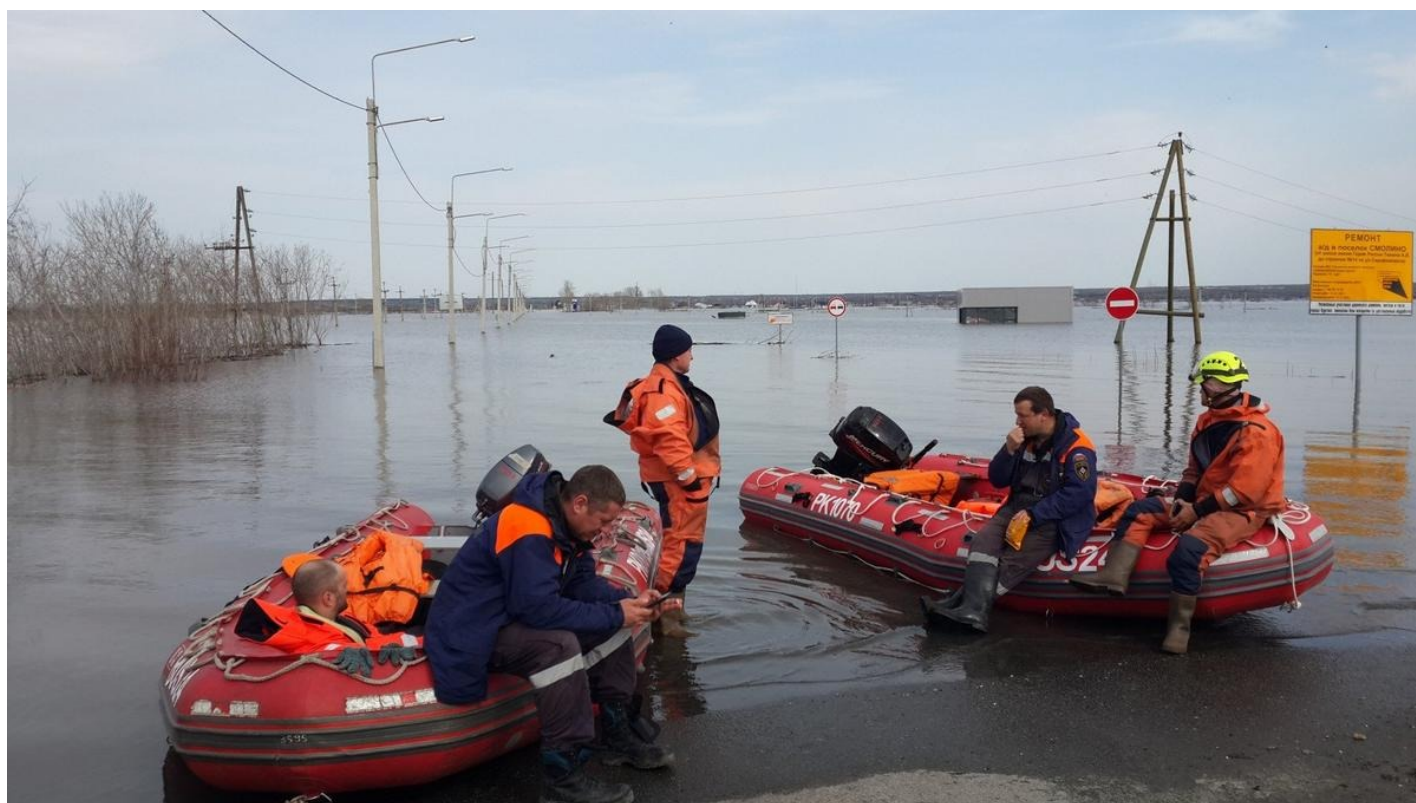
Спасатели у дороги, ведущей к затопленному поселку Смолино.

Красноярска. В другое время вахту несли екатеринбуржцы. В мареве проступает купол смолинской церкви — горит красным, как сигнальный огонь на высокой дымовой трубе.