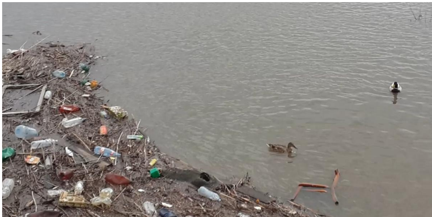
Утки изучают пловущую по Тоболу мебель.

Полицейский, караулящий проход на гребень дамбы и по мосту (все перевязано стоп-лентами), вдруг начинает сгонять всех вниз, к подножию дамбы. Оглядываюсь, причина понятна: сюда идет начальник с крупными звездами. «Да сколько ж можно! Одних сгонишь, уже другие. Не стойте тут! Вас видят — значит, можно, и другие поднимаются». Испугавшись начальственного рыка, две собаки бегут по мосту снова на правый берег, но на середине моста нерешительно останавливаются, потом ложатся. Пережидают. (Зоозащитница: «Одну собачку три раза ловили, некоторых по два раза, животные на панике».)