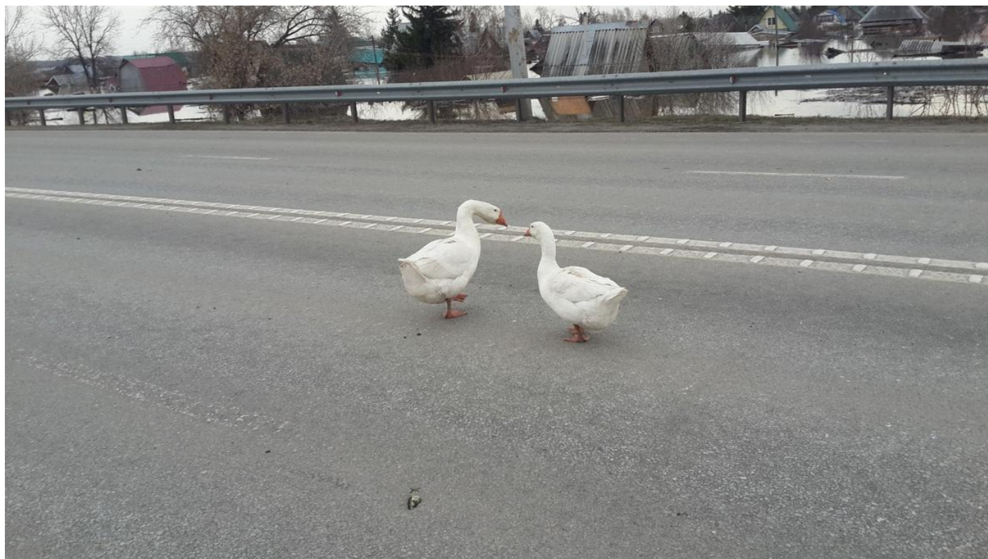
Обстановка на шоссе Тюнина.

Через километр вижу уже знакомую парочку — домашних гусей. В воду они не идут, слоняются у шоссе. Порой выходят к людям и стали уже поп-героями этого наводнения, их предлагают назвать, исходя из имени шоссе: гусака — Тю, гусыню — Нина. Птиц жалеют, полагая, что их «обнулят», «до первой бездомной собаки», но вот сейчас я их вижу далеко от мостов, в километре, наверное, от улицы Свободы, и они бодры спустя и неделю после начала вольной жизни.