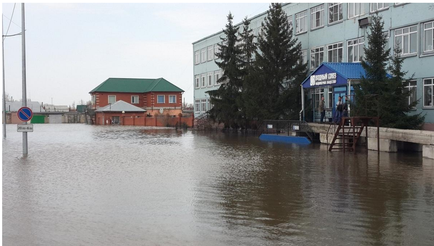
В офисе курганского водоканала недостатка в воде нет. Но очистные сооружения водопровода Арбинка работают штатно.