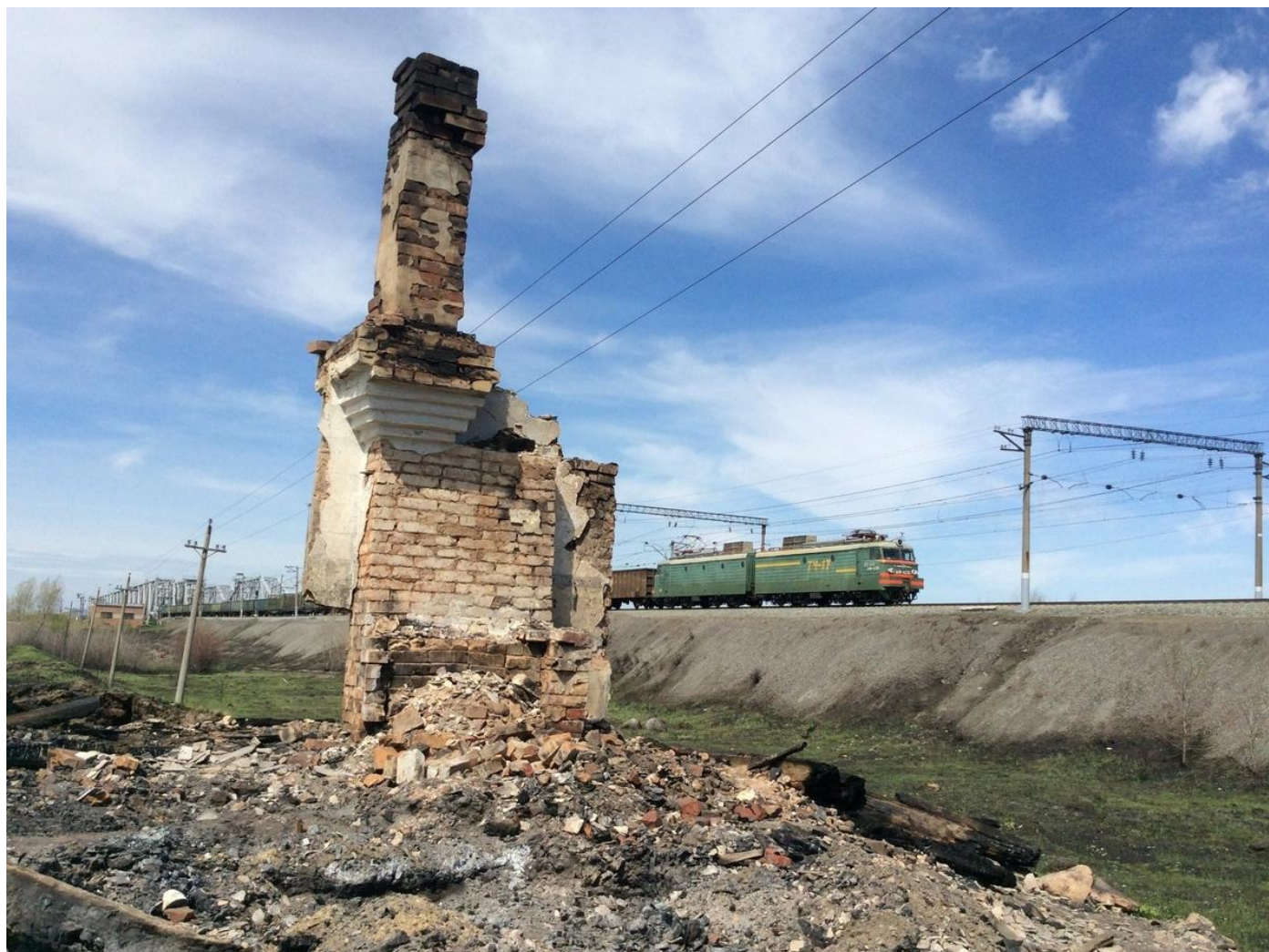
Пожары под Курганом 2019 года. У Камчихи и Смолино огонь дошел до железнодорожного моста.

— А. Т.). И вот мы едем, и я вижу этот строительный рынок внизу (в самом затопляемом месте, здесь раньше высился гаишный пост. — А. Т.), там штабеля стройматериалов были. И они вобрали в себя весь этот огонь, жар, и вся эта куча переливается всеми цветами, они один в другой переходят, не то что там красный, а желтый, оранжевый, фиолетовый, синий, очень красиво. Драгоценные камни. Я аж рот открыла.