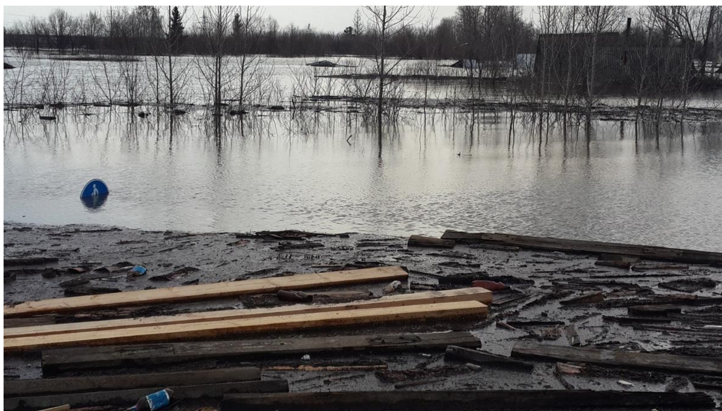
У шоссе Тюнина сейчас.

А в центре у Богоявленского собора в ту переломную ночь трудились студенты. Под музыку из колонки — песни Шамана и «Младший лейтенант» Аллегровой. Днем 19-го уровень реки впервые начал падать, пусть на пару сантиметров, до 1013. Правда, 20-го вода снова начала прибывать, причиной назвали обратный сток с поймы в верховьях.