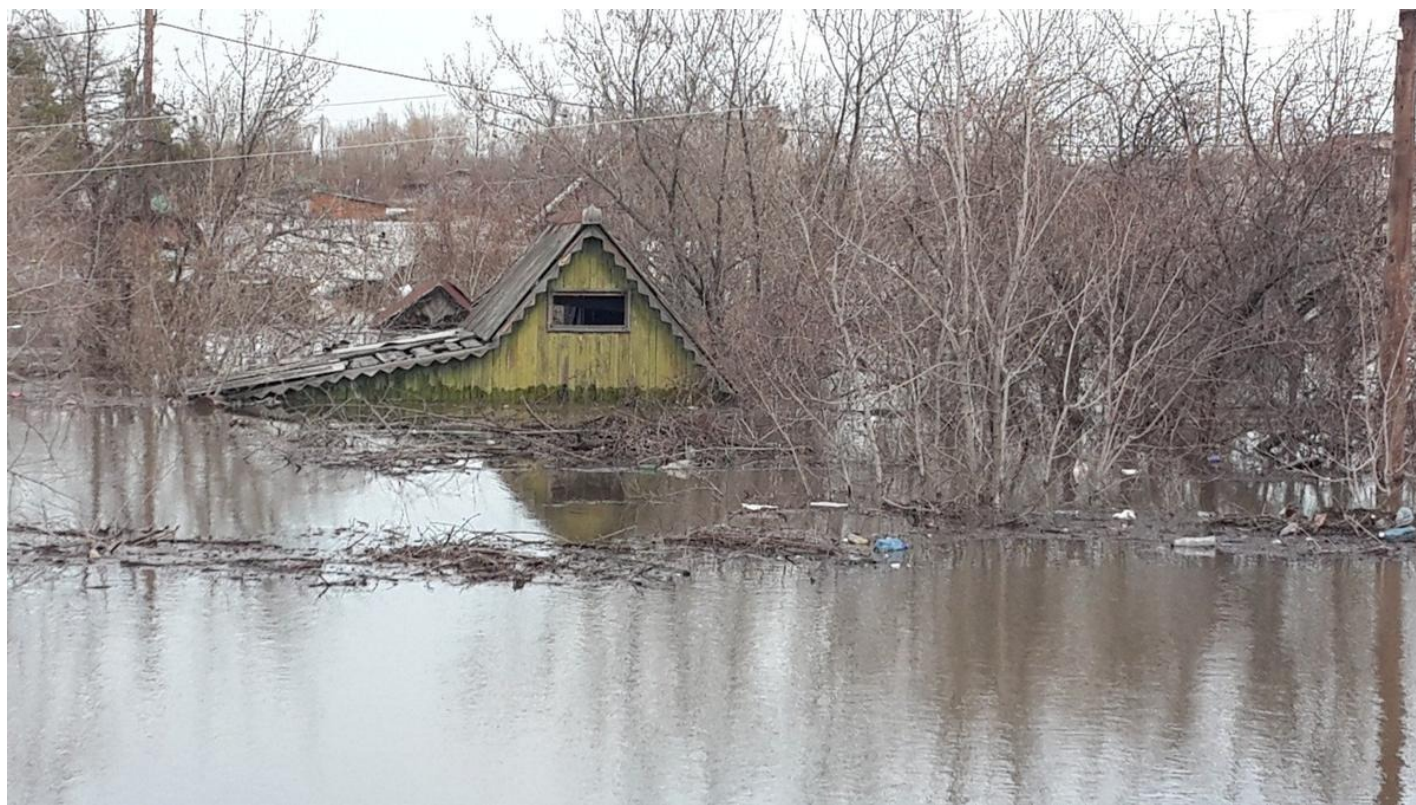
Дачи, плавающие у шоссе Тюнина.

Над затопленным на многие километры пространством раздаются крики петуха. Он истерит непонятно где — над поднявшейся и уже почти выровнявшейся гладью воды звуки летят издалека.