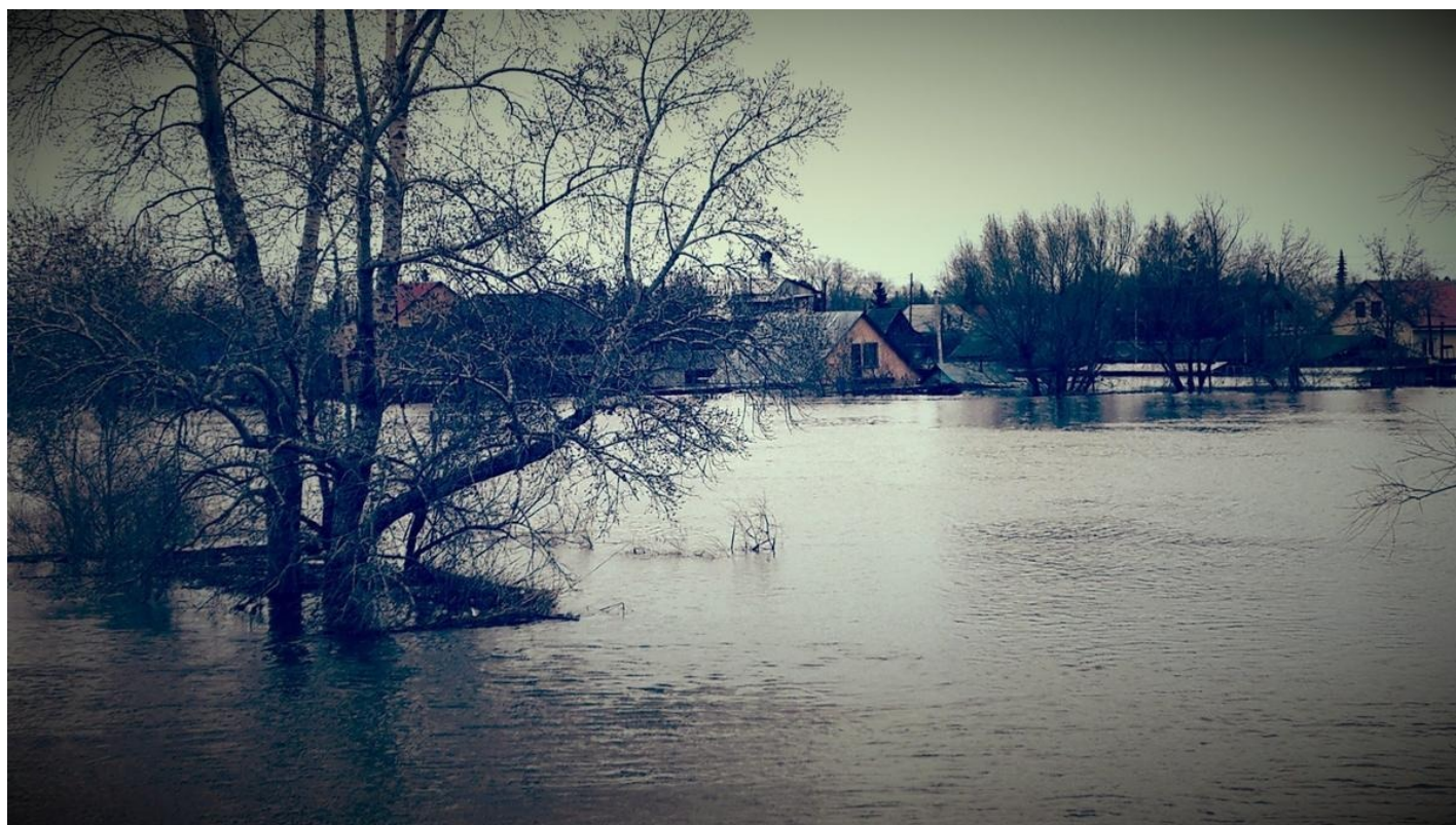
Вид на правый берег с центральной набережной.

Итак, пока Курган отходит от пика наводнения. Или, как говорят ныне губернаторы, «паводковых процессов».