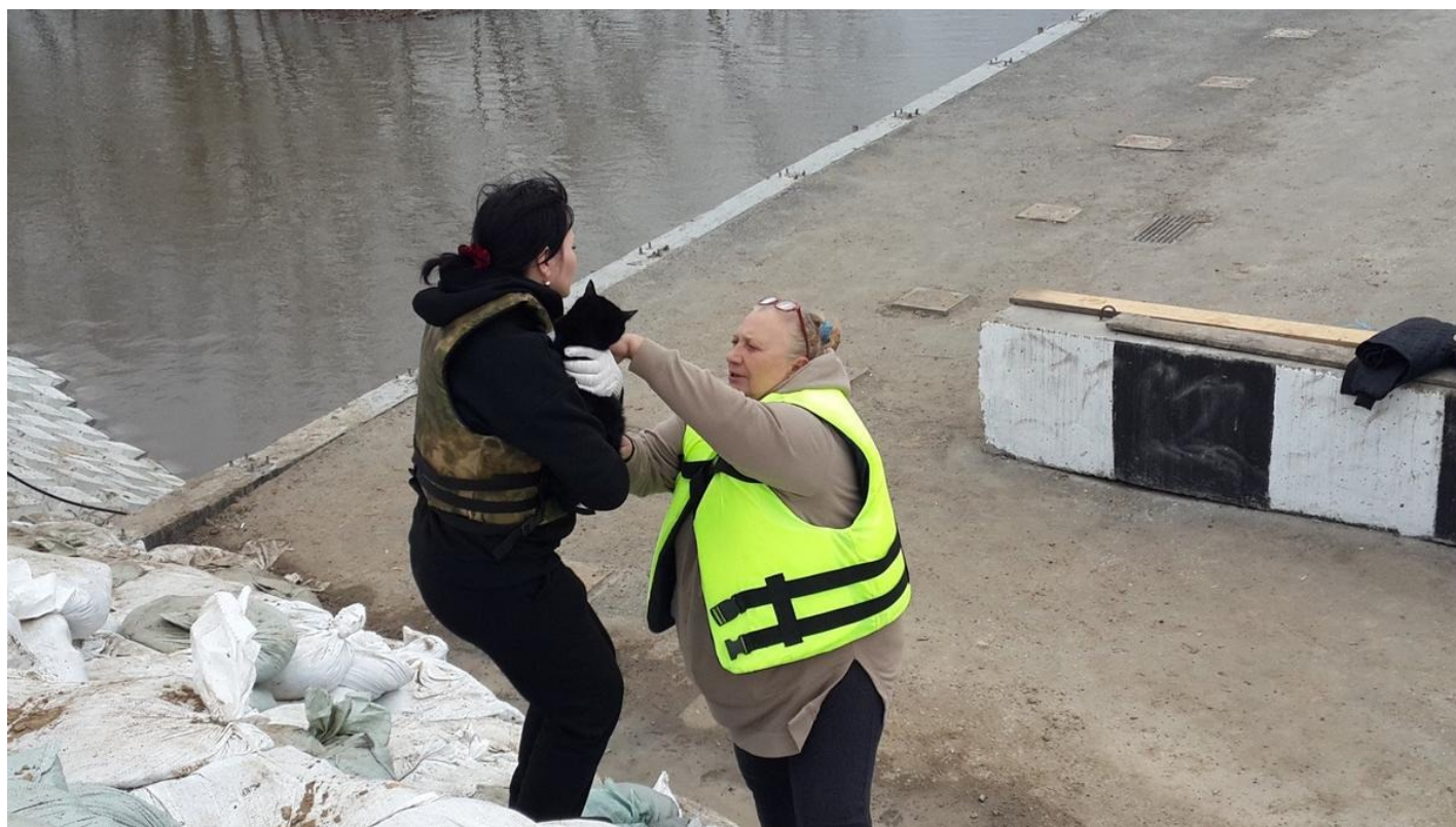
Кошка, спасенная с левого берега. В ожидании переноски.

Сейчас вижу только, как спасают с берега правого собак и кошек. Их вывозят на лодках. Затем переносят или переводят по мосту сюда, на берег левый. Сушат, кормят, сажают в переноску и везут на передержку. В их ПВР (пункты временного размещения): выстроены целые поля индивидуальных будок, «будок гласности». Собаки там заливаются лаем с перерывом на лакание воды (у каждой своя миска) — «он-лайн-конференция».