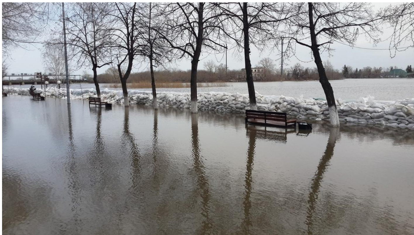
Затоплен второй ярус набережной, центр Кургана.

последствий ЧС. А значит, это решение нереализуемо.