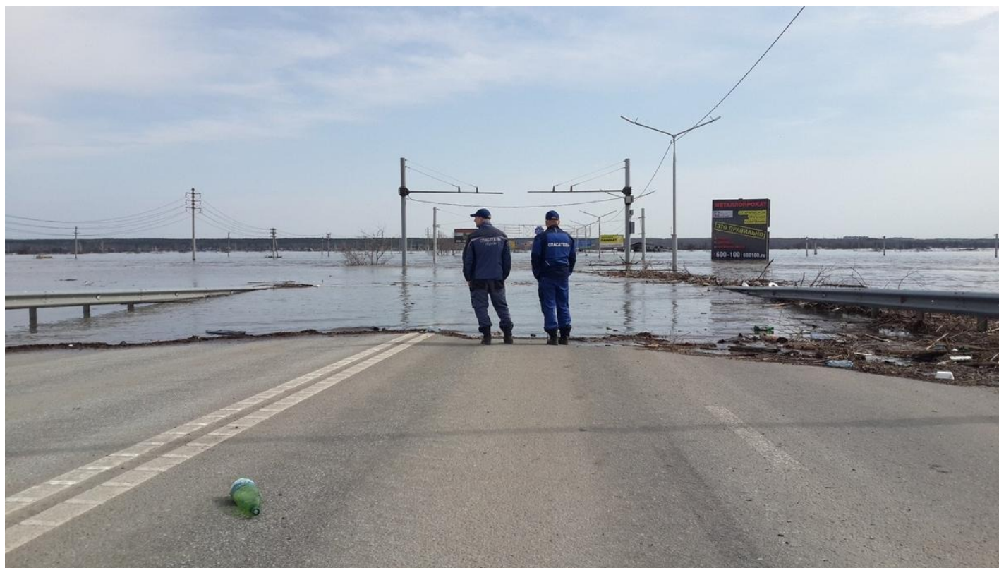
Курган. Перелив через шоссе Тюнина.

Южные пригороды Кургана и Кетовский район точно спланированы под масштабные бедствия, наводнения и пожары. Страшно горели здесь в мае 2004 года, в 2008-м, 2018-м и 2019-м, повторившем 2004-й и маршрутом огня, и сопутствующими обстоятельствами — жарой, ветром. О прошлогодних событиях вот ровно тут, где я стою, мне вечером этого дня расскажет Светлана.