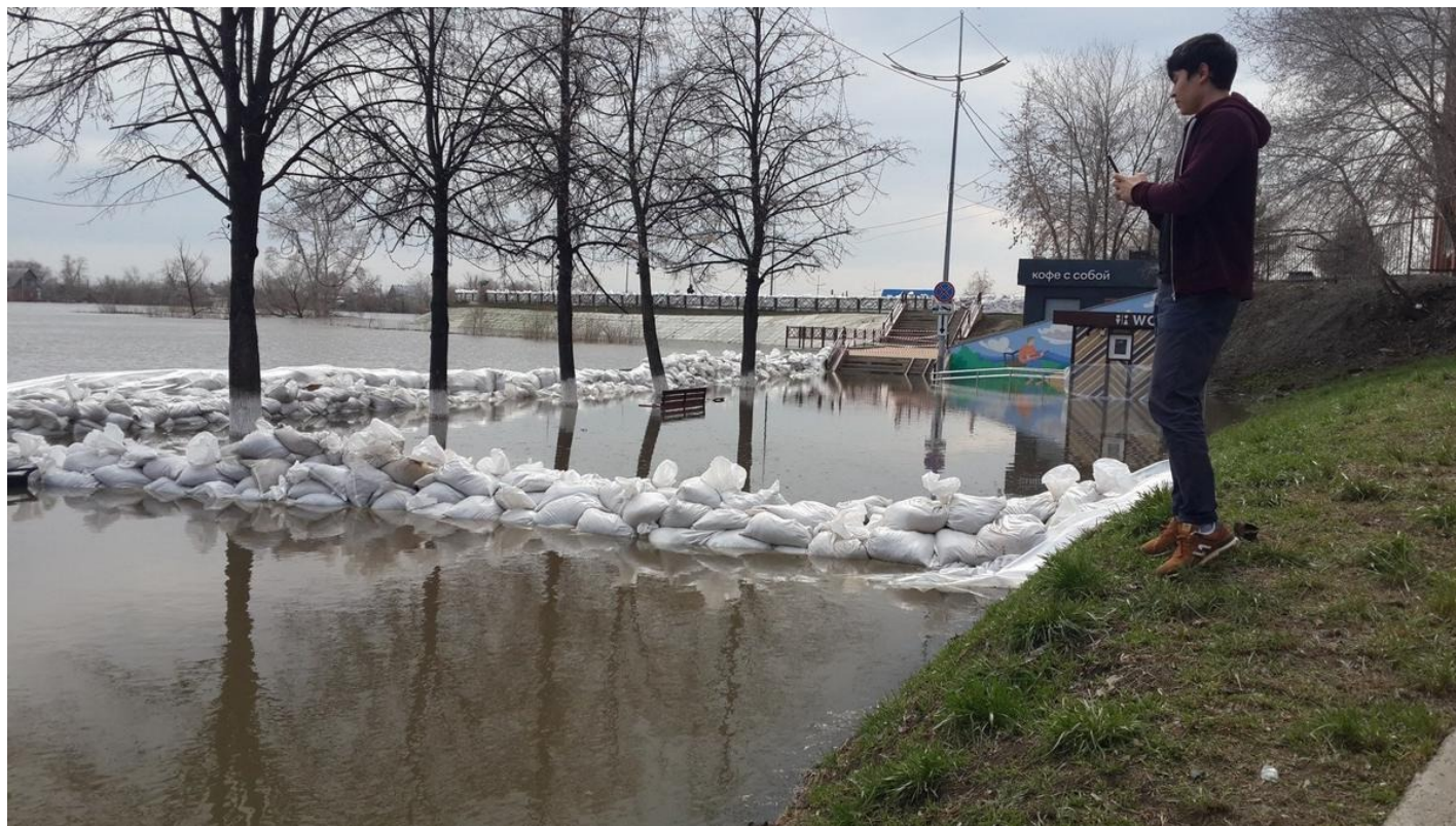
Затоплен второй ярус набережной, центр Кургана.