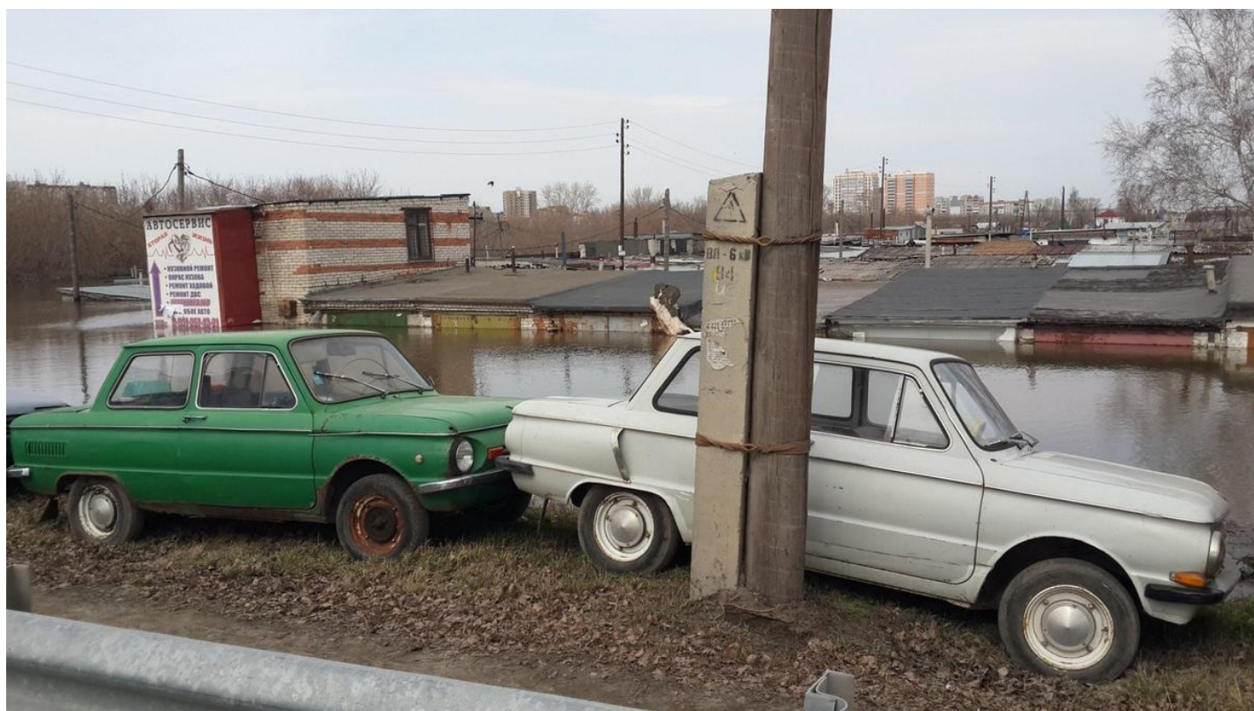
Улица Свободы. Запорожцы выкатили из гаражей к шоссе, чтобы те не промокли и не уплыли.

Сегодня энергетики приехали отключать СНТ от электричества. Нам, говорят, всю ночь ездить, мы сами не понимаем, зачем нужно отключать заранее.