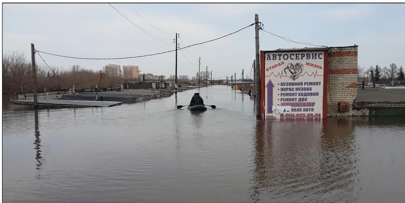
Правобережные жители плывут домой через гаражный массив, затопленный по крыши.

посидите. Многие садоводства не топило никогда или вода совсем чуть-чуть заходила, так ведь надо людей без электричества оставить. У нас в СНТ живет 70 семей, завтра отключают электричество, непонятно как должны кормить детей и тепло в дом подавать.