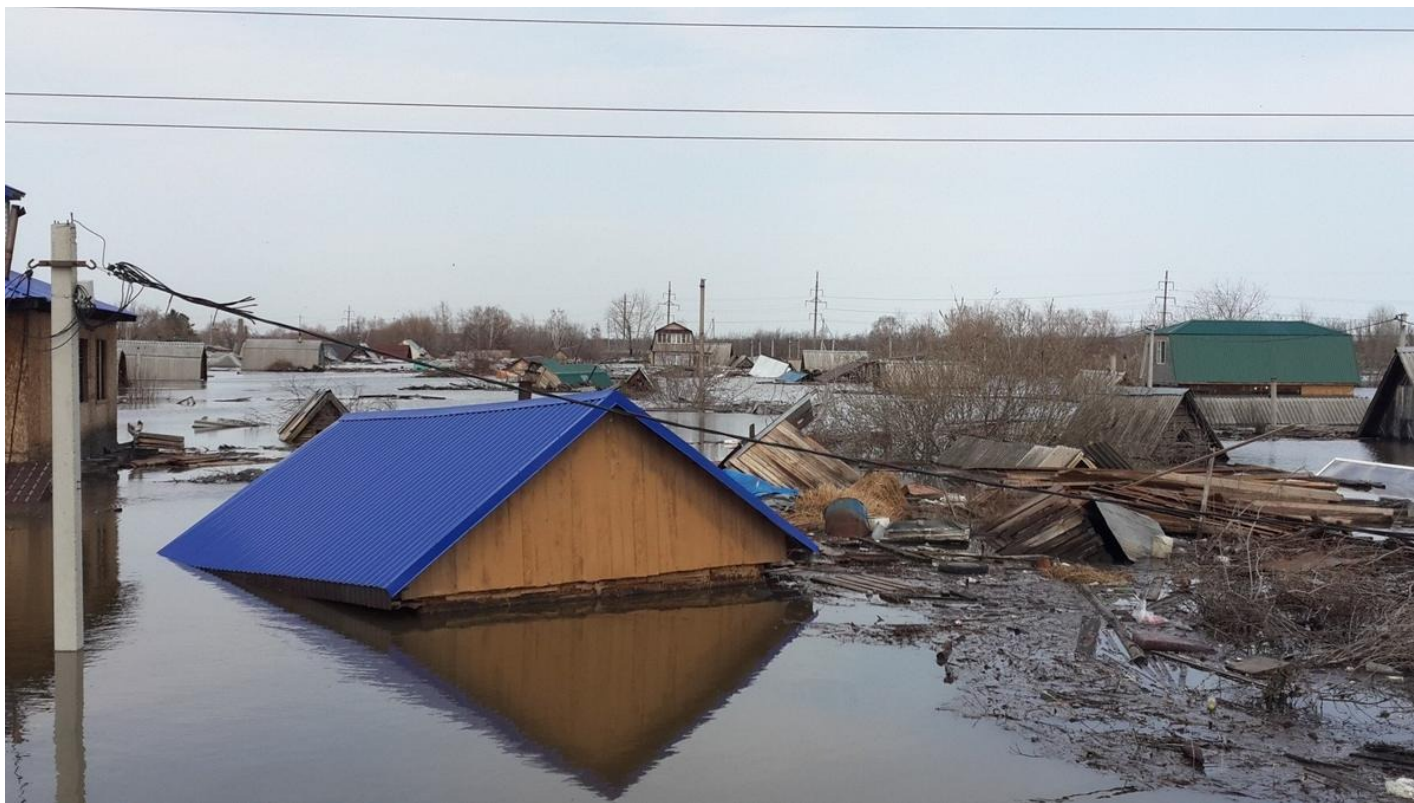
Дачи, плавающие у шоссе Тюнина.

Десятилетиями длится, вспучиваясь после каждого крупного наводнения, полемика: нужно ли в приказном порядке отселить людей из периодически затапливаемых — что бы мы ни делали — участков пойм. Орск в Оренбуржье, Тулун в Прибайкалье, Бийск на Алтае и т.д. Это действительно вечный разговор. Во-первых, людям вообще опасно жить на планете: в горах — лавины, на равнинах — ураганы, в глухом лесу — пожары. Во-вторых, народ боится этих бедствий (уж наводнений — точно) куда меньше, чем самой власти и всех ее мер в защиту народа от этих бедствий. В-третьих, народ, как и его власть, верят (не все, конечно, но) в план Даллеса, в жидомасонский заговор, а, например, в коронавирус или в Бога — нет. Не верят и в глобальные изменения климата, дающие резкое учащение в наших широтах таких катаклизмов. Если бы верили, пересмотрели хотя бы весь свод гидрологических и гидротехнических правил. Ну и главное: