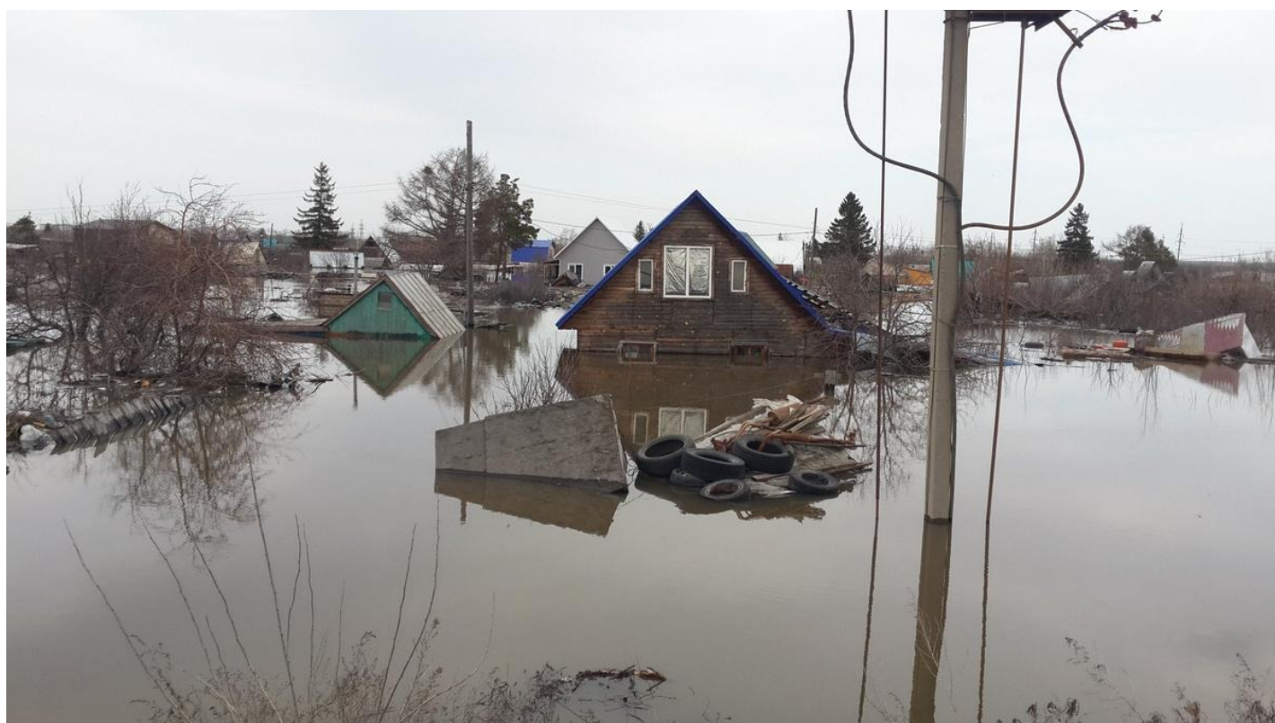
Дачи, плавающие у шоссе Тюнина.

На другой обочине вижу билборд еще одного предприятия ВПК: наладчиков станков с ПУ, зарплата от 120 до 200 тыс., ищет НПО «Курганприбор».