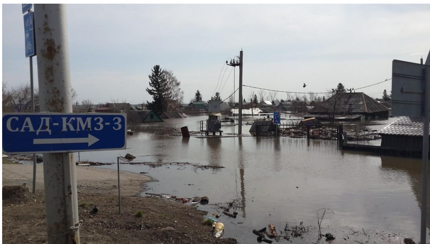
Сады Курганского машзавода — главного предприятия ВПК Зауралья.

Еще одним героем наводнения и многочисленных видео становится жутковатого вида трехногая белая собака. Но она в центре Кургана. Ее там видят на разных улицах, в разных дворах: несмотря на потерю ноги, передвигается динамично. Прославилась она своим воем — артистично и внушительно подвывает сиренам, отпевающим город. Всякий раз, сколько бы те ни звучали. («Бэрримор, кто это ночью выл на болотах?» — «Простите, сэр, накопилось».)