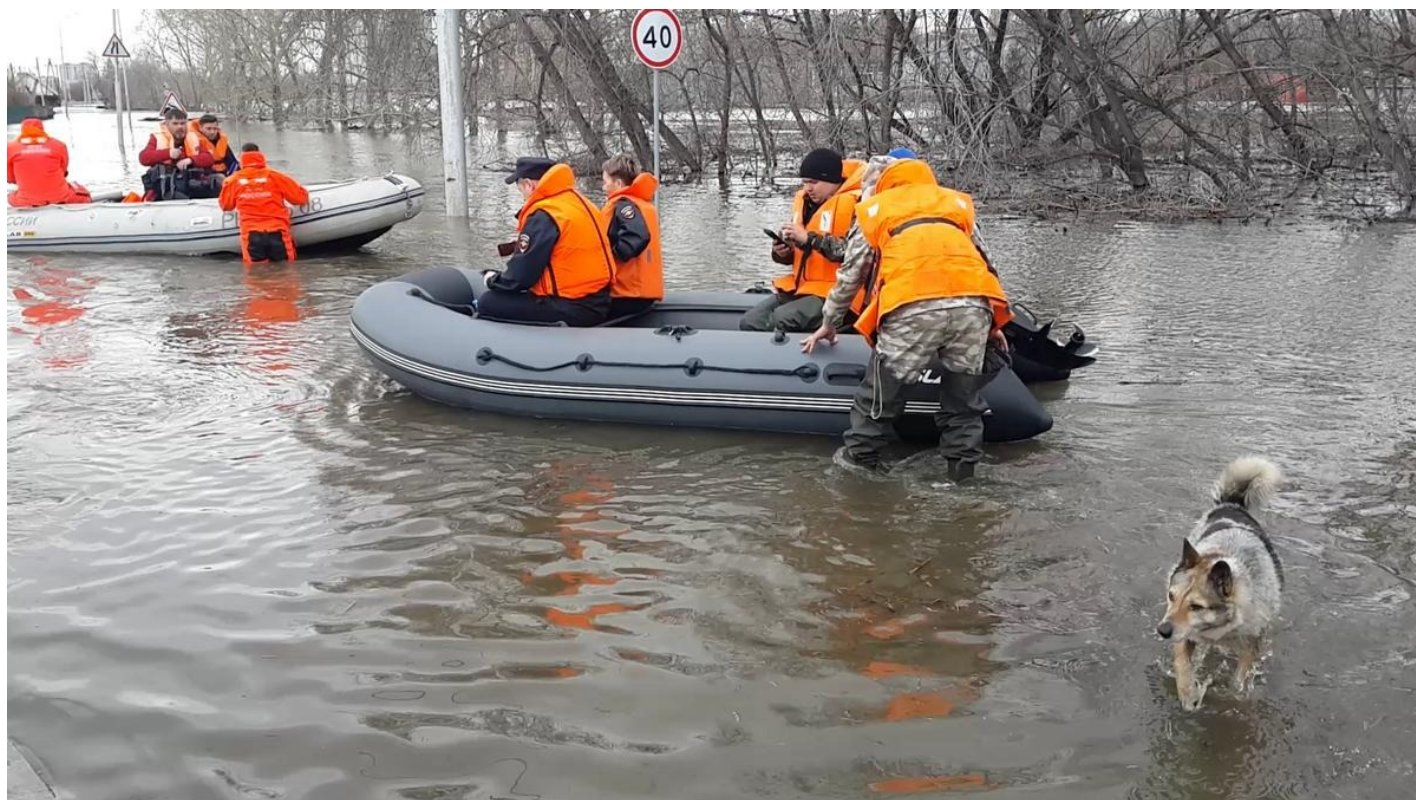
Собаки далеко от спасателей не отходят.