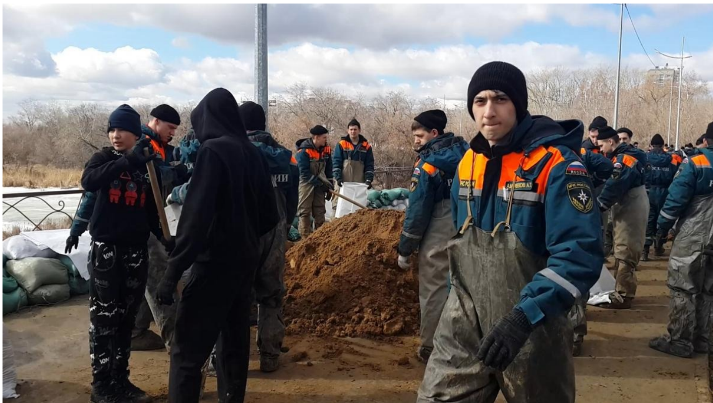
Дети тоже укрепляли дамбу.