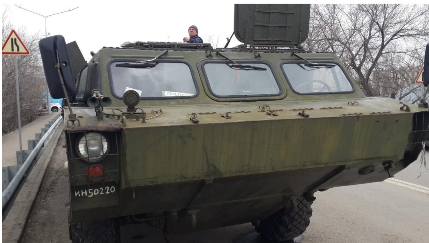
На шоссе Тюнина для преодоления завалов и дачных заборов готова техника повышенной проходимости.

Дальше по шоссе мир становится все более тихим, ботаническим, виды на него — рай для мизантропов и социопатов. Нет никого, дачи затоплены под крышу, некоторые