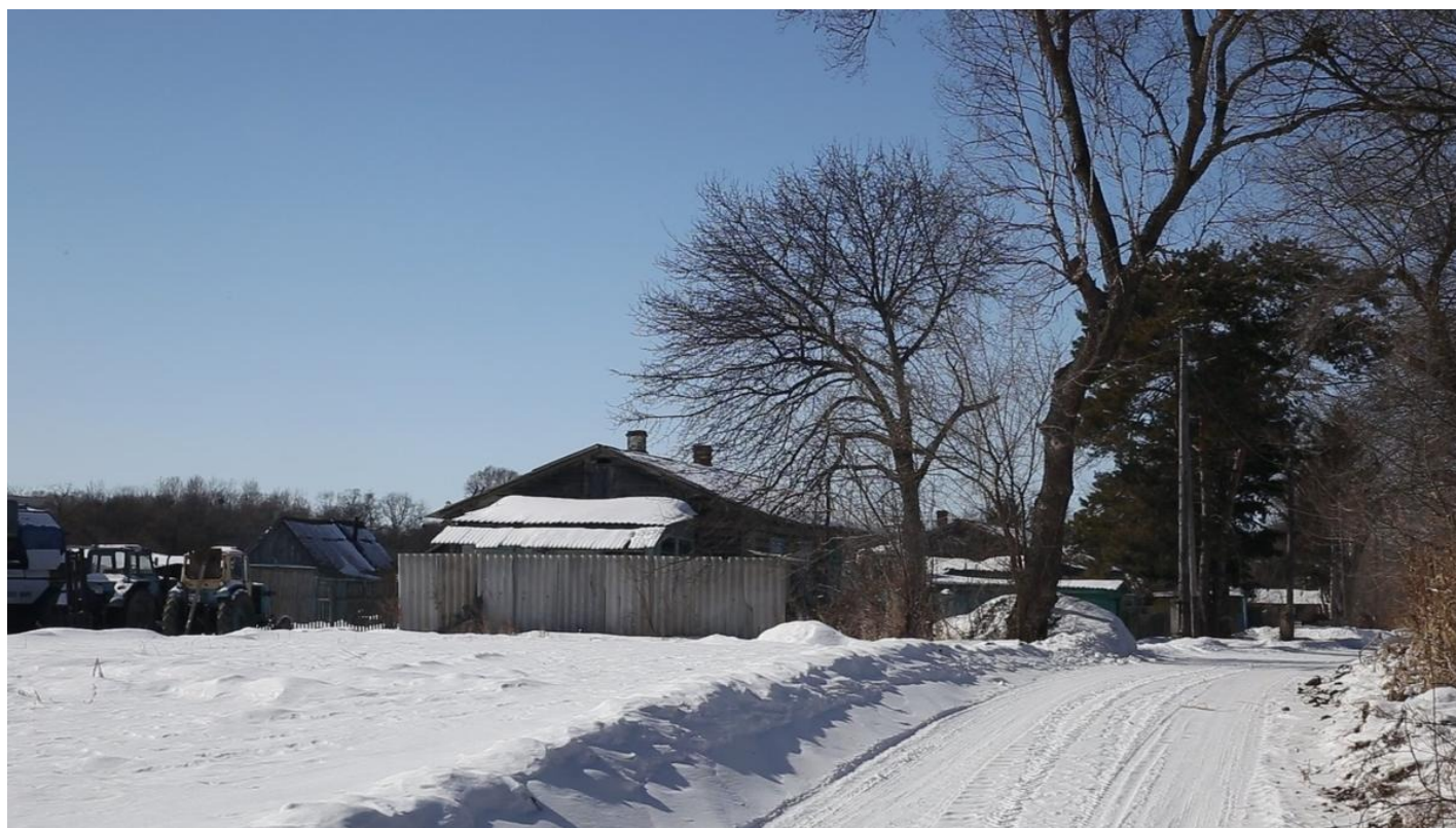
Село Черняево.