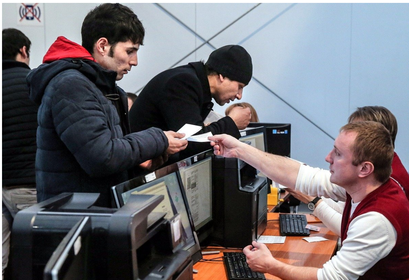
Иностранцы граждане на территории многофункционального миграционного центра, где можно оформить или продлить патент на работу.

зарплаты] человека, который у него отработал год, потому что армия желающих не иссякала. Сейчас она стала меньше, к слову.