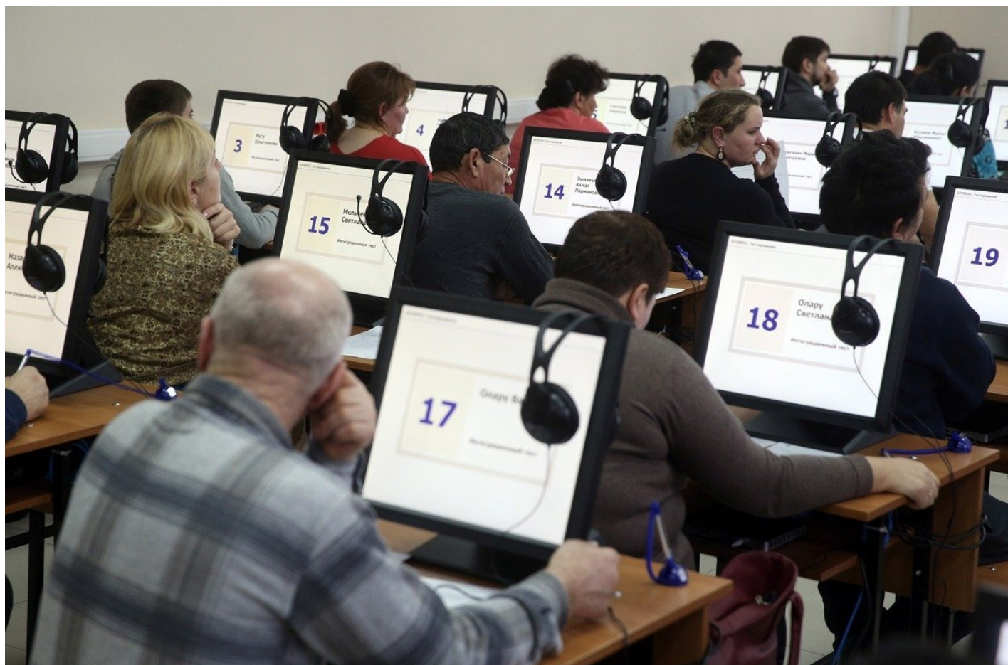
Электронное тестирование иностранных граждан на знание русского языка в Едином миграционном центре Московской области.

— Мы ходили по вашему офису и увидели, что у вас работают юристы, консультанты. Есть еще психологи, врач. Получается, к вам приходят люди не только за документами, но и когда у них нет еды, одежды и когда люди просто не понимают, что им делать?