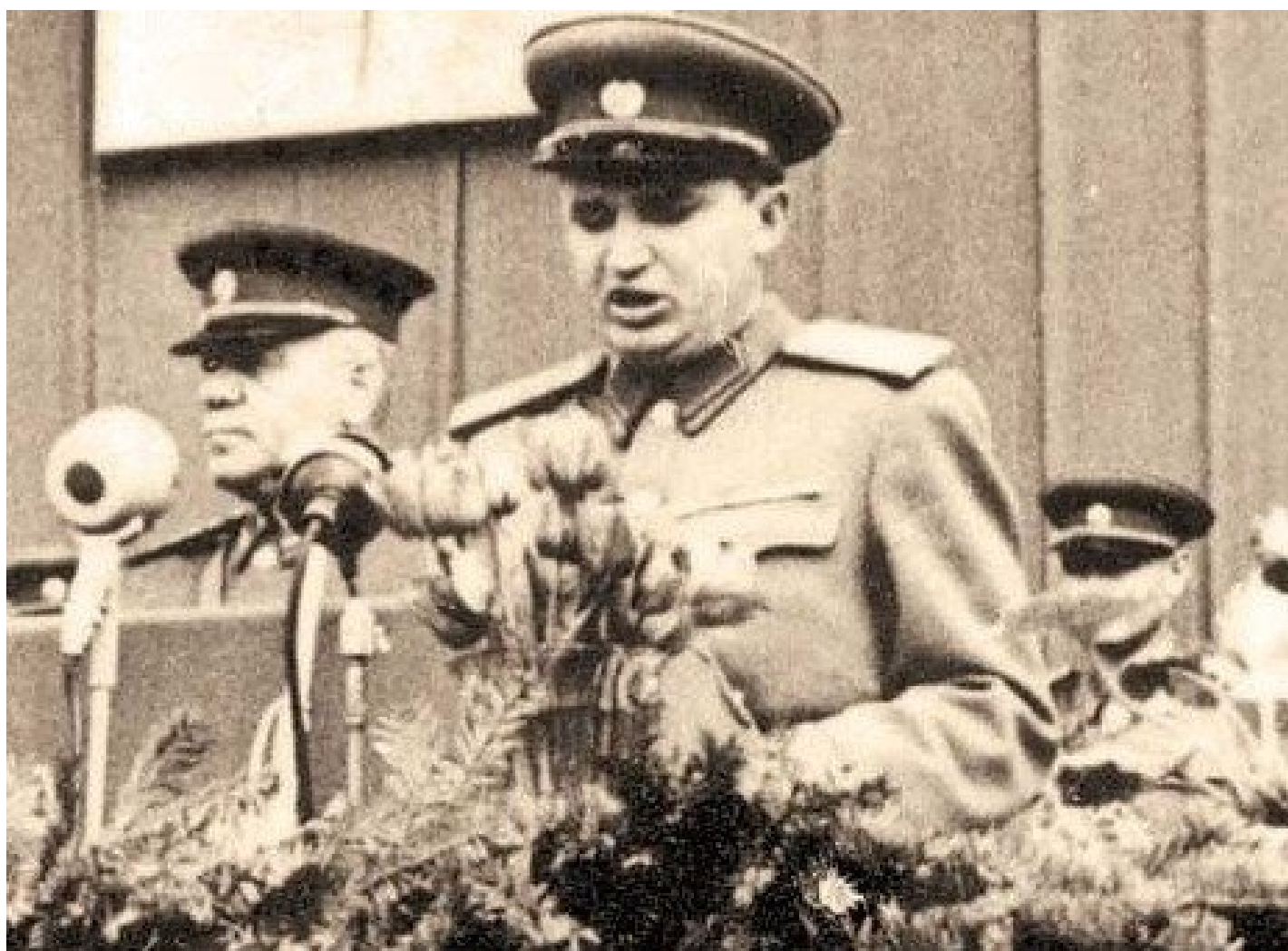
Чаушеску в военной форме. Фото 1954 года

Чаушеску, недавно получивший пост заместителя министра сельского хозяйства, отправился подавлять восстание крестьян в провинции Вранча: по словам очевидцев, он взял в руки пулемет и лично расстреливал недовольных крестьян, которые выступили против коллективизации.