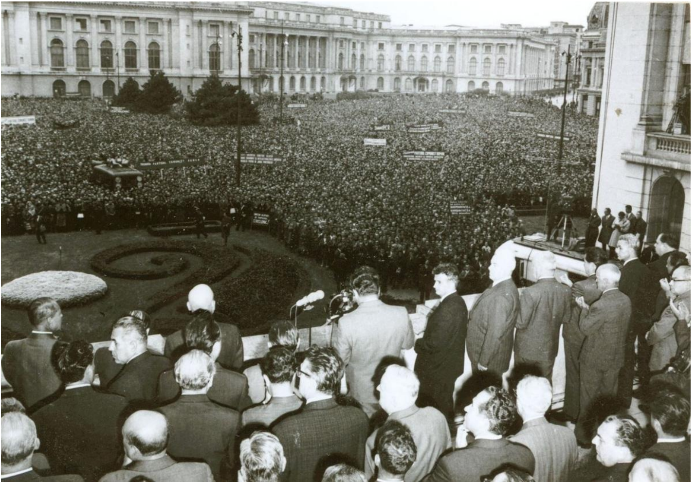
Чаушеску на митинге против ввода советских войск в Чехословакию. 1968 год

В Москве слова румынского лидера встретили без энтузиазма, зато Запад был в восторге, ведь Варшавский договор открыто дал трещину. Впрочем, объяснял Пачепа, в СССР довольно быстро «простили» «диссидентство» Чаушеску, убедившись, что режим его личной диктатуры никак не может служить примером для граждан СССР — в отличие от «социализма с человеческим лицом», который пытались построить в Чехословакии.