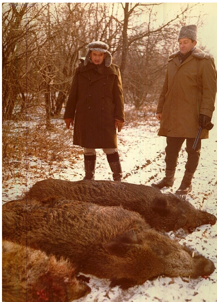
Чаушеску охотится на кабанов. Фото 1976 года

Безусловно, «парламент» остался такой же марионеточной структурой, как и прежде. Далее Чаушеску публично обратился к Коммунистической партии с призывом сократить свое влияние на управление страной и ее экономику. Затем Чаушеску поэтапно инсценировал децентрализацию экономики и введение принципа выдвижения кандидатов на местных выборах по двум спискам, а также объявил кампанию по борьбе с коррупцией и пьянством.