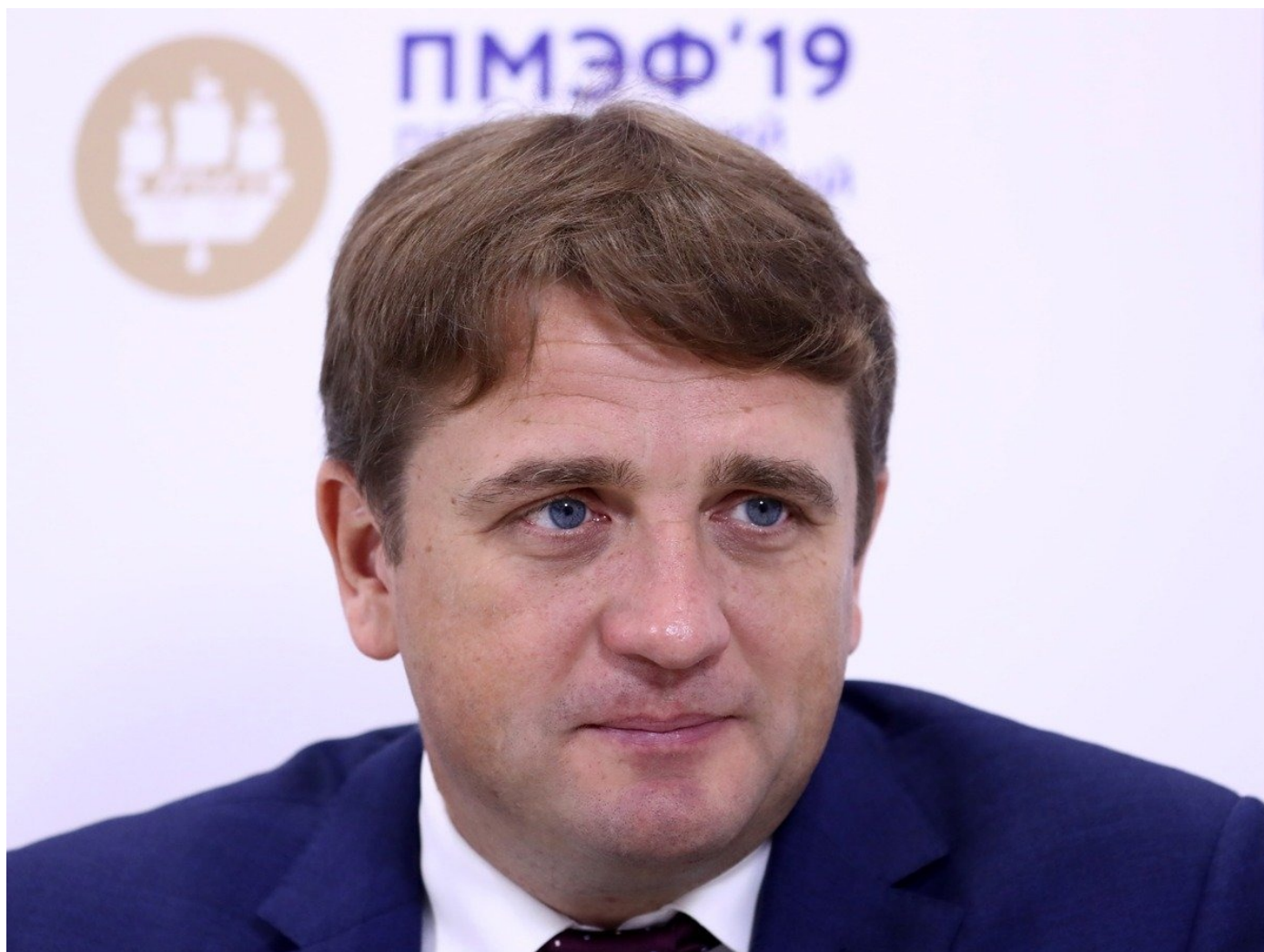
Глава Росрыболовства Илья Шестаков.

Шестаков, конечно, несколько лукавит, когда говорит, что виноваты лишь ограничения и санкции. Ведь только ленивый не жаловался на то, что верфи к таким объемам заказов не ГОТОВЫ.