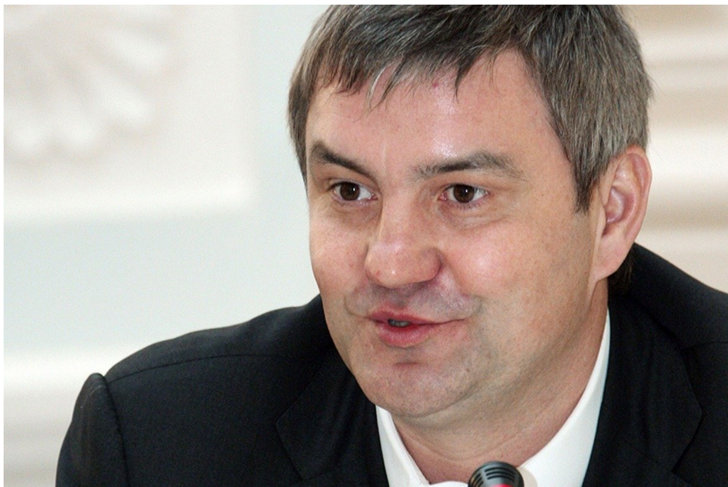
Дмитрий Дремлюга. Фото: РБК