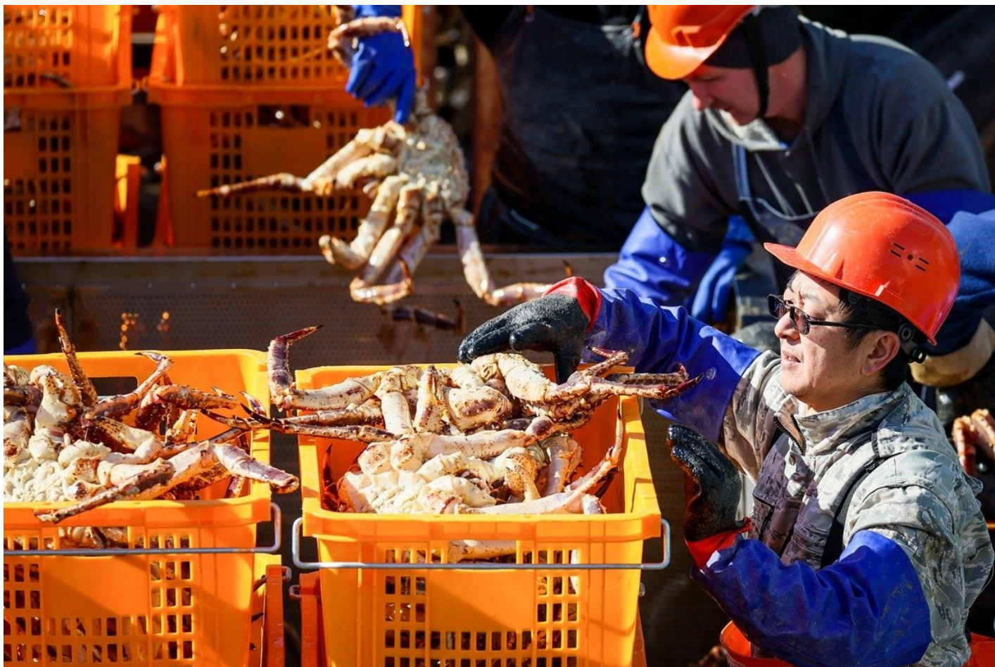
Экипаж во время разгрузки живого камчатского краба из трюмов краболова СРТ «Алсей» группы компаний «Антей».