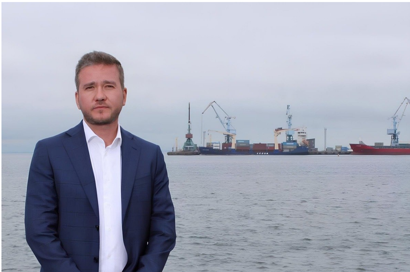
Сахалинский депутат Михаил Черевик.