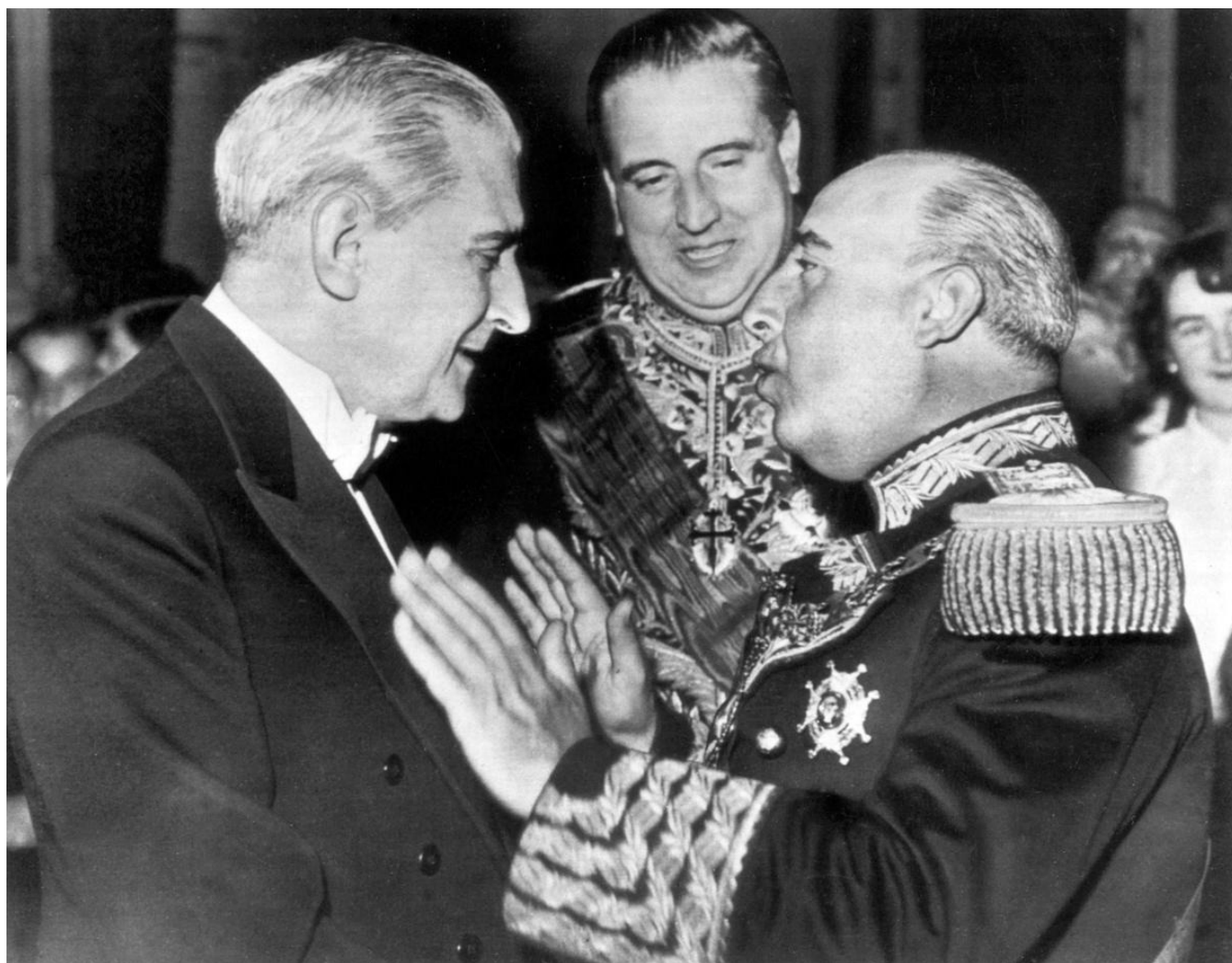
Франсиско Франко (справа) во время беседы с Антониу Салазаром.

Считается, что в 1926–1974 гг. секретная полиция Португалии отправила в тюрьмы 26 375 человек, но треть из них — в период с 1935 по 1939 год. При этом массового террора — как у Франко в Испании, португальский диктатор не допустил — он предпочитал точечные репрессии против самых активных оппозиционеров и тех, кого решили сделать жертвами показательных процессов. Но истязания арестованных были обычным делом, а за теми противниками Салазара, которые успели уехать из страны, агенты ПИДЕ гонялись по всей Европе. Впрочем,