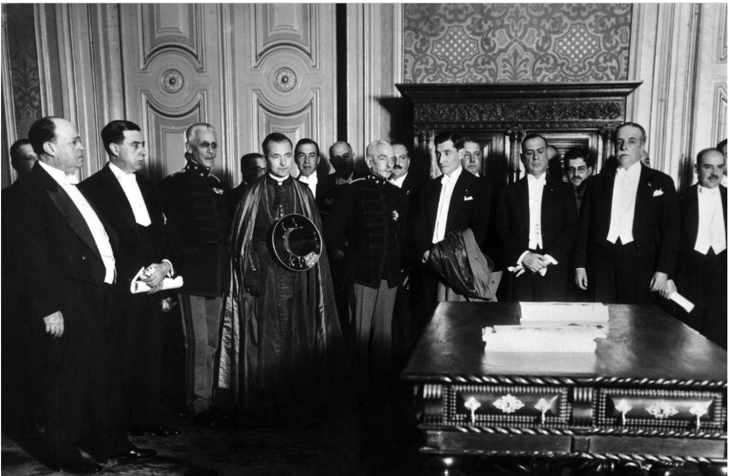
Антониу Салазар (в центре, с пальто в руке) в окружении своих соратников, 1 января 1932 года.

Правда, поддержка энтузиазма шпионов и пропагандистов требовала немало средств, но деньги на это у Салазара нашлись. Он не был видным теоретиком экономики, но в финансовой механике разбирался профессионально. Кроме того, ему крупно повезло.