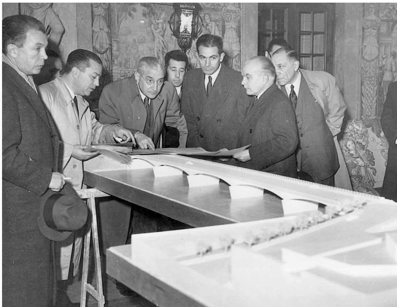
Салазар осматривает макет моста в Коимбре.

Для продвижения новой идеологии нужна была политическая база — и Салазар сформировал «Национальный союз», официально считавшийся «организацией единства всех португальцев». Фактически же он объединял бенефициаров политики Салазара — чиновников, военных, и предпринимателей, получающих правительственные заказы и поэтому готовых поддержать любые начинания министра. При этом «Национальный союз» никогда не был массовой организацией — это был именно союз бюрократов-бизнесменов