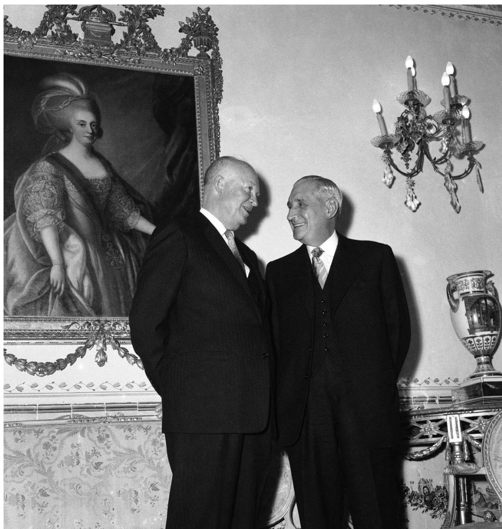
Дуайт Эйзенхауэр и Саласар.

Но Салазар замахнулся на то, чтобы вернуть в лоно Португалии ее бывшую колонию Бразилию. Диктатору удалось договориться с бразильским президентом Жоао Кафе Фильо, и в 1955 году был подписан договор о дружбе. Предполагалось, что Бразилия сможет развивать бизнес в португальских колониях, а Португалия получит доступ к ресурсам южноамериканского гиганта.