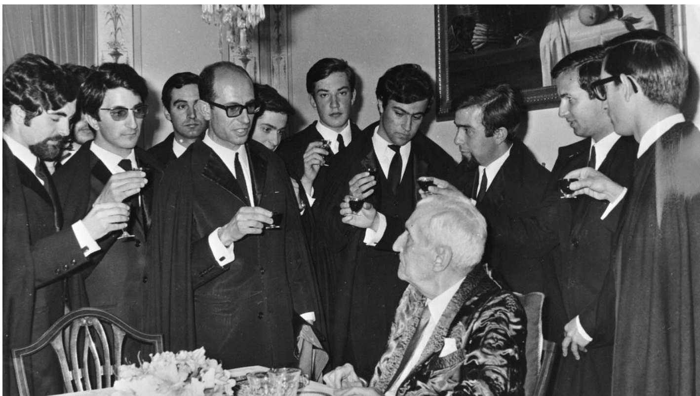
Антониу ди Салазар (в центре). Архивное фото

Звезда и смерть Антониу ди Салазара, который так и не узнал, что уже давно не правит Португалией