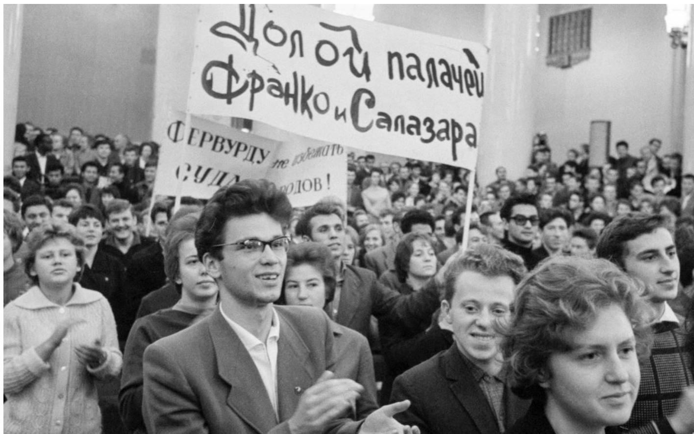
Всемирный форум солидарности молодежи и студентов в борьбе за национальную независимость, освобождение и мир.