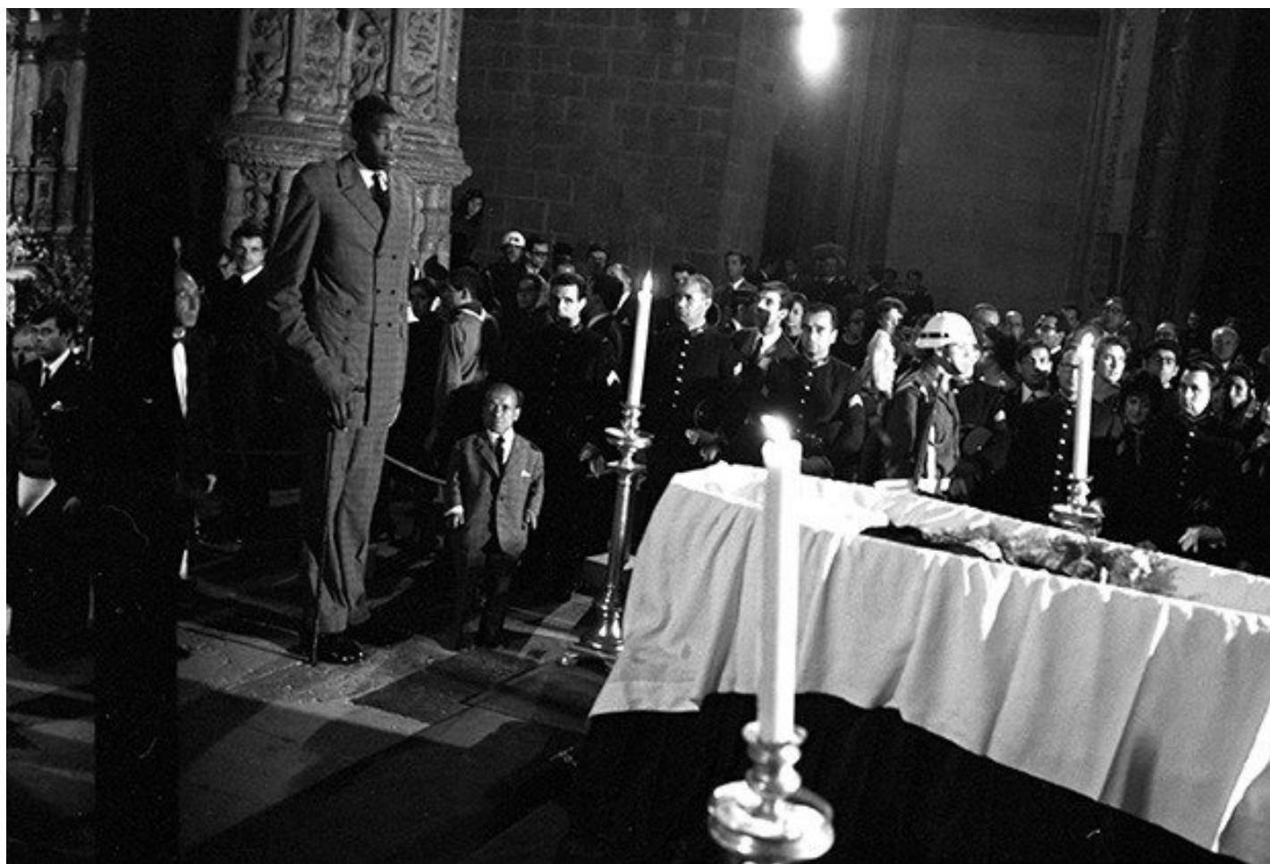
Похороны Антониу Салазара в монастыре Жеронимуш, Белен, предместье Лиссабона, 1970 год. Архивное фото

Преемники Салазара попытались сохранить выстроенную им систему, но оказалось, что инструменты персоналистской диктатуры «без диктатора» не работают. В апреле 1974 года военные вышли на улицы Лиссабона, чтобы отстранить от власти Марселу Каэтану, политического наследника Салазара. Жители Лиссабона встречали солдат цветами. Сопротивление путчистам оказали только агенты ПИДЕ, которые, впрочем, сражались не за правительство, а за себя — как только армия пообещала, что не позволит народу линчевать жандармов, сотрудники охраны сложили оружие. Эпоха последнего диктатора Европы завершилась.