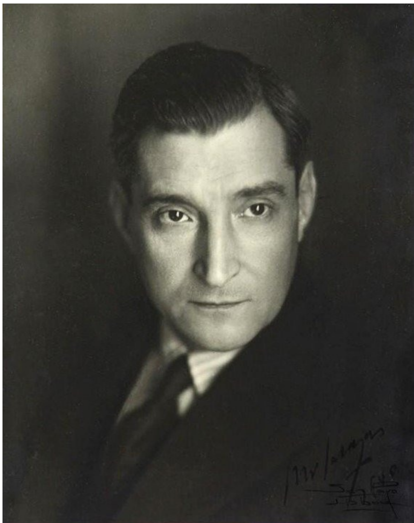
Антониу ди Салазар.

Здравый смысл подталкивает задать вопрос: а зачем такому человеку вообще становится диктатором? Чтобы ответить на этот вопрос, надо понять, что за силы привели Салазара к власти.