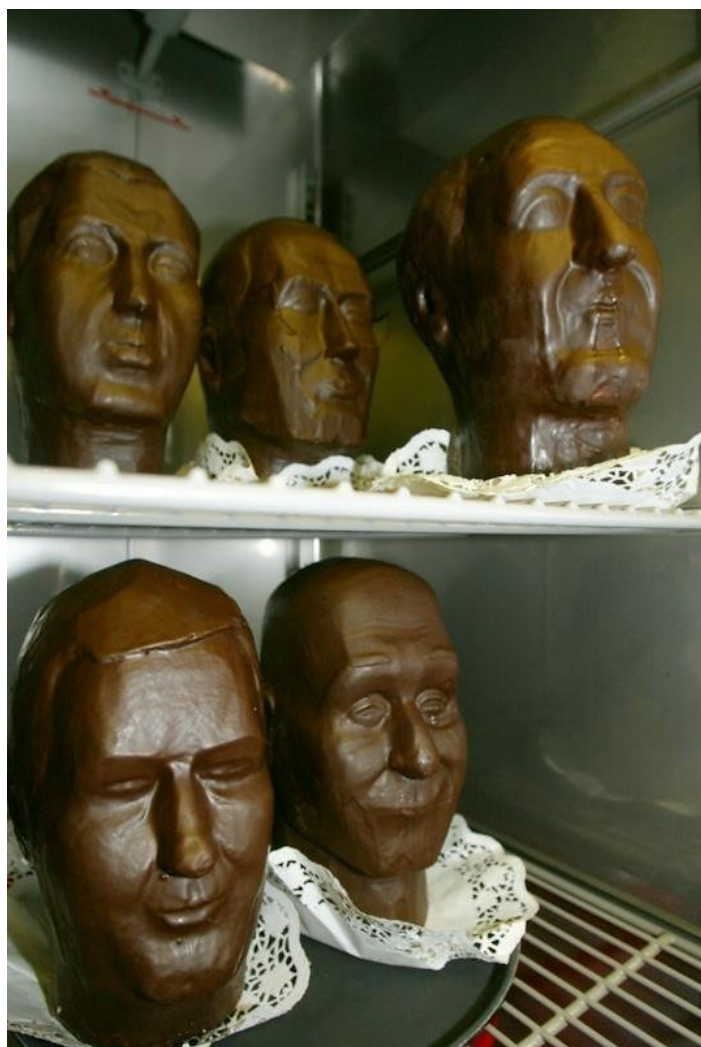
Выставка шоколадных бюстов российских олигархов «Сладенькие наши». В экспозиции — бюсты М.Ходорковского, М.Фридмана, В.Потанина, Р.Абрамовича, Б.Березовского, О.Дерипаски, А.Чубайса.

«Человек, получивший большие деньги, обычно меняется. Человек получивший власть — меняется всегда! ...и не в лучшую сторону».