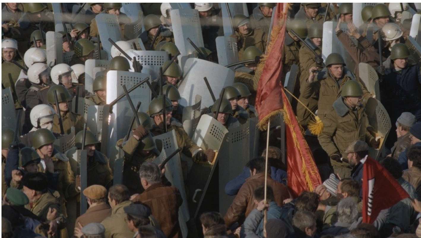
Москва. 1993 год.

Читатели «Новой» — о фильме «Предатели», статье Владимира Пастухова*, «проклятых 90-х» и сегодняшних вызовах