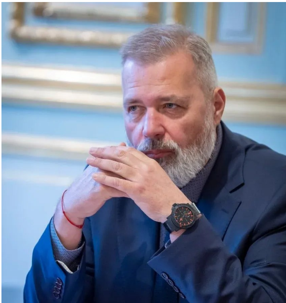
Дмитрий Муратов.