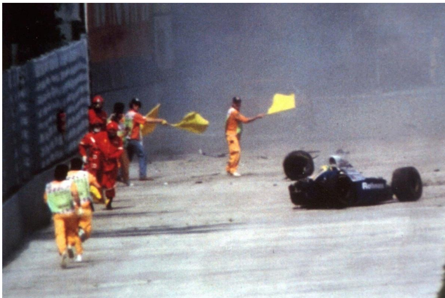
1 мая 1994 года. Авария во время гонок Формулы 1 в Сан-Марино, в результате которой погиб Айртон Сenna.

А у Сенны шансов на продолжение уже не было. Расколовшаяся от удара подвеска проткнула шлем в области визора, тогда как оторвавшееся правое переднее колесо угодило в голову пилоту и сломало основание черепа. На теле же Айртонна не обнаружили ни одного синяка, а в кармане его комбинезона нашли австрийский флаг, который бразилец хотел развернуть в память о погибшем Ратценбергере после своей победы. Уже позже появилась информация, что Сenna перенес две остановки сердца и врачи удерживали его жизнь до тех пор, пока с ним, «искусственно» дышащим, не простятся родные... К сожалению, проститься успели не все.