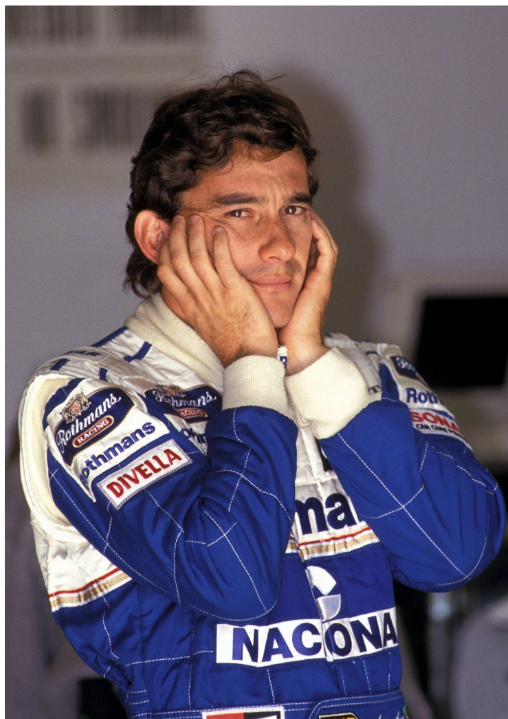
Айртон Сенна.

раз за разом залезать в «тачку» и заводить двигатель.