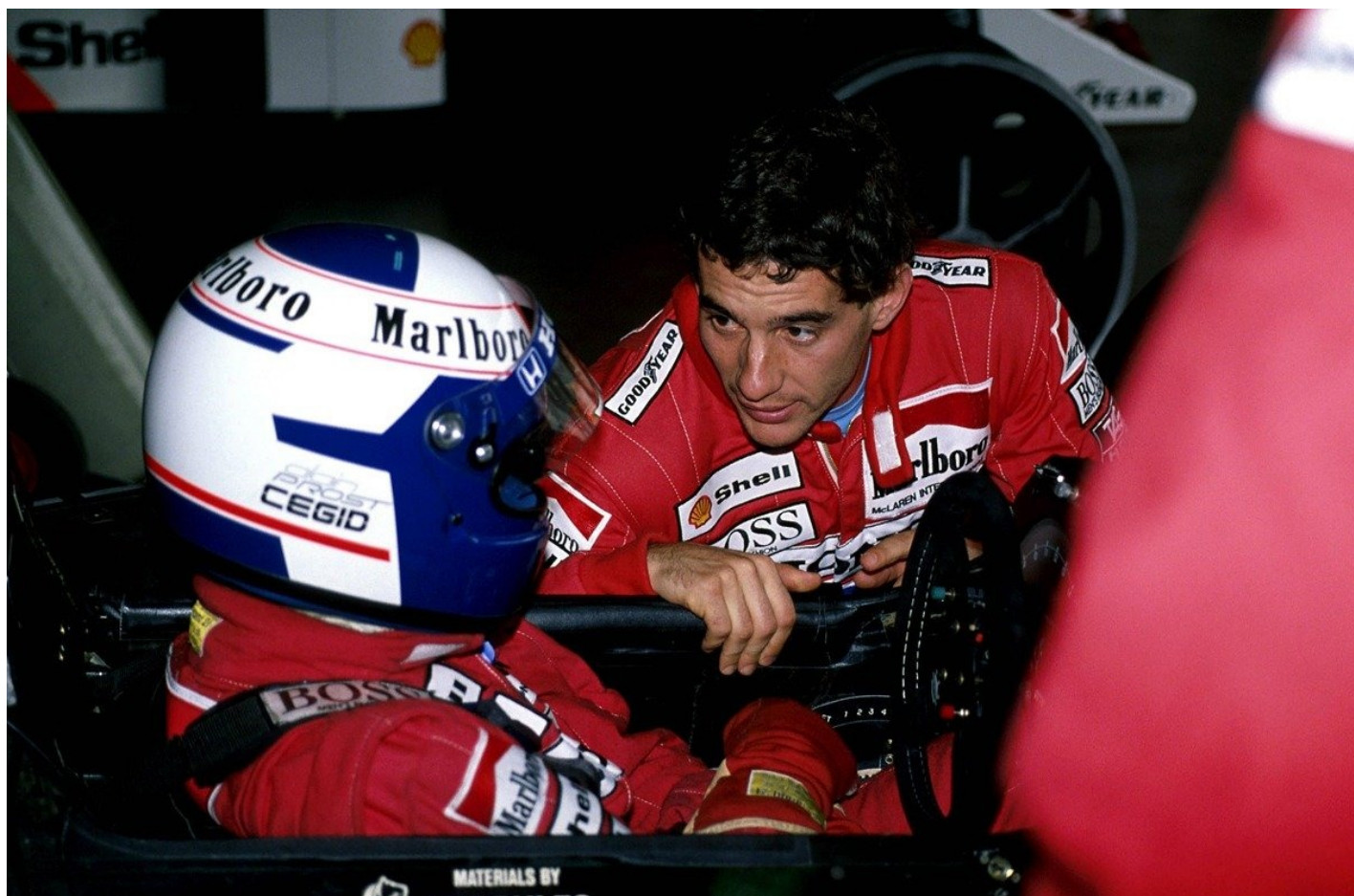
Май 1989 года. Айртон Сенна и Ален Прост.