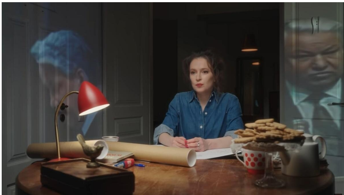
Скриншот из сериала «Предатели»

«Средства [сериала] манипулятивны, а потому для меня неприемлемы».