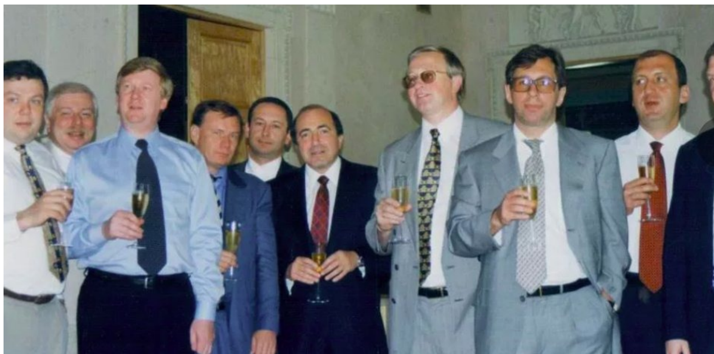
Скриншот из сериала «Предатели»

«Примитивный ответ на сложный вопрос о 90-х: «тогда не получилось, потому что к власти пришли воры с целью все украсть», — не просто лжив, но и крайне вреден для построения нормального будущего. Для этого нужен честный и беспристрастный анализ, а не популизм и рессентимент, крайне похожие на то, кстати, что говорит о 90-х путинская пропаганда».