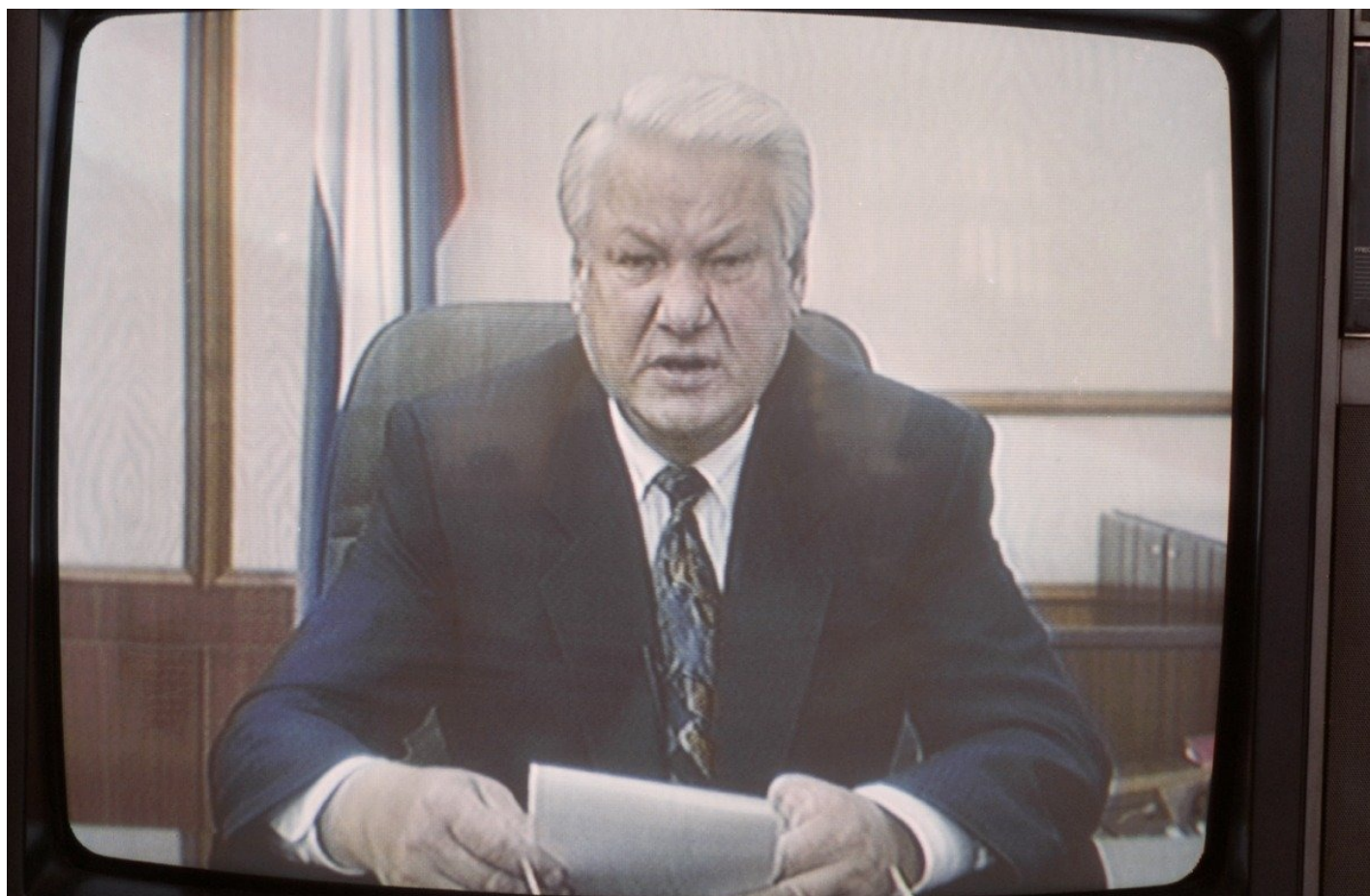
Октябрь 1993 года. Борис Ельцин во время телевизионного обращения в связи с массовыми беспорядками после подписания им указа о роспуске Съезда народных депутатов и Верховного Совета РФ