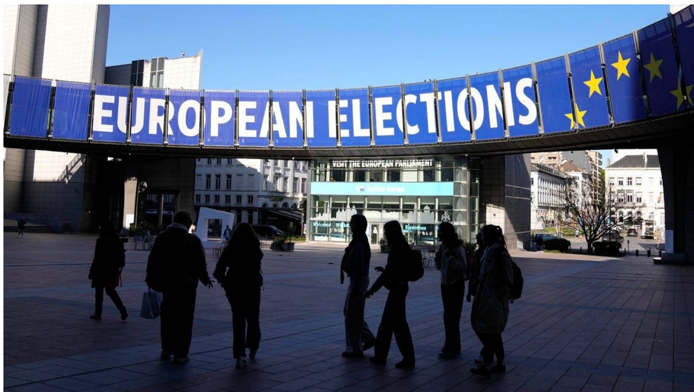
Брюссель в преддверии выборов в Европейский парламент.

В Европе нарастает политическое напряжение накануне июньских выборов в Европарламент. Ищут русский и китайский «след»