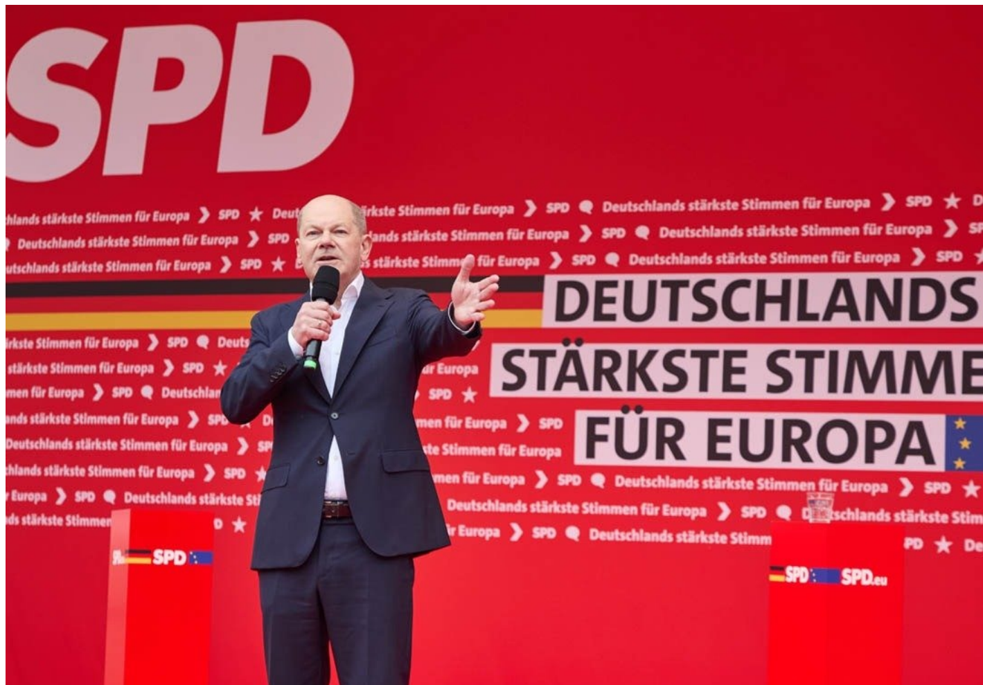
27 апреля 2024 года. Гамбург. Олаф Шольц во время открытия европейской избирательной кампании.

ХДС/ХСС — тоже показывает рейтинги выше, чем правящие социал-демократы, но с точки зрения июньских выборов опаснее популисты из «АдГ», которые набирают угрожающую силу в восточных землях (бывшей ГДР).