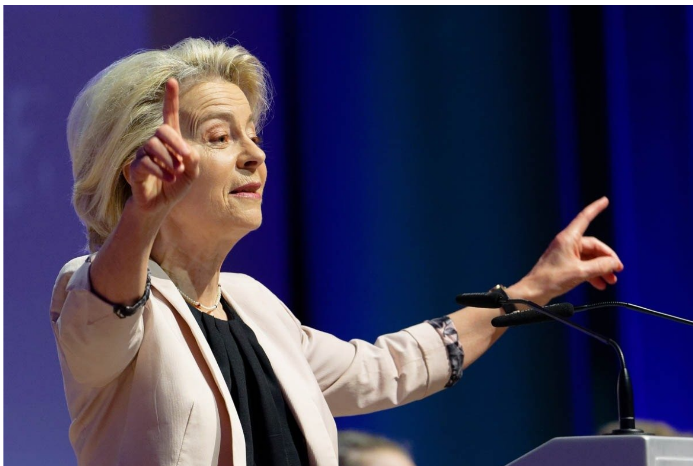
Глава Еврокомиссии Урсула фон дер Ляйен.

Поясню предысторию. Председателя Еврокомиссии (исполнительной коллегии ЕС) выбирают главы государств и правительств стран ЕС путем негласных консультаций. Потом оформляют это через Европарламент. На прошлых выборах возникла идея назначать «шпитценкандидатом» (главным кандидатом) лидера самой многочисленной фракции Европарламента. То есть так же, как обычно назначают глав правительств в европейских демократиях. Им тогда оказался лидер Европейской народной партии (ЕНП), христианский демократ из Германии Манфред Вебер. Но главы государств и правительств решили назначить его соотечественницу и члена той же партии, бывшего министра обороны ФРГ фон дер Ляйен.