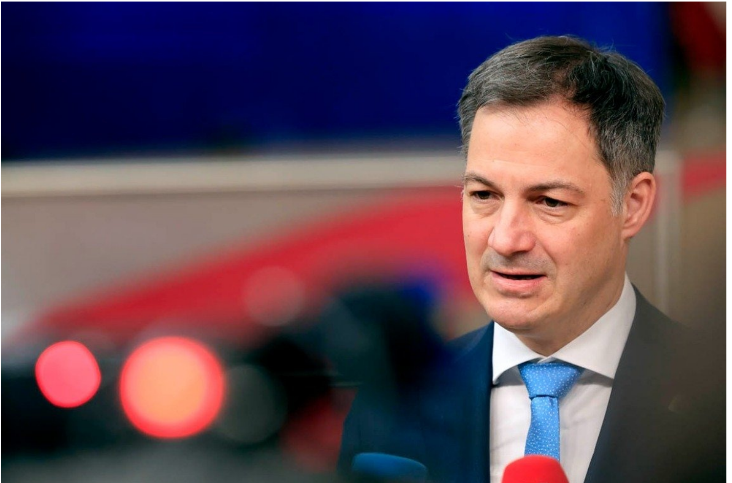
Премьер-министр Бельгии Александр Де Кро.

судебного расследования предполагаемых случаев вмешательства России в европейские выборы.