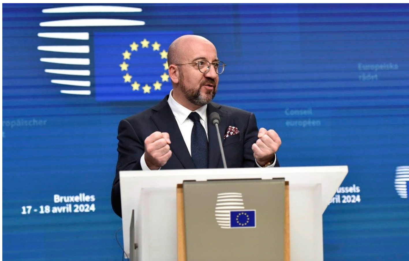
Председатель Европейского совета Шарль Мишель.

Этим будут заниматься в течение ближайших пяти лет избираемый в июне Европарламент и формируемая в этом году Еврокомиссия.