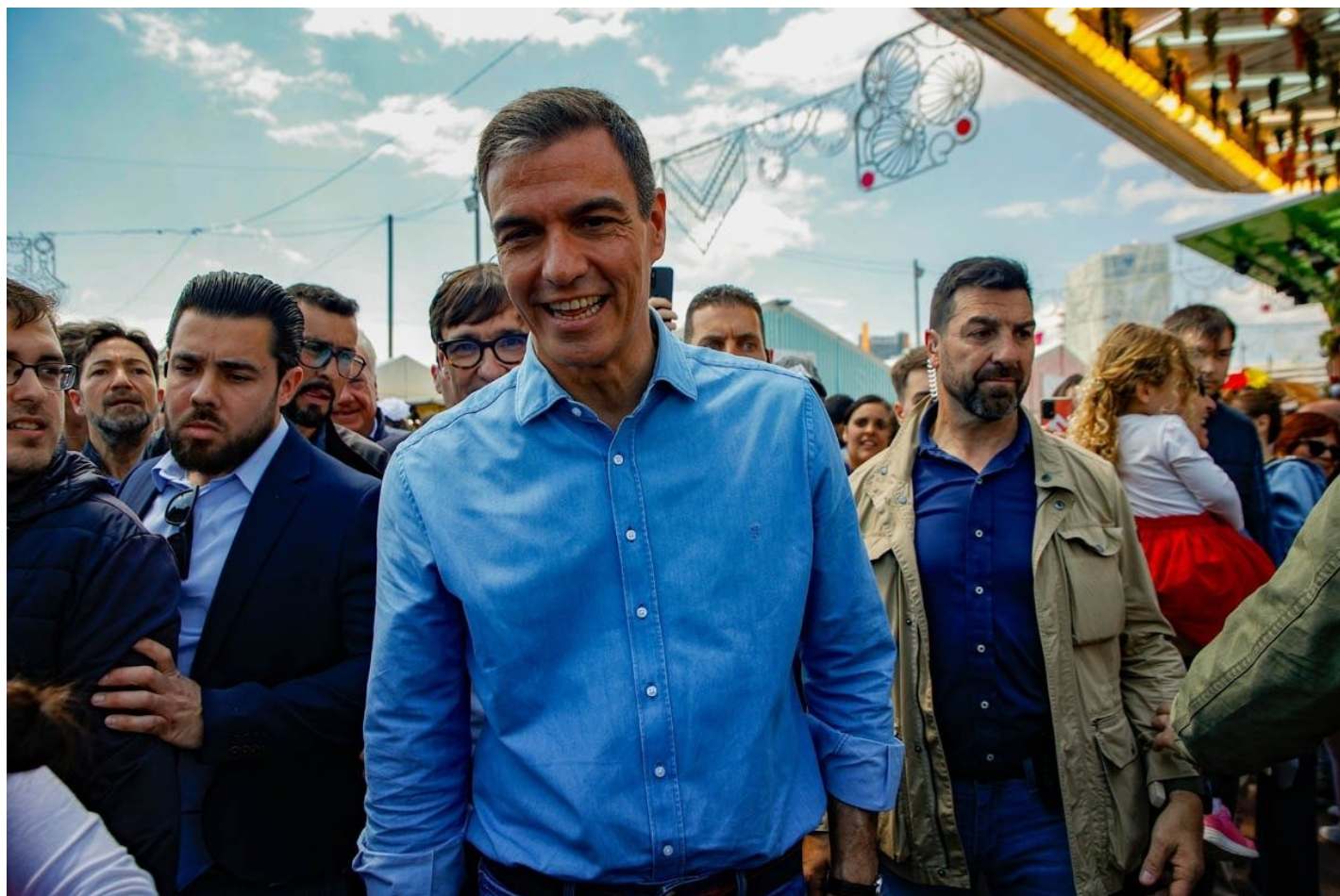
Премьер Испании Педро Санчес.

Несостоявшаяся «отставка» премьера Испании Педро Санчеса , нарочно или нет, послужила предвыборной пиар-акцией и способствовала подъему рейтинга испанских социалистов в предвыборной гонке «за июнь». Подвергшись атаке со стороны крайне правых под предлогом расследования бизнеса его жены, испанский премьер с порывистостью идадьго объявил о своем уходе с поста. В стране развернулось движение в его поддержку, прошли демонстрации, участники которых просили популярного премьера («испанского красавчика», как его называют в Брюсселе) остаться. И он остался.