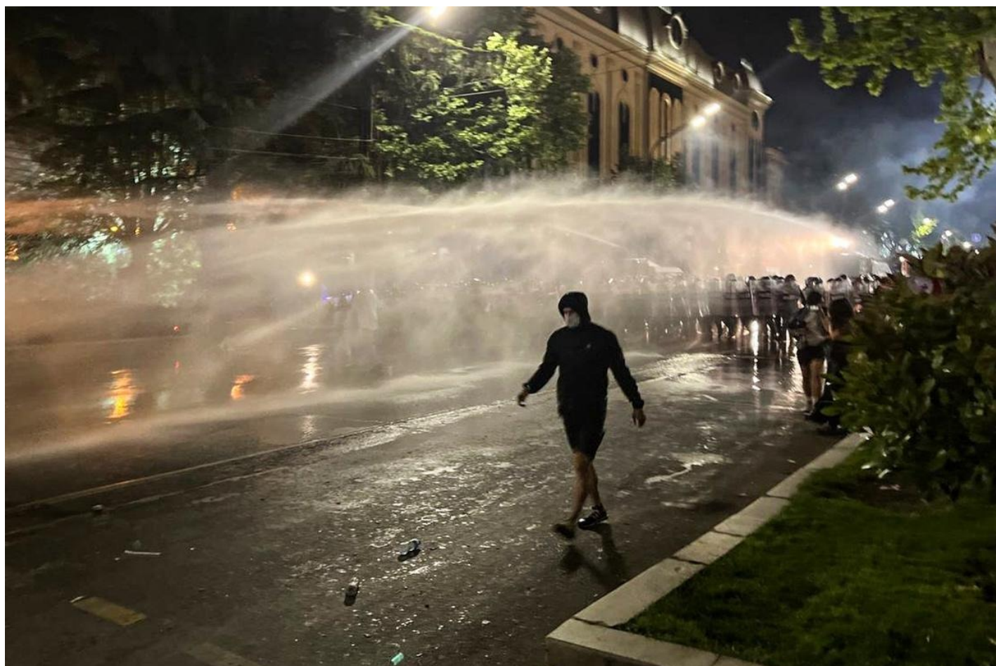
Участники акции протеста против законопроекта об иноагентах.

И Европа всегда будет бороться за выполнение своей цивилизаторской миссии: да, вмешиваться во внутренние дела недемократических стран с помощью «инструментализированных» с этой целью НПО, финансировать альтернативы, всячески поощрять свободу слова, усиливать гражданскую активность, повышать вероятность смены (а затем и «сменяемости») власти как составной части упомянутой «несущей конструкции».