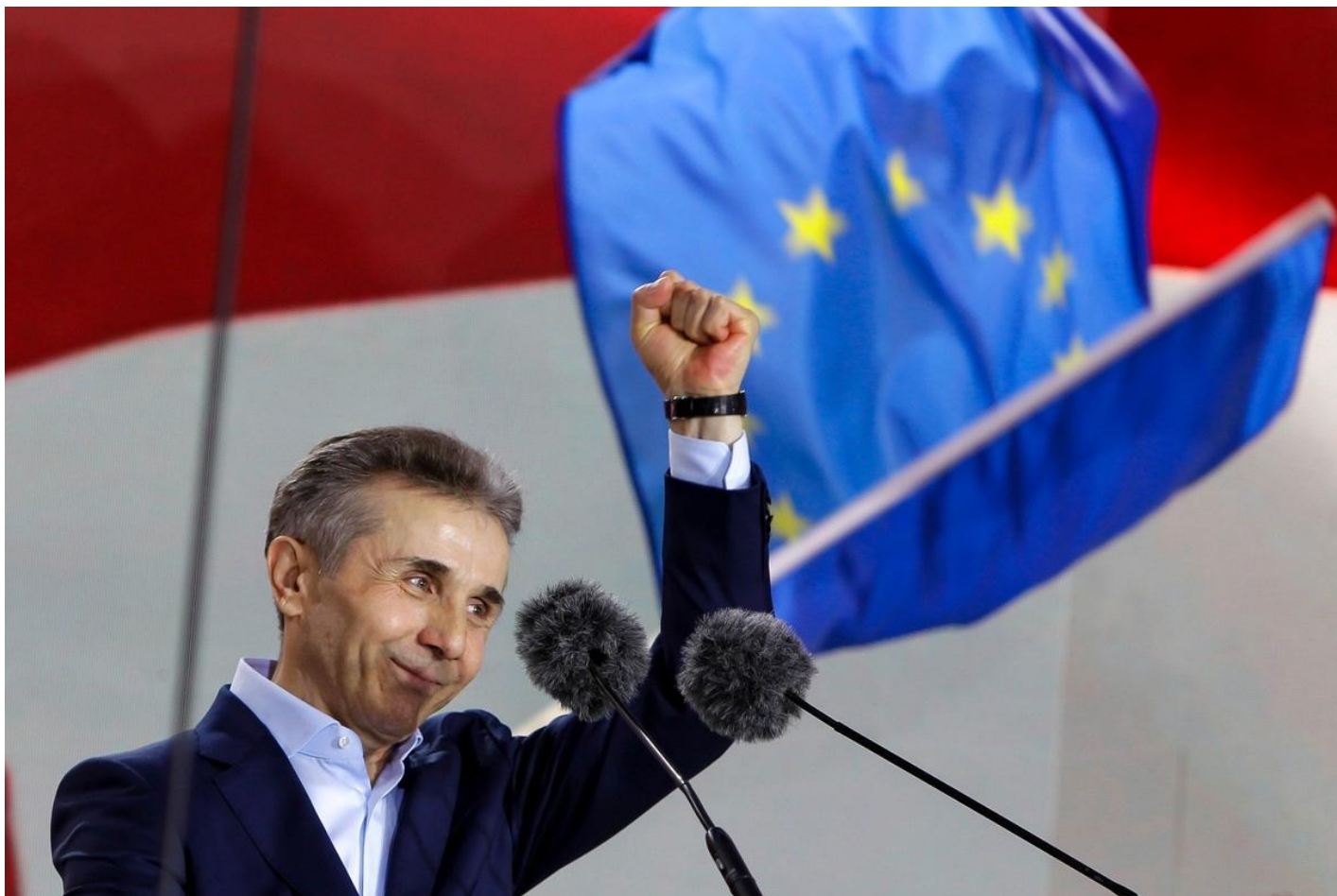
Бидзина Иванишвили на акции в поддержку закона об иноагентах.

отношения с Западом, где реально хранятся его миллиарды (на этот момент почему-то мало кто обращает внимание, а ведь зря), и в целом подводящий Грузию на порог очередной революции, а может, и кровопролития.