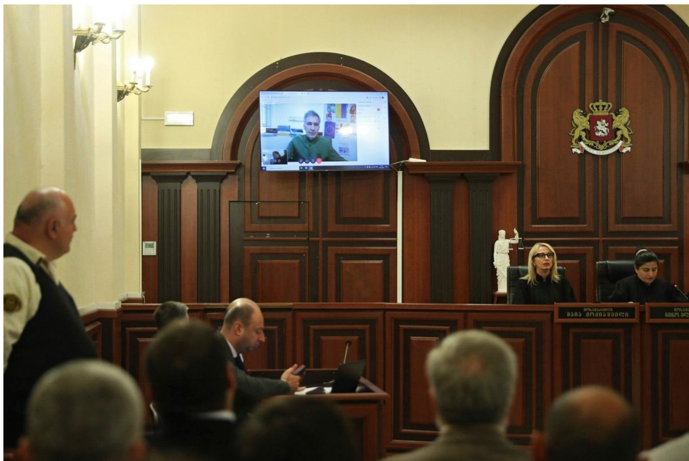
Заседание суда по делу экс-президента Грузии Михаила Саакашвили в Тбилиси.

Как это ни парадоксально, если Иванишвили сейчас удастся избежать революции и «дожить до выборов», то, по абсолютно всем опросам, на любых демократических выборах его партия наверняка победит «Единое национальное движение» (ЕНД) Михаила Саакашвили, поскольку большинство избирателей помнят то, о чем не помнят двадцатилетние: бомбардировки, сожжение целых городов, обезглавленные трупы, валяющиеся на улицах, массово изнасилованные женщины, кровавые этнические чистки и беженцы.