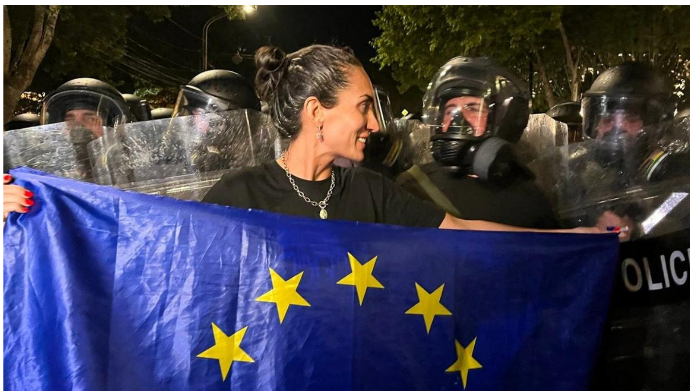
Участники акции протеста против законопроекта об иноагентах. Тбилиси.

Протесты в Грузии из-за закона «об иноагентах» — конфликт эпох, в котором компромисс невозможен, а кульминация впереди